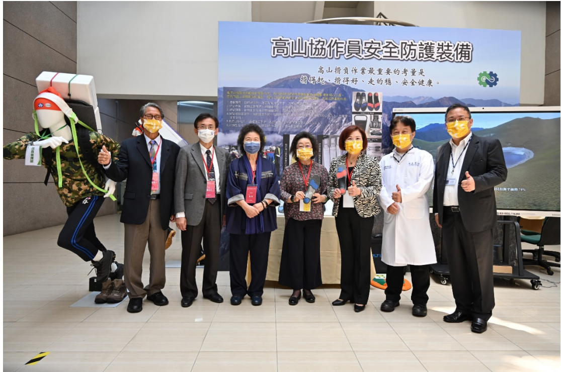
監察院社會福利及衛生環境委員會於勞安所巡察高山協作員安全防護裝備