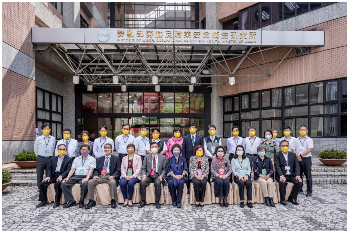
監察院社會福利及衛生環境委員會巡察勞安所與勞動部長及勞安所主管人員合影

會議中，院長陳菊特別關切 COVID-19 疫情延燒迄今，勞工朋友的就業安全及權益保障。蕭自佑召集人關心勞安所研究成果之運用與推廣等議題。巡察委員另就青少年職安問題研究、勞動教育促進法訂定情形、疫情對勞動力市場之影響、缺工問題、職災預防、職災失能、勞退新制及改善提撥率、公共設施經費提撥於勞工安全衛生之比率、家庭看護工仲介費等議題提問並提出多項建言。由勞動部許銘春部長及勞安所何所長就委員提問，作簡要說明與回應。