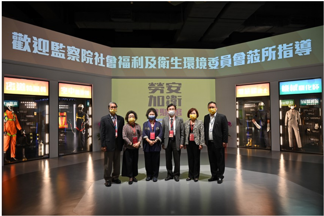
監察院社會福利及衛生環境委員會巡察巡察勞安加衛體驗館-1