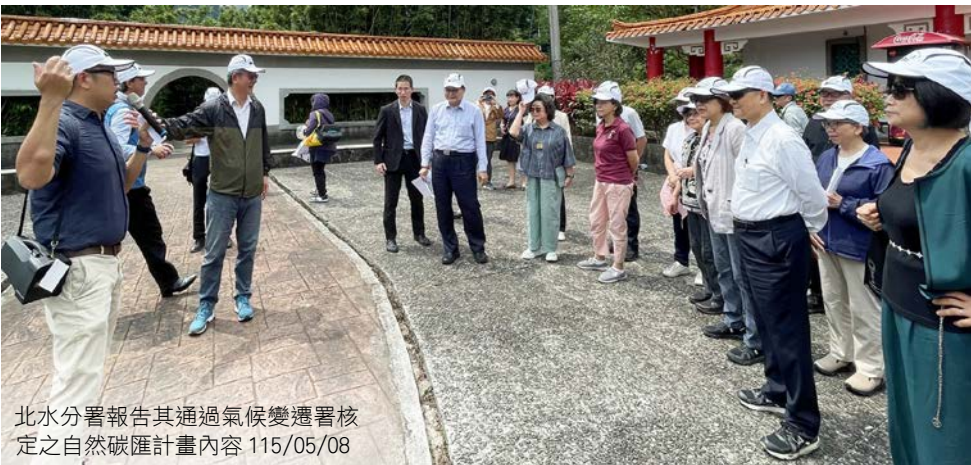
北水分署報告其通過氣候變遷署核定之自然碳匯計畫內容 115/05/08

監察委員於巡察結束時表示，期盼氣候變遷署透過跨域協作與周延治理機制，強化減量措施及法規制度建構，以提升我國因應氣候變遷之整體治理能力。面對全球氣候變遷浪潮，淨零轉型已成為國家治理與產業發展的重要課題，氣候變遷署應發揮統籌協調功能，採取更積極與前瞻的行政作為，透過跨部門合作與公私協力，落實各項減碳與調適政策，引導臺灣穩健邁向 2050 淨零轉型的目標，打造國家永續的韌性未來。