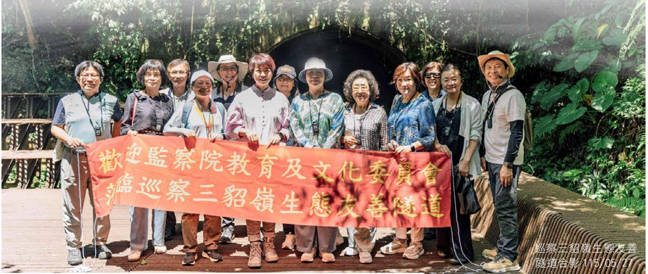
巡察三貂嶺生態友善隧道合影 115/05/27

教育及文化委員會為瞭解三貂嶺生態友善隧道設施違失案調查報告之後續改善情形，115 年 5 月 27 日上午，由召集人葉大華委員率同監察委員計 11 人，實地巡察，除肯定新北市政府活化百年隧道兼顧文化保存與環境永續之努力，並敦促應落實調查意見，避免發生實際營運狀況與宣傳不符之窘境。