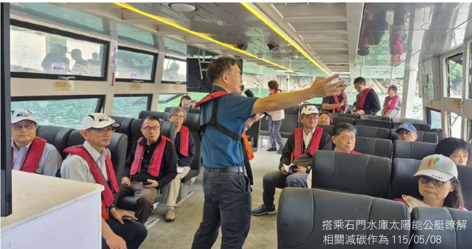
搭乘石門水庫太陽能公艇瞭解相關減碳作為 115/05/08

監察委員於巡察結束時表示，期盼氣候變遷署透過跨域協作與周延治理機制，強化減量措施及法規制度建構，以提升我國因應氣候變遷之整體治理能力。面對全球氣候變遷浪潮，淨零轉型已成為國家治理與產業發展的重要課題，氣候變遷署應發揮統籌協調功能，採取更積極與前瞻的行政作為，透過跨部門合作與公私協力，落實各項減碳與調適政策，引導臺灣穩健邁向 2050 淨零轉型的目標，打造國家永續的韌性未來。