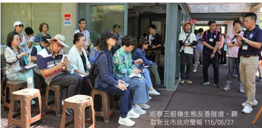
巡察三貂嶺生態友善隧道，聽取新北市政府簡報 115/05/27

召集人引用李洋部長致詞時所言，當運動部被信任，民眾才會投入運動，同樣地人民信任政府施政，才會更支持國家。冀盼運動部能針對歷次調查報告所提出的缺失，積極提出制度面與執行面的改革，健全我國全民運動環境與提升國際競爭力。