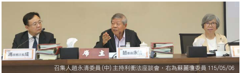
召集人趙永清委員(中)主持利衝法座談會，右為蘇麗瓊委員 115/05/06

監察院於 115 年 5 月 6 日召開「釐清多階段補助審查權責，減少關係人違反公職人員利益衝突迴避法」座談會，由廉政委員會召集人趙永清委員主持，邀集農業部、衛生福利部及運動部共同探討研商並達成共識，同意以機關對於補助流程中是否具有「合目的性之實質審查權限」，作為判斷補助機關之標準，並於中央補助計畫或公告、函知地方政府之公文中，具體敘明中央與地方之審查權責分工，使地方政府及申請人均能明確判斷補助機關，會議圓滿落幕。