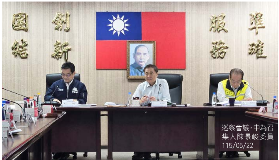
巡察會議，中為召集人陳景峻委員 115/05/22

監察院交通及採購委員會於 115 年 5 月 22 日由召集人陳景峻委員偕同監察委員等 14 人，以「推動軌道轉型升級、落實安全維護與文資保存」為巡察主軸，瞭解我國在高鐵延伸宜蘭計畫執行、臺鐵轉型後之經營及財務等、臺鐵相關鐵路行車安全改善及軌道結構安全提升與鐵道文化資產管理維護情形等。