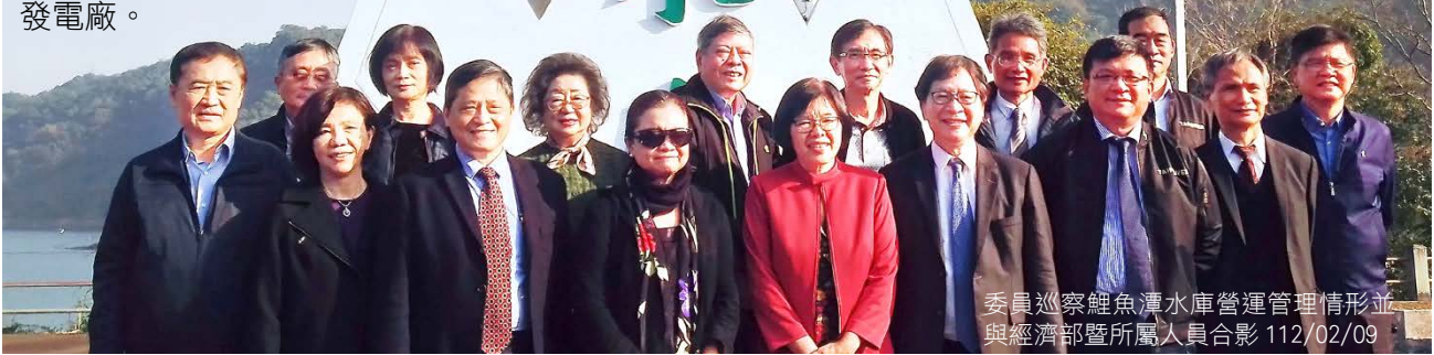
委員巡察鯉魚潭水庫營運管理情形並與經濟部暨所屬人員合影 112/02/09

監委聚焦降低自來水漏水率、耗水費推動、伏流水與人工湖開發、高屏地區用水安全、再生水推動、德基水庫營運現況、台灣電力供需、用電大戶電費、中油弊案連連與內控失靈、中油大林廠爆炸造成民眾恐慌、地熱開發、國營事業組織文化再造、LNG（液化天然氣）儲槽等關鍵基礎設施抗炸能力、國營事業與民眾及環保團體溝通能力加強等議題，並提出多項建言。