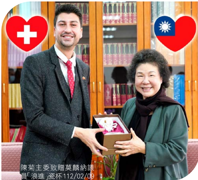
陳菊主委致贈莫麟納議員「浪進」瓷杯 112/02/09