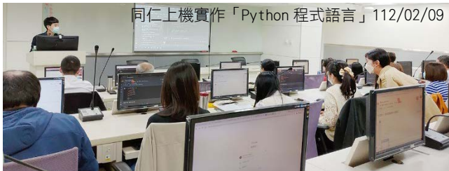
同仁上機實作「Python 程式語言」112/02/09

家庭及教育議題」，分享政府數據資料應用實例，並邀請國立臺灣大學郭耀仁講師講授「Python 程式語言」，提升同仁數據分析之程式設計能力，同仁均能增進專業知能，厚植調查能力。