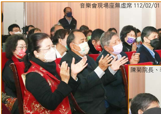
音樂會現場座無虛席 112/02/01

監察院為歡慶 92 歲生日，於 112 年 2 月 1 日在院內禮堂舉辦「2023 院慶樂樂樂」午間音樂會。