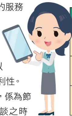
監察院數位化陳情服務系統簡介

如民眾欲向監察院陳情，可視個人陳情需要，至監察院全球資訊網/「便民服務」項下或掃描上方 QR Code，選用各項陳情服務系統（登錄資料前請詳閱注意事項）。