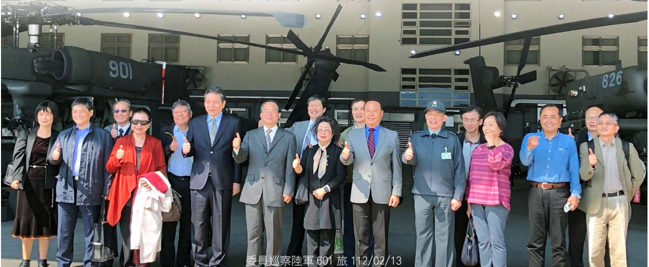
委員巡察陸軍 601 旅 112/02/13

隨後轉往陸軍 601 旅，視察該旅戰備整備現況，除聽取 AH-64E 阿帕契攻擊直升機、UH-60M 黑鷹運輸直升機性能簡報外，並體驗阿帕契模擬機操作。最後，前往中科院視導執行《海空戰力提升計畫採購特別條例》精準飛彈量產情形，均留下深刻印象。