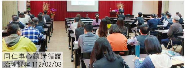
同仁專心聽講循證治理課程 112/02/03

美國於 2019 年實施「循證決策基礎法」(Foundations for Evidence-Based Policymaking Act)，旨在要求政府應運用公部門巨量資料，作為政策評估和制定之基礎，近年我國學界亦力倡政府應導入「循證治理」觀念。監察調查工作旨在監督政府施政成效，運用科技方法及引進最新觀念，持續優化調查的方法及技巧，為監察調查人員培育及訓練的重點。監察院監察調查處為培育科技監察人才，亦依訓練計畫開設相關課程，於 112 年 2 月份邀請國家教育研究院陳婉琪主任講授「循證治理：性別、