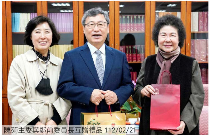
陳菊主委與鄭前委員長互贈禮品 112/02/21