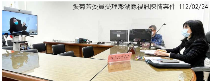
張菊芳委員受理澎湖縣視訊陳情案件 112/02/24

監察院於 112 年 2 月 24 日由監察委員張菊芳受理澎湖縣之遠距視訊陳情案件，讓離島縣市民眾不用飄洋過海，可就近在當地之審計處室，透過視訊連線方式向監察委員訴說冤屈，保障其陳情權益。