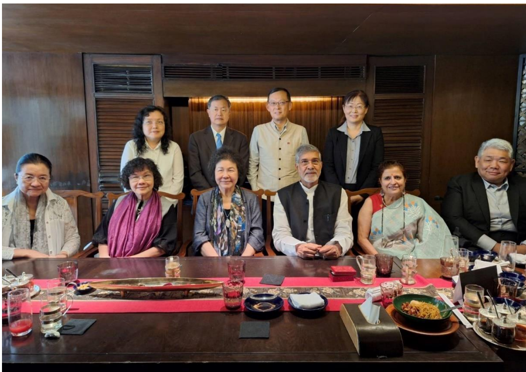
(代表團成員與 APF 秘書處、諾貝爾和平獎得主沙提雅提先生會晤)