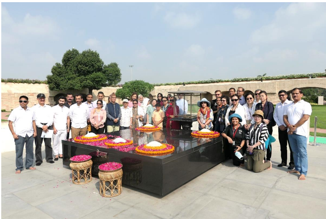
(代表團成員與 APF 會員參訪聖雄甘地墓)