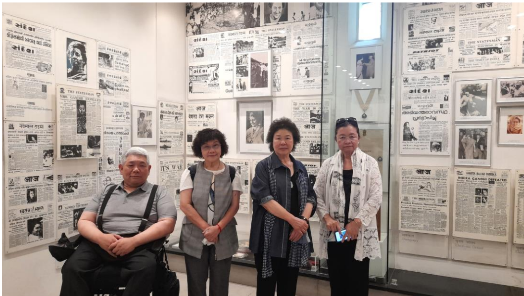
(代表團成員參訪甘地紀念館及英迪拉·甘地紀念館)