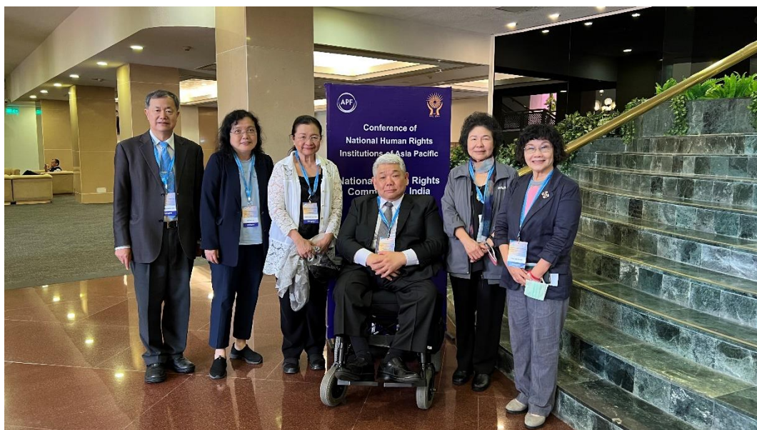
(代表團成員於印度科學宮國際會議中心出席 APF 會議)