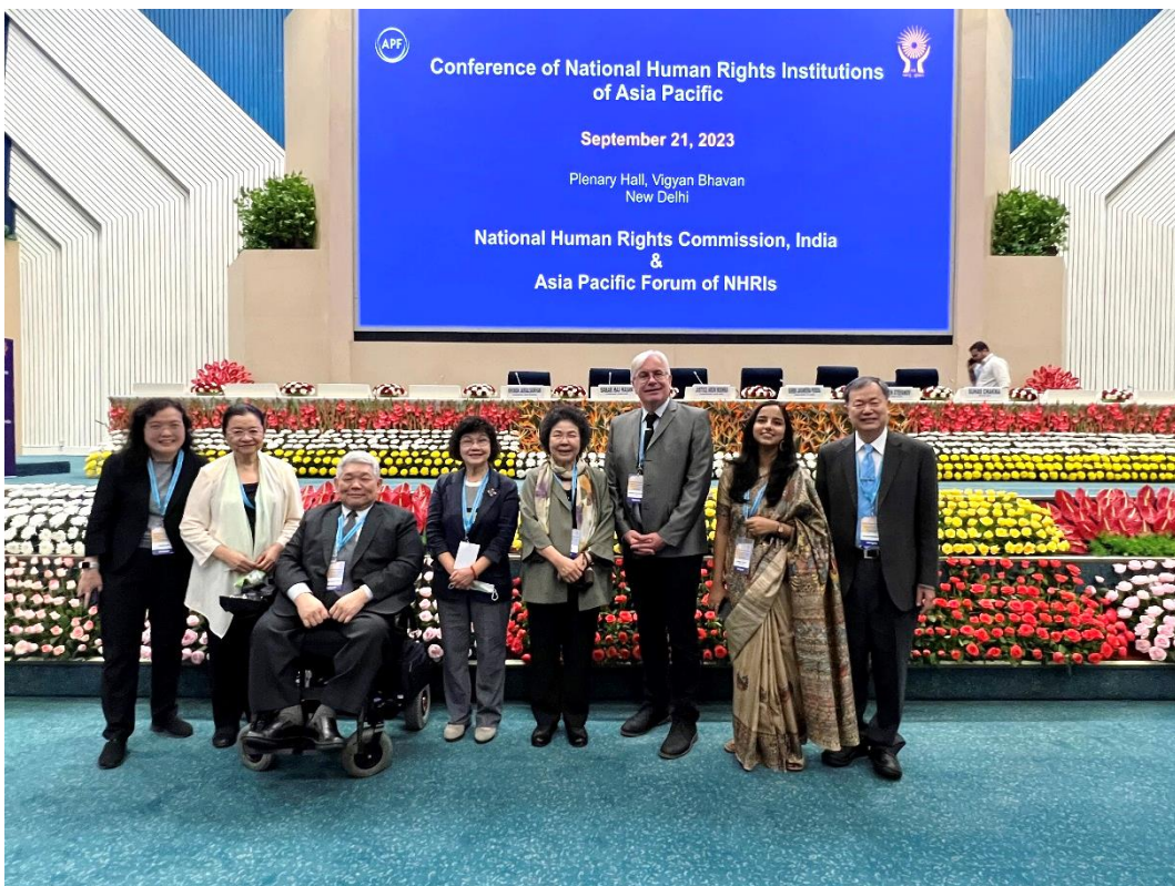
(代表團成員與 APF 秘書處主任、印度人權會幕僚合影)