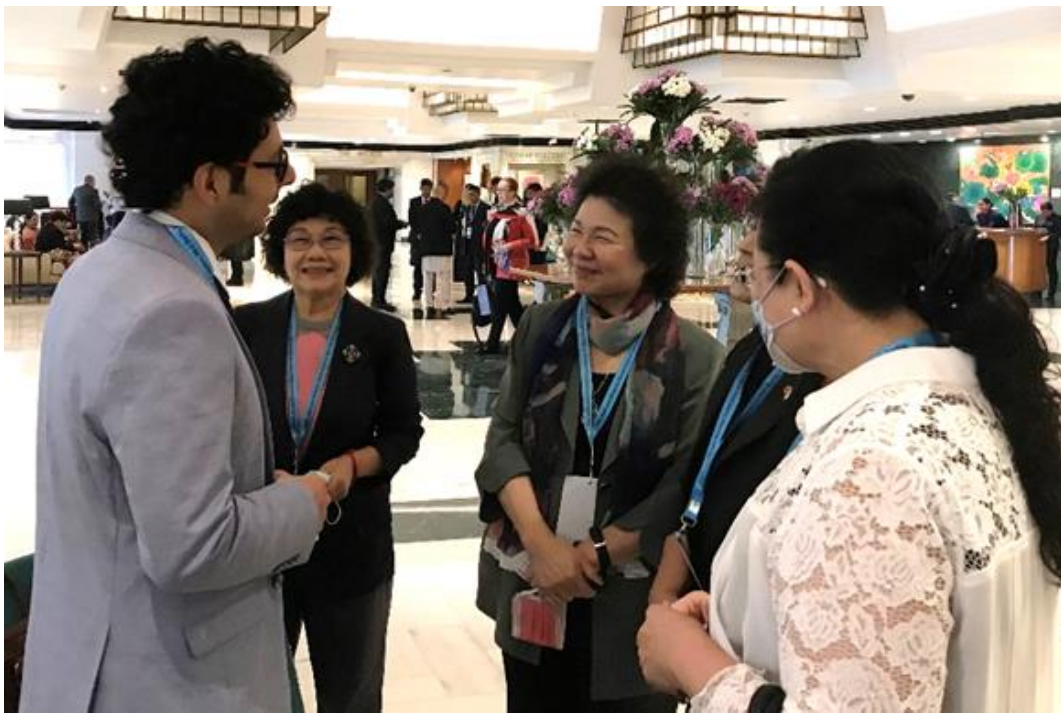
(代表團成員與 GANHRI 辦公室成員交流)