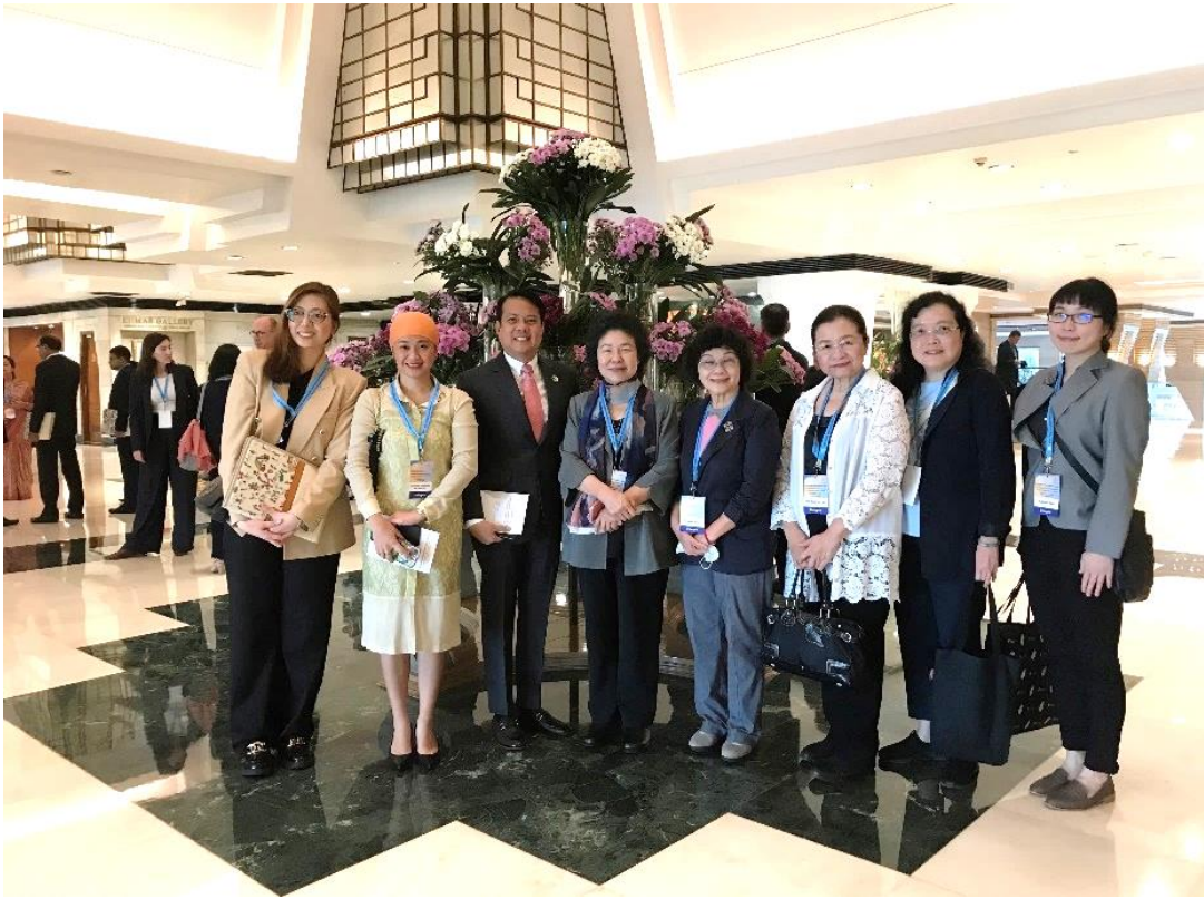
(代表團成員與菲律賓人權會成員合影)