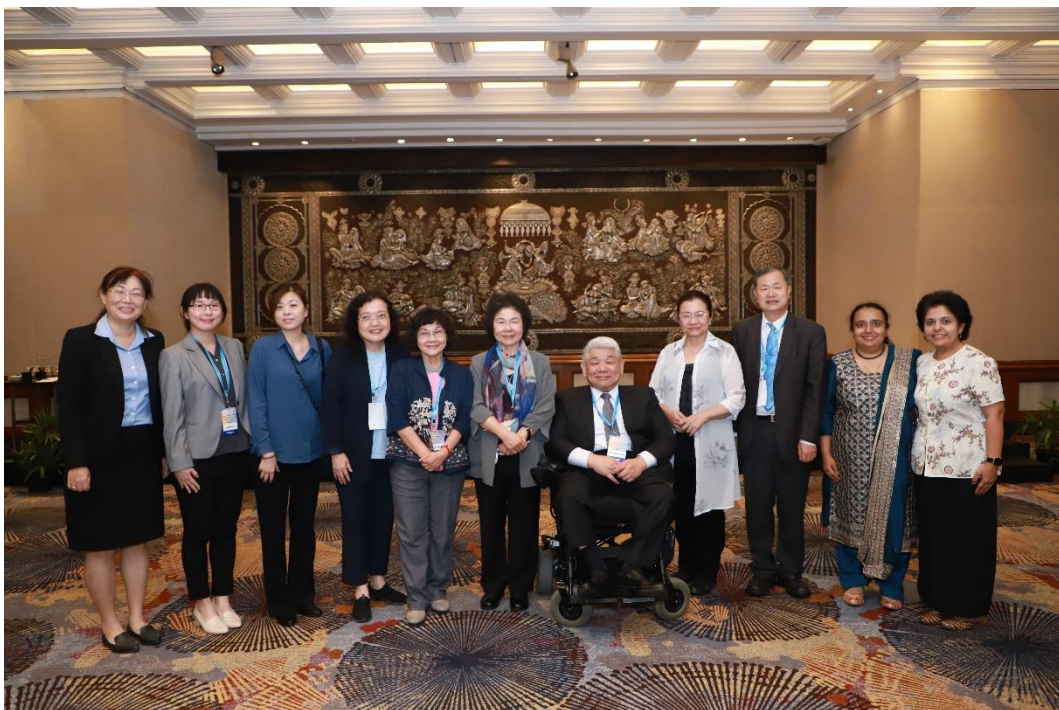
(代表團成員出席印度人權會主辦之文化晚宴活動)