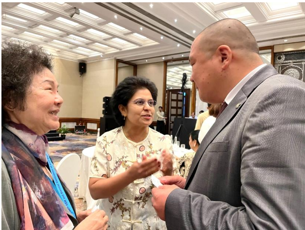
(代表團成員與韓國、蒙古人權會主席交流)