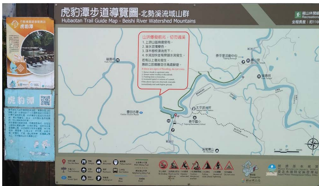
圖 3 事發後新北市雙溪區公所增設「山洪爆發前兆，切勿過溪」告示牌