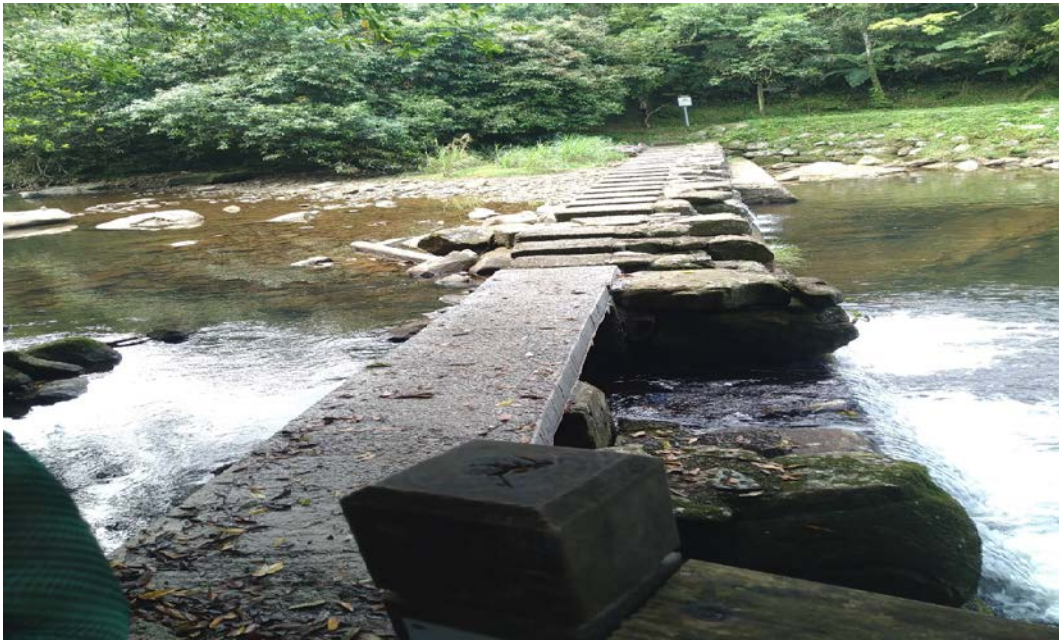
註：事發後石墩上木板已滅失，新北市雙溪區公所改鋪設水泥混凝土板塊。