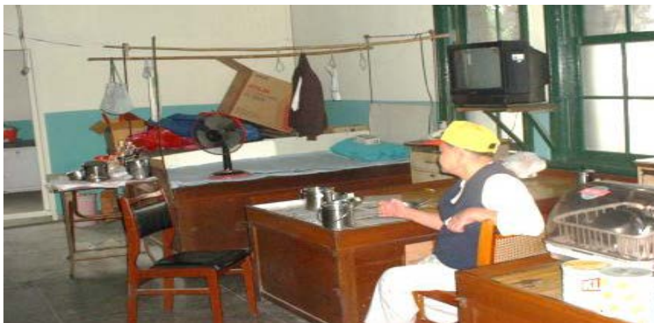
圖 2003 年拍攝蓬萊舍內裝照片（無隔間）

圖打壓院民集會活動，剝奪院民及相關公民團體合法使用蓬萊舍之權益，切斷院民與社會的連結等語。