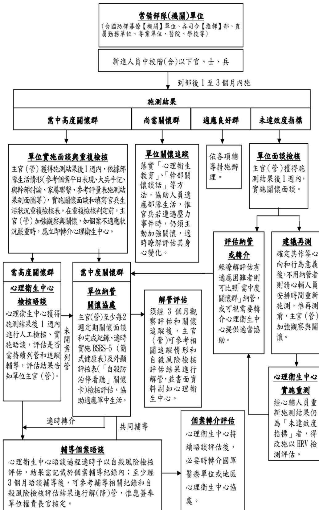
圖 2 「國軍身心狀況評量表(志願役版)」施測結果處遇流程