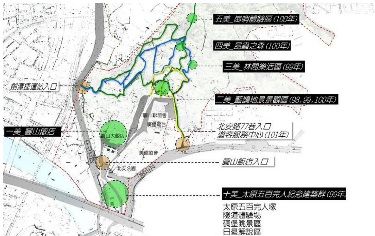
圖 1 圓山風景區景點導覽圖

常有民眾聚集聊天、泡茶、唱歌（卡拉 OK），甚至打麻將，故網站及部落格描述其「數量驚人蔚為奇觀」、「令人歎為觀止，成為特殊景觀」（註 3）。