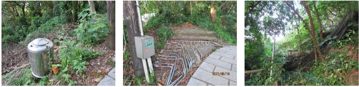
圖 3 本院 110 年 9 月 14 日現場勘察照片

(四) 綜上，劍潭山步道不僅是臺北市民晨運健身的場所，也是國際旅客常造訪的景點，該步道沿途均為公有土地，早期由民眾自建近 300 處休憩平台，迄今仍羅列諸如早覺會、山友會、羽球社、體育會、歌友會等私人團體所設置之房舍、鋪面、棚架等各式各樣設施及設備，市府雖自 102 年起陸續回收閒置休憩場域，惟迄 110 年底，小小山頭上仍有 188 處休憩平台尚未處理，且部分棚架毀損、水電管路雜亂，或封閉私用、或破壞自然環境，臨中山北路側地勢陡峻，更受捷運線長期擾動影響，不僅嚴重破壞該親山步道整體景觀，亦恐有危害公共安全之虞。該府雖稱 111 年將再拆除 15 處休憩平台，惟處理速度實屬緩慢，顯見該府未善盡維護公有場域及國際觀瞻之責，核有違失。又，臺北市自詡為首善之都，復為國際都會城市，類此之風景區（親山步道）甚多，該府允宜藉由本案進而整體檢討，或訂定法令予以明確規範，或研擬具體管理維護機制，俾回歸優美自然山林景致。