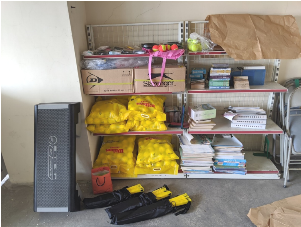
圖 2 麗園國小活動中心 3 樓音控室，網球隊購置訓練器材置放情形（109 年 8 月 27 日拍攝）