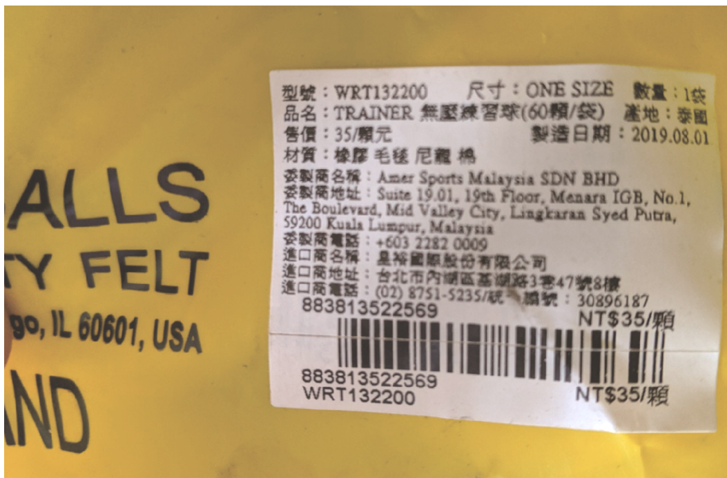
圖 3 網球隊購置訓練器材之練習球 8 袋共 480 顆球，其製造日期為 108 年 8 月 1 日（109 年 8 月 27 日拍攝）