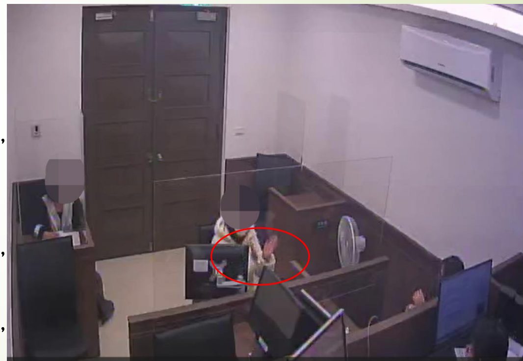
陳姓社工於偵訊過程中時有高舉雙手於胸前以輔助說明之動作

本院檢視檢察官113年3月12日晚間偵訊陳姓社工之錄影畫面，明顯可見陳姓社工當時進入偵查庭後，係以雙手將身分證交予法警；另於偵訊過程中回答檢察官問題時，時有高舉雙手於胸前輔助說明；以雙手扶眼鏡、翻閱檢察官提示之卷宗等動作，而上開動作與一般人通常係以單手為之相較明顯不自然，而在陳姓社工遞交身分證及翻閱卷宗時，法警均站立於陳姓社工身旁，因此尚難謂檢察官、書記官及法警當時均沒有注意到陳姓社工雙手為上銬狀態。