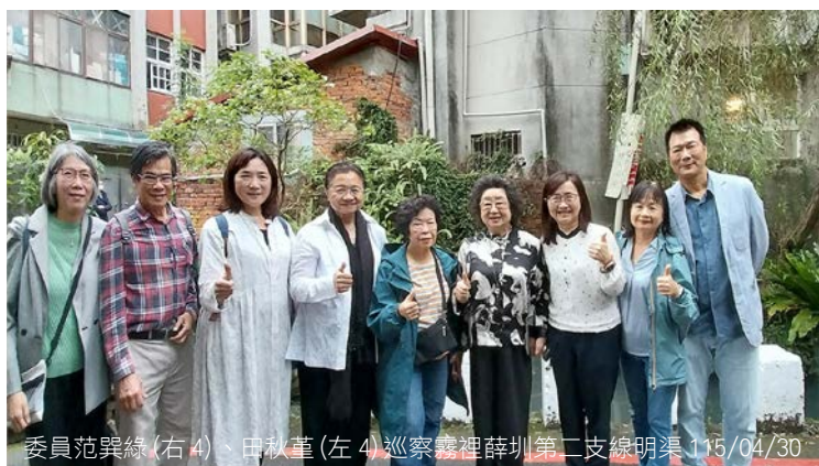
委員范巽綠(右4)、田秋堇(左4)巡察霧裡薛圳第二支線明渠 115/04/30

監察委員范巽綠、田秋堇 4 月 30 日巡察臺北市，瞭解霧裡薛圳第二支線明渠、菊元百貨等文化資產現況，並關切臺北市府(下稱市府)對於文化資產重點區域內危老改建、都市更新案整體評估作業流程，及未來城市發展模式；接續赴忠義教育社福園區，瞭解臺北市因應高齡化、少子化社會之舊校舍再利用情形。