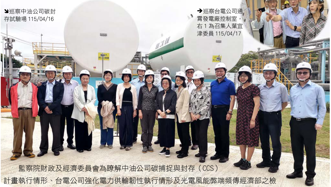
→ 巡察台電公司通霄發電廠控制室，右1為召集人葉宜津委員 115/04/17

監察院財政及經濟委員會為瞭解中油公司碳捕捉與封存 (CCS) 計畫執行情形、台電公司強化電力供輸韌性執行情形及光電風能弊端頻傳經濟部之檢討策進作為，於 115 年 4 月 16、17 日分別由中油公司總經理張敏、台電公司董事長曾文生及經濟部