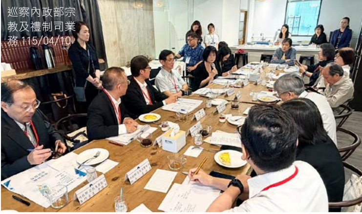
巡察內政部宗教及禮制司業務 115/04/10

監察院內政及族群委員會召集人蔡崇義委員偕同委員一行 9 人，於 115 年 4 月 10 日巡察內政部宗教及禮制司，在內政部黃駿逸主任秘書及林振祿司長陪同下，先參訪世界宗教博物館，該館展出世界十大宗教信仰文化、建築，藉由館方導覽解說，深刻體會宗教團體弘揚宗教和平的公益精神，隨後進行巡察座談會，瞭解宗教及禮制司改制後的業務推動情形。