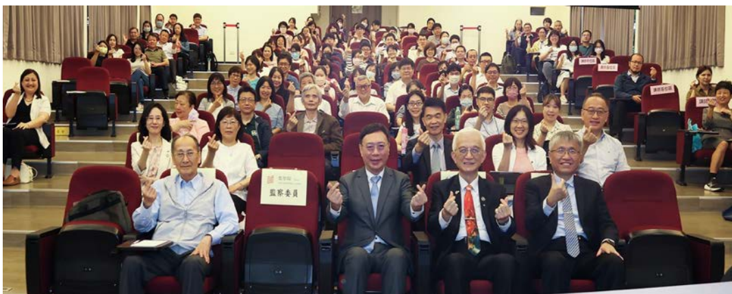
第三梯次研習合影 115/04/13

本次課程兼顧理論與實務，邀請台灣人工智慧發展學會(TIAI)榮譽理事長謝邦昌教授主講生成式 AI 的基礎認知與安全風險，並強調迎向 AI 時代「變革」之重要性。另由審計部分享數位審計推動成果，透過案例解析，展示 AI 技術應用成效。