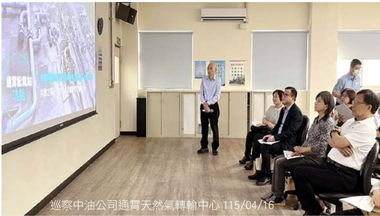
巡察中油公司通霄天然氣轉輸中心 115/04/16

監察院財政及經濟委員會為瞭解中油公司碳捕捉與封存 (CCS) 計畫執行情形、台電公司強化電力供輸韌性執行情形及光電風能弊端頻傳經濟部之檢討策進作為，於 115 年 4 月 16、17 日分別由中油公司總經理張敏、台電公司董事長曾文生及經濟部