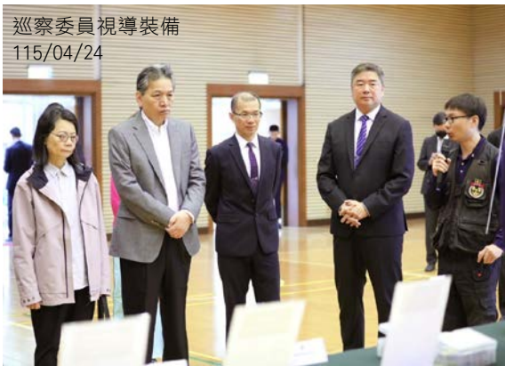
巡察委員視導裝備 115/04/24

巡察委員亦關切相關議題，包括國安局女性主管及女性維安人員之進用比例，對於中共軍備及編制的掌握與評估，新型態科技可能造成維安機密外洩之應對，以及外部監督及內部人員忠誠查核之風險控管情形等，並與蔡明彥局長就上述議題，進行廣泛討論及意見交換。