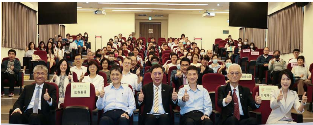
第二梯次研習合影 115/04/10