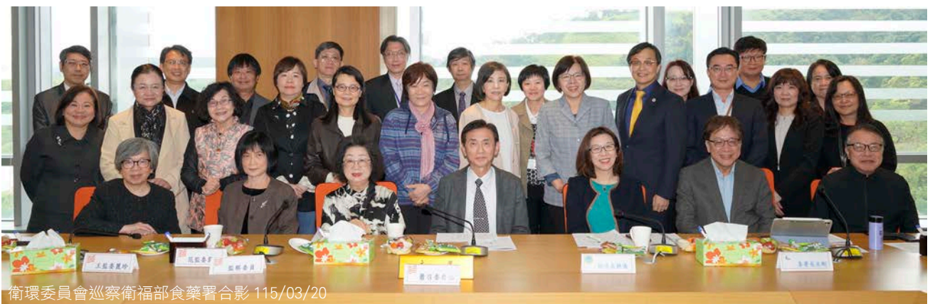
衛環委員會巡察衛福部食藥署合影 115/03/20