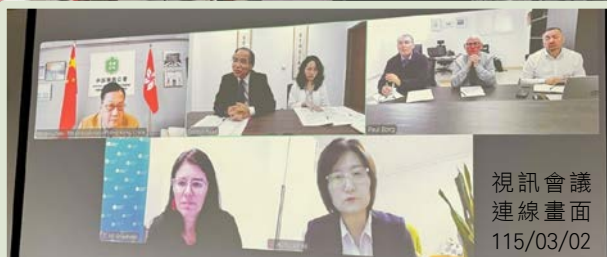
視訊會議 連線畫面 115/03/02