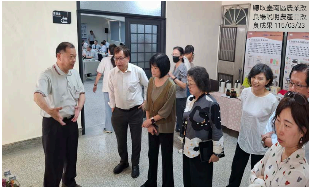
聽取臺南區農業改良場說明農產品改良成果 115/03/23

會中監察委員關心農(漁)電共生的推展情形、禁止廚餘養豬的配套措施、友善雞蛋的推廣情形、農業相關資訊平台的整合情形、糧食安全、外籍漁工人權、山坡地水土保持及竹林病害等多項議題，與農業部進行意見交流並提出建言。