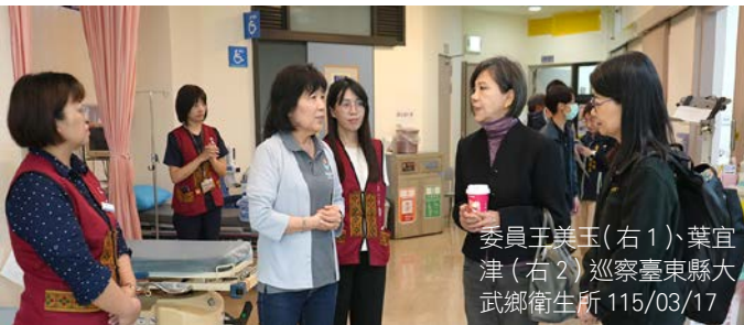
委員王美玉(右1)、葉宜津(右2)巡察臺東縣大武鄉衛生所 115/03/17

在巡察臺東縣期間，前往嗎哪庇護工場關切身障者職能訓練與就業環境；巡察縣立圖書館，期許藉由豐富館藏滿足使用者需求；巡察荊桐書屋課輔班，感謝愛悅協會對荊桐部落之付出與貢獻；巡察大武鄉衛生所，肯定其與高醫合作為南迴地區偏鄉醫療平權之努力，並於大武鄉受理民眾陳情。