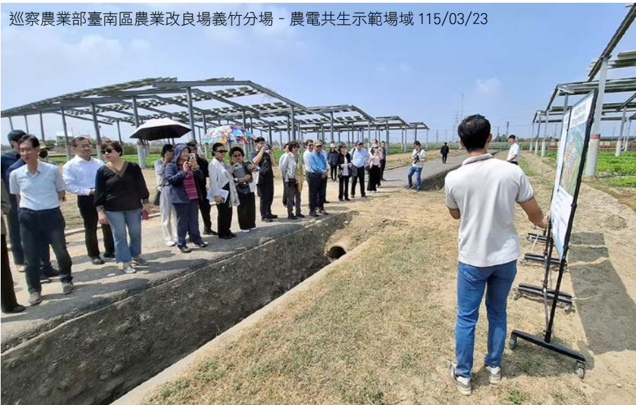
巡察農業部臺南區農業改良場義竹分場 - 農電共生示範場域 115/03/23

監察院財政及經濟委員會召集人葉宜津委員期許農業部在既有政策基礎上，持續精進相關制度與管理機制，妥善回應社會關注議題，包括農業與能源政策之協調、畜牧產業防疫管理與動物福利提升，以及食農教育之深化推動等，使我國農業在面對氣候變遷與國際市場變化時，能夠持續維持產業韌性與競爭力。