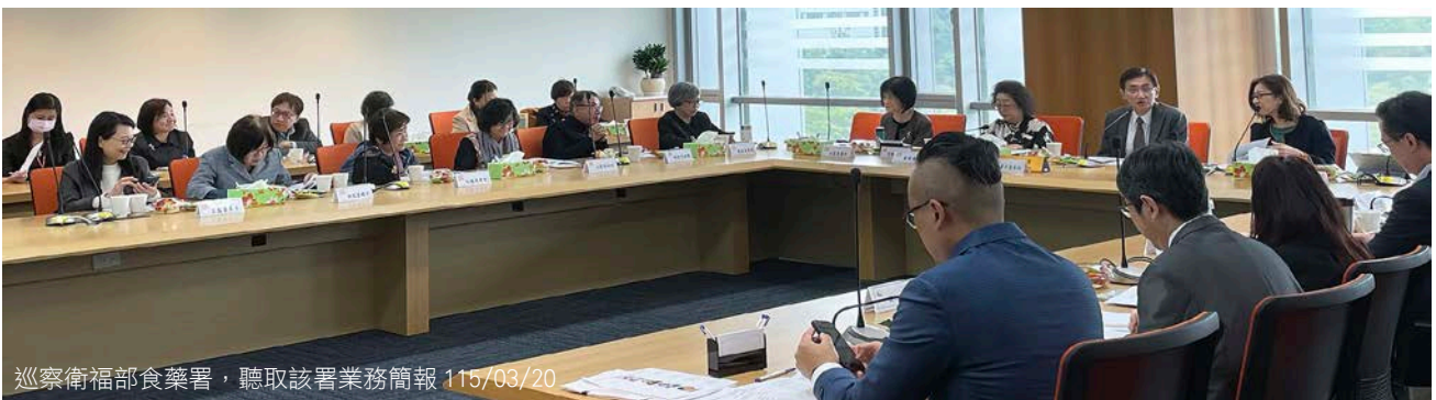
巡察衛福部食藥署，聽取該署業務簡報 115/03/20