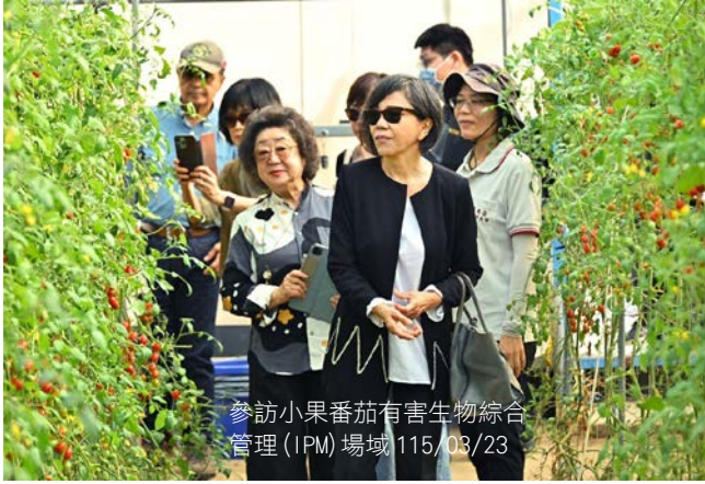
參訪小果番茄有害生物綜合管理 (IPM) 場域 115/03/23

監察院財政及經濟委員會於 115 年 3 月 23 日至 24 日上午由召集人葉宜津委員偕同多位監察委員巡察農業部，瞭解該部業務推展成效。