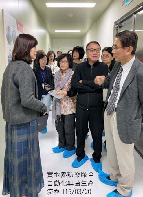
實地參訪藥廠全 自動化無菌生產 流程 115/03/20

監察院社會福利及衛生環境委員會於 115 年 3 月 20 日由召集人蕭自佑委員偕同監察委員等一行 13 人，巡察衛福部食藥署，由林靜儀次長陪同實地參訪藥廠全自動化無菌生產流程及符合國際優良製造規範（GMP）的藥品製造設施，隨後聽取姜至剛署長簡報並進行綜合座談。