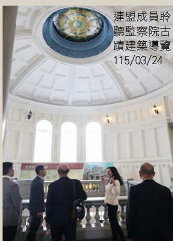
連盟成員聆聽監察院古蹟建築導覽 115/03/24

會中討論各區域理事長參加理事會會議之彈性作法、增進 IOI 理事會、執行委員會與全體會員透明溝通之方式，以及精進會員資格審認標準等議題，並決定由常設章程委員會主席於 115 年 5 月向 IOI 理事會報告前揭討論結果；監察院將持續積極關注相關議題之後續發展並適時提供建議意見，以善盡會員義務與責任。