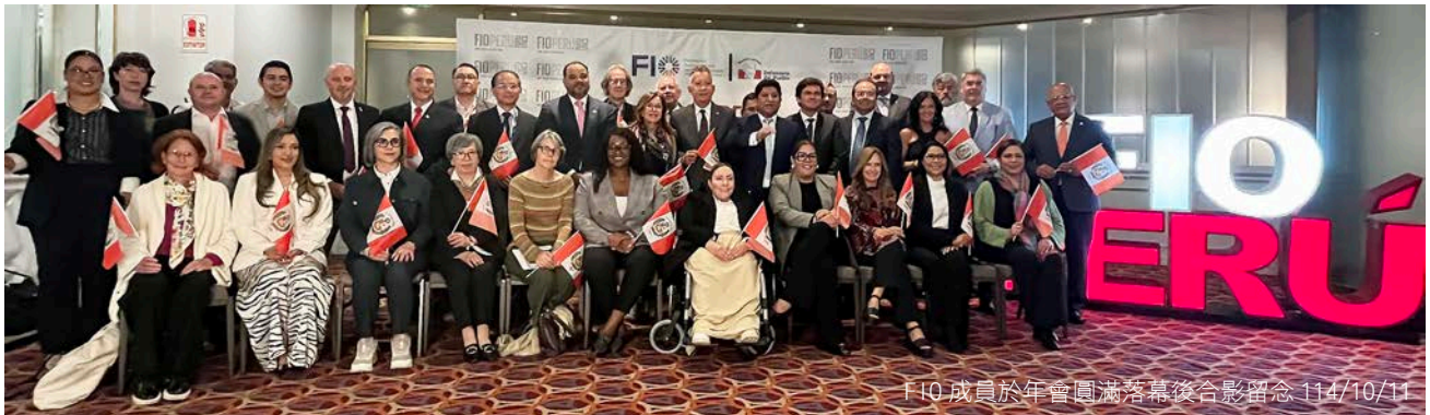
FIO 成員於年會圓滿落幕後合影留念 114/10/11