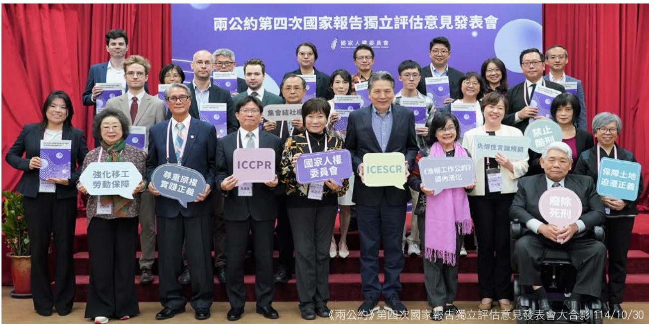
《兩公約》第四次國家報告獨立評估意見發表會大合影 114/10/30

出席活動者包括人權會王幼玲、王榮璋、葉大華、王麗珍等委員，以及監察院副院長李鴻鈞、監察委員范巽綠、蘇麗瓊、浦忠成與人權諮詢顧問洪偉勝等；加拿大、紐西蘭、澳洲、波蘭、德國等駐台機構代表及長期關注人權議題的專家學者、民間團體亦踴躍參與。