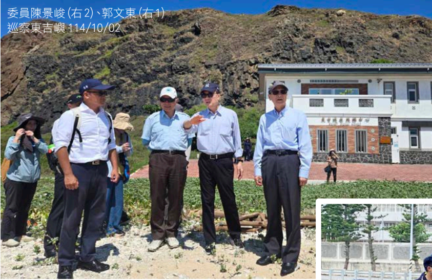
委員陳景峻(右2)、郭文東(右1) 巡察東吉嶼 114/10/02

監察委員陳景峻、郭文東 114年10月2日及3日赴澎湖縣巡察，瞭解南方四島國家公園生態景觀維護、垃圾處理及觀光發展概況，以及馬公內灣污染防治、水質改善、生態修復及漁業資源管理情形，並至雙湖園關切水資源回收中心營運現況、濕地管理成效。