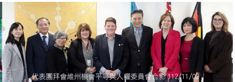
代表團拜會維州機會平等與人權委員會合影 112/11/02