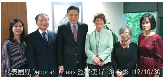
代表團與 Deborah Glass 監察使(右 3)合影 112/10/30