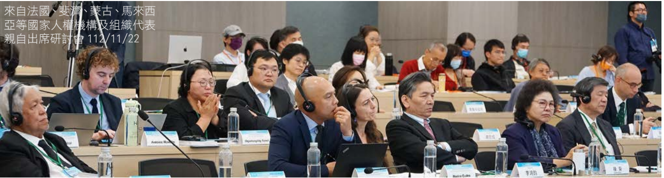
來自法國、斐濟、蒙古、馬來西亞等國家人權機構及組織代表親自出席研討會 112/11/22

首日議程聚焦氣候變遷對脆弱族群以及未來世代造成的影響，探討國家強化國際及區域合作，共同因應氣候變遷以及促進企業尊重人權的義務；第二天議程著重國家人權機構的職權，探討如何強化國家人權機構的獨立性和有效性，包括監督、接受申訴、與 NGO 團體協作，促進與保障人權，接軌國際人權標準。