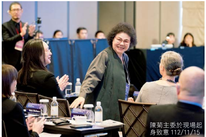
陳菊主委於現場起身致意 112/11/15

GCTF 由台美兩國於 2015 年合作成立，在日本及澳洲加入後成為四方合作的重要平台，迄今已在台灣及海外辦理 67 場研習活動，累計 127 個國家參與。這次為期 3 天的研習營，由國家人權委員會、外交部、數位發展部、資策會及美日澳加等駐台機構合作舉辦，來自印太及拉丁美洲 18 個國家的官員、學者、科技業者及公民社會代表與會。