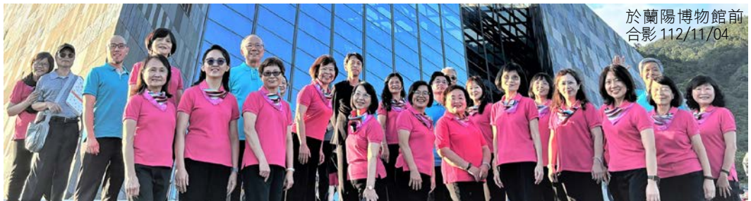
於蘭陽博物館前 合影 112/11/04

監察院晴聲合唱團於 112 年 11 月 4 日下午，在蘭陽博物館高挑的玻璃帷幕藝術空間中，以優