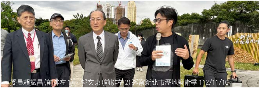
委員賴振昌(前排左1)、郭文東(前排左2)巡察新北市溼地藝術季 112/11/10

監察委員賴振昌、郭文東於 112 年 11 月 10 日赴新北市巡察，關切該市施政成效、112 年糾正案改善情形、藝術推廣效益、人工溼地建設及板橋果菜批發市場冷鏈物流中心建置執行進度。