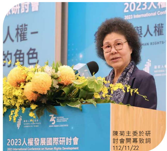
陳菊主委於研討會開幕致詞 112/11/22

國家人權委員會為配合聯合國人權事務高級專員辦事處 (UN Human Rights Office of the High Commissioner) 11 月的主題，舉辦這場為期 2 天的國際研討會，邀請亞太區域國家人權機構論壇 (APF)、太平洋共同體 (SPC)、歐盟、法國、菲律賓、馬來西亞、蒙古、丹麥等國家人權機構等代表，與國內人權學者專家、政府機關代表及 NGO 團體進行交流，共逾 200 人共襄盛舉。