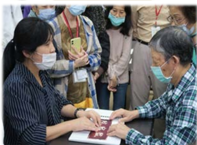
黃理事(左)指導學員 109/10/20