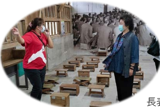
陳菊主委聽取導覽員解說戒嚴時代政治受難者聽訓的場景 109/10/06

委員會的職責，應做好促進人權教育推廣的工作。不義遺址的保存，提醒世人切莫重蹈覆轍，深具人權教育意涵。