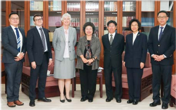
唐凱琳代表(左3)拜會陳菊院長 109/10/05

監察院陳菊院長於 109 年 10 月 5 日下午接見英國在台辦事處代表唐凱琳 (Catherine Nettleton)，陳院長表示成立國家人權委員會是代表台灣政府對人權的重視，期望未來與英國相關機構能有更多合作機會，共同為人權努力。