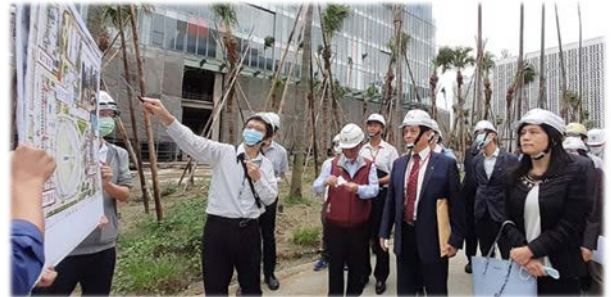
張菊芳(右 1)、賴振昌(右 2)委員視察臺北大巨蛋 109/10/22

監察委員在彭振聲副市長陪同下，視察臺北大巨蛋，並就第三次變更設計程序及公共安全相關事項，提出詢問，責請市府務必維護市民公共安全。