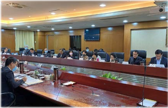
交通及採購委員會巡察交通部 109/10/29

監察院交通及採購委員會召集人林盛豐委員偕同監察委員，於 109 年 10 月 7 日巡察行政院公共工程委員會，對國內公共工程督導等議題進行垂詢。另於 10 月 23 日巡察國家運輸安全調查委員會，瞭解重大運輸事故調查作業執行情形及調查實驗室解讀能量。再於 10 月 29 日巡察交通部，瞭解該部施政計畫、紓困振興措施及前瞻軌道建設計畫執行情形，期許致力提升交通運輸安全及服務效能。