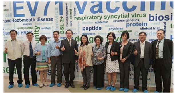
內政及族群委員會巡察瞭解疫苗製劑設備流程 109/10/26

監察院內政及族群委員會召集人王美玉委員等 14 位委員，於 109 年 10 月 26 日由衛生福利部食藥署陳惠芳副署長陪同，至新竹縣測試劑廠「普生股份有限公司」及疫苗廠「高端疫苗生物製劑股份有限公司」，瞭解國內新冠肺炎核酸檢測試劑及疫苗研發情形。另於 10 月 27 日赴衛生福利部，對於長照制度等議題提出詢問及建議。