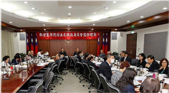
司法及獄政委員會聽取業務簡報 109/10/28

監察院司法及獄政委員會於 109 年 10 月 28 日由召集人蔡崇義委員偕同監察委員等 15 人巡察法務部，並聽取法務部、最高檢察署、矯正署、行政執行署業務簡報。委員對於測謊鑑定之證據能力問題及石木欽案之檢、調風紀問題；勿對精神障礙更生人歧視及差別待遇、應多開發精神障礙者之監護處分場所等議題，提出相關建議。