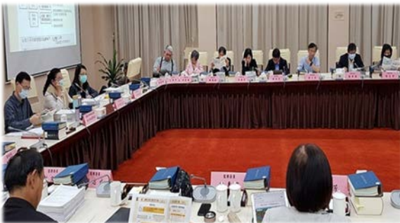
財政及經濟、內政及族群委員會聯席會議 109/10/20

監察院財政及經濟、內政及族群委員會於 109 年 10 月 20 日第 6 屆第 2 次聯席會議，就監察院前糾正財政部國有財產署辦理花蓮縣東湖生態農場涉占用國有土地，該署作為損及國產權益等情案，經多次追蹤，迄未審慎妥適檢討，邀請財政部政務次長莊翠雲、國產署署長曾