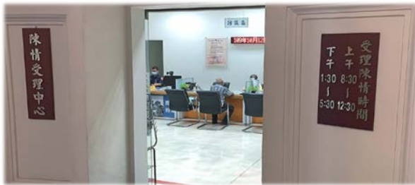
監察院設陳情受理中心收受人民陳情案件

監察院 109 年 10 月 13 日院會通過修正「監察院收受人民書狀及處理辦法」部分條文，係配合國家人權委員會運作，在該辦法第 9 條及第 10 條增訂人民書狀如係涉及酷刑、侵害人權或構成各種形式歧視之案件，監察業務處(含陳情受理中心)於收受後，得移送國家人權委員會處理。