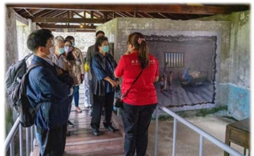
委員聽取導覽員解說設備克難的醫務室 109/10/06

委員會的職責，應做好促進人權教育推廣的工作。不義遺址的保存，提醒世人切莫重蹈覆轍，深具人權教育意涵。