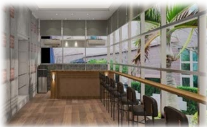
玻璃屋整修規劃示意圖