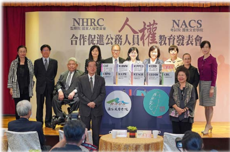
合作促進公務人員人權教育發表會。前排左起：考試院長黃榮村、監察院長兼人權會主委陳菊。後排左起：人權委員田秋堇、高涌誠、王榮璋、張菊芳；考試委員吳新興、楊雅惠；人權委員紀惠容、葉大華；考試委員伊萬·納威、保訓會主委郝培芝。109/10/27