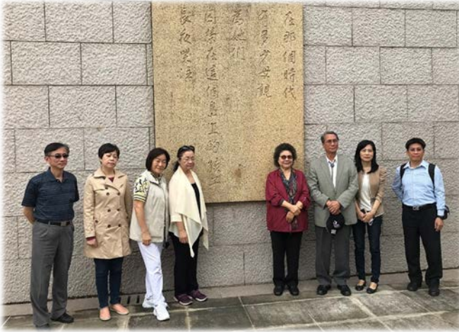
國家人權委員會委員於綠島垂淚碑文前合影 109/10/07

國家人權委員會主委陳菊、副主委高涌誠、以及蕭自佑、張菊芳、鴻義章、紀惠容、葉大華、田秋堇等共計 8 位人權委員，於 109 年 10 月 6 日至 7 日走訪綠島人權紀念園區，聽取導覽員說明「人權紀念碑」的設計理念。