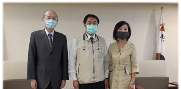
林國明(左)、葉宜津(右)委員拜會市長黃偉哲(中) 109/10/27

林國明、葉宜津委員於 109 年 10 月 26、27 日赴臺南市巡察，除受理人民陳情，拜會議長郭信良、市長黃偉哲外，並聽取市政簡報，瞭解施政情形。市府亦向委員說明文化觀光發展、科技園區招商、公共債務改善及推動開源節流之成效。此外，實地視察臺南轉運站、大臺南智慧交通中心、智慧停車數位服務中心，並試乘電動公車及自駕公車，關切市府辦理智慧交通規劃執行現況。