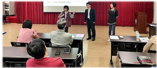
王幼玲委員(站立者左 1)分享調查經驗 109/10/12

監察委員王幼玲於 109 年 10 月 12 日受邀指導監察院監察調查處調查人員，進行「前駐多明尼加大使送醫救治案」及「外籍移工宿舍安全案」等經驗分享，王委員表示，「所有調查的開始，都是為了解決問題」，勉勵持續「發現真相，激濁揚清」，成為改變社會的重要力量。