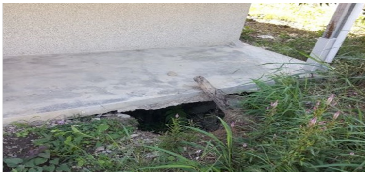
金富段永久屋地基疑似掏空

本案實地履勘發現： 1. 各地莫拉克永久屋存在屋內外漏水、排水設計不良、獲配空間狹小擁擠不敷使用問題，而結構生鏽腐壞、不堪使用、排水不通、滯洪池嚴重淤塞、隔音效果差等情形亦非少見。 2. 部分地區永久屋基地甚至出現地層下陷、地基掏空等安全疑慮，嚴重影響永久屋居民生活品質與居住安全。