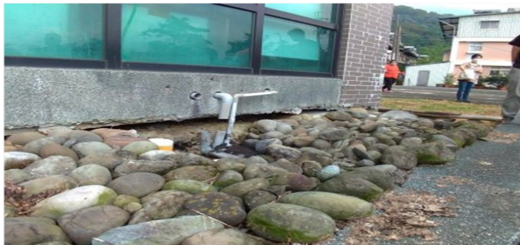
小林平埔族群文物館基地下陷