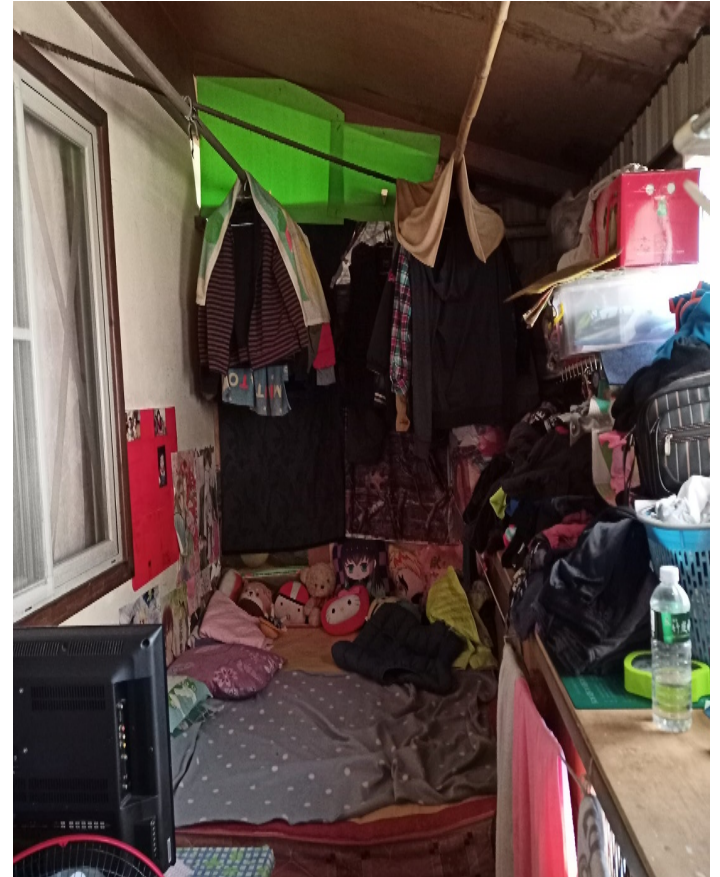
臺東縣大武永久屋居民陽台違建房間