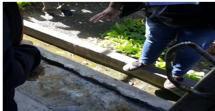
大武永久屋地層疑似下陷