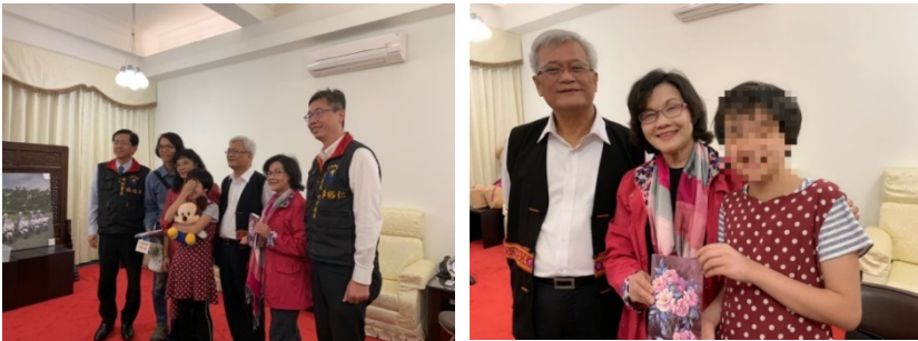
監察委員為調查少輔院學生受教權遭漠視案，於 104 年 3 月 23 日履勘，並於同年 5 月 3 日與案主合影

衛福部於 105 年訂定「直轄市、縣（市）主管機關兒少保護個案安置期間會面探視處理原則（範例）」，然該處理原則（範例）僅具參考性質，各地方政府對於兒童安置後之會面