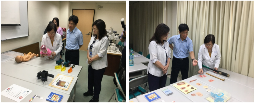
監察委員為調查法醫與司法鑑定案而履勘

法醫師法為改革過去由醫師轉任法醫師所生之困境，採取法醫師與醫師分流之新制。然法務部及衛福部屈就反對意見，致該法施行迄今已逾 12 年，法醫師之困境依然如故，又衍生諸多爭議。