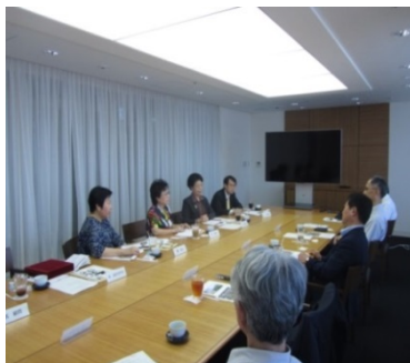
監察委員為瞭解我國育兒政策履勘

育準公共化服務與費用申報及支付作業要點」，旋即於 8 月 1 日實施「托育準公共化機制、擴大育兒津貼」政策。該政策雖立意良善，惟規劃期程過於倉促、欠缺與地方政府及民間團體