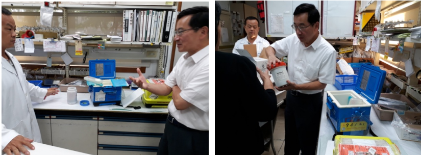
監察委員為調查幼兒感染腸病毒案而履勘

107 年春夏季腸病毒疫情於國內各地持續加溫，較過去兩年的發生率更高許多，亦發生新型病毒株及雙重病毒感染的個