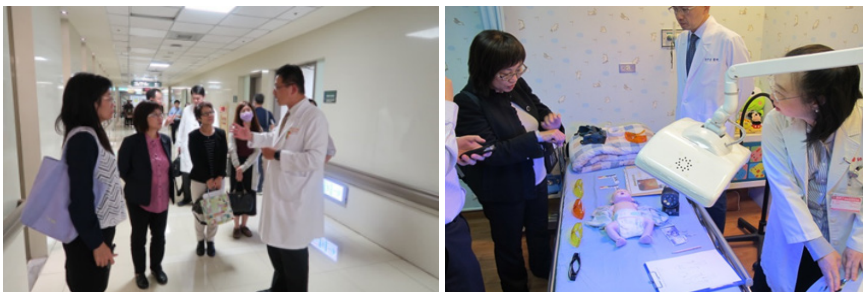
監察委員實地瞭解長庚兒少友善門診

近年重大兒虐事件頻傳，引發輿論關注，有鑑於國內已建置以社政機關為主之兒少保護網絡，然卻仍有重大兒虐案件發生，原保護網絡系統是否失靈或何以有漏接之憾事，如何落實司法改革國是會議決議，強化司法機關及早介入處理以及健全「社會安全網」之整合運作機制，監察院對此進行調查，於