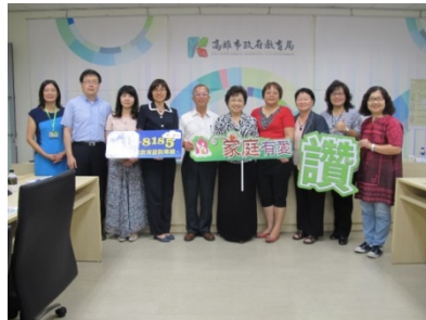
監察委員為瞭解我國推展家庭教育情形而履勘

另 102 年教育部實施「推展家庭教育中程計畫」，惟 22 個縣市家庭教育中心推展家庭教育之經費來自地方政府公務預算之占比，卻不增反降，從 101 年之 63.67%，逐年降低至 105 年之 58.29%及 106 年之 59.17%，部分縣市占比甚至未達 3 成，顯見地方政府未能寬籌家庭教育經費以落實推展家庭教育。