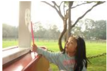
確保兒童身心健全發展乃兒童人權之核心

聯合國於西元 1989 年 11 月 20 日通過兒童權利公約（Convention on the Rights of the Child, CRC），於西元 1990 年生效，其內容包括兒童在公民、經濟、政治、文化和社會中的權利。該公約開宗名義指出，除非締約國的法律另有定明，否則年齡 18 歲以下的每一個人，均應受到公約之保障。我國係於民國（下同）103 年通過兒童權利公約施行法，並自同年 11 月 20 日世界兒童日施行。自此，政府機關任事用法，原則