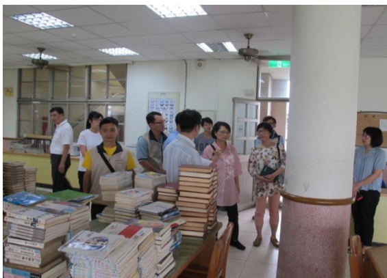
監察委員為調查宜蘭縣政府強行移撥國中校舍而進行履勘

國民中學校長係經由儲訓及多元民主之遴聘機制所產生，負有綜理全校行政業務之責，對校務推展極為重要。且學校如何評估餘裕空間供公益使用，需尊重教學需求及社區發展，經由多元參與之程序決定。惟宜蘭縣政府依