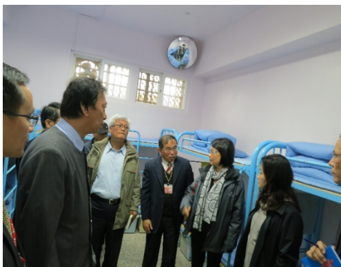
監察委員為調查少輔院學生受教權遭漠視案於 104 年 3 月 23 日履勘

依據矯正署 103 年 12 月資料，當時 2 所少輔院收容之 809 名學生中，男性學生就業意願均高於就學意願。而具就學意願之