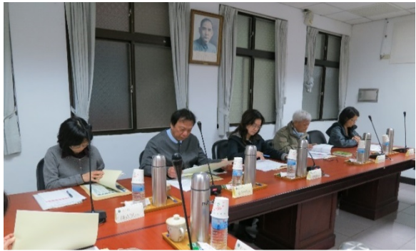
監察委員為桃園與彰化少輔院發生死亡及嚴重凌虐事件，於 104 年 3 月 23 日赴現場履勘

月 4 日買生因右肩疼痛被送入桃園少輔院隔離禁閉之三省園舍房休養，次日卻因胸腹腔臟器化膿引發敗血症死亡，遺體右前胸、腋下有肉眼可見之大面積瘀青紅腫，還有破皮、水泡，