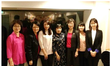
監察委員拜會菲律賓裔前國會議員 Jasmine Lee，交換新住民議題意見

101 年至 105 年新住民發展基金近 6 成補助於「新住民家庭成長及子女托育、多元文化宣導計畫」，而攸關新住民經濟扶助的社會安全網經費不及 1 成；又補助