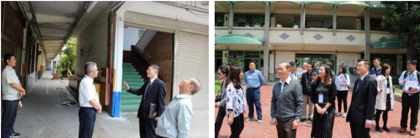
監察委員為調查危險校舍案而履勘

2 萬餘學童於待拆除校舍上課，合計有 14 萬餘學童於安全堪慮之校舍環境中上課。國教署雖稱已擬定校舍未完成補強或拆除前之因應作為，惟學童就學安全刻不容緩，教育部身為中央主管教育機關，負有校園安全政策之規劃、輔導與行政監督之職責，實應強化督導各地方政府儘速完成國中小校舍耐震能力評估及改善，並於校舍未完成補強、拆除或改建前，加強維護學童與教師之上課安全。