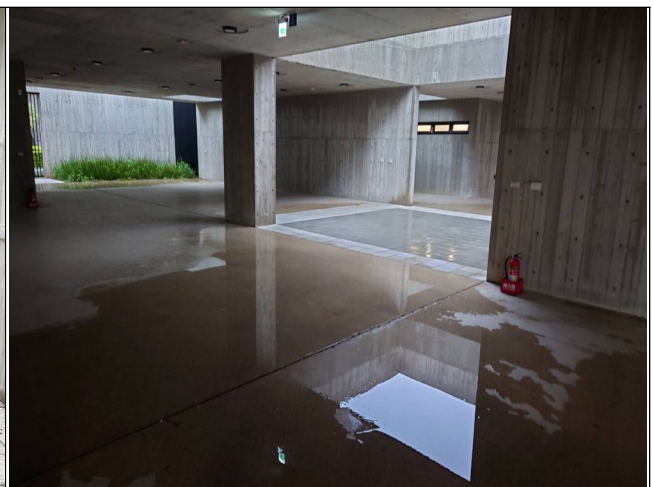
圖4 2樓祭祀空間積水情形