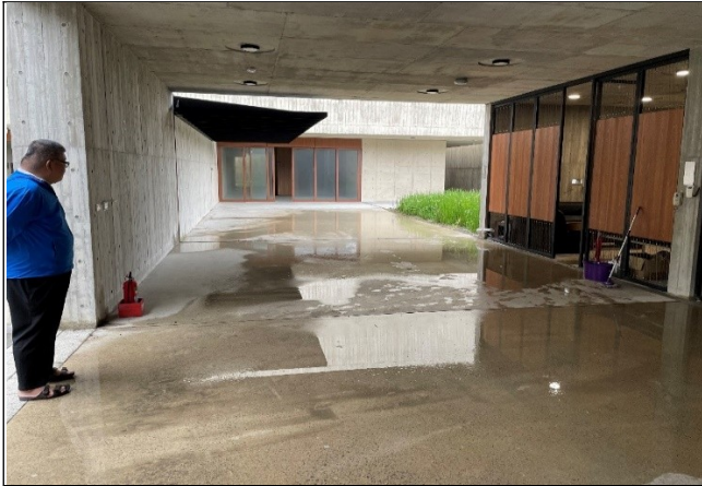
圖1 2樓祭祀空間積水情形