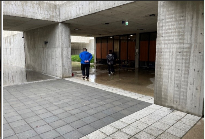
圖2 2樓祭祀空間積水情形