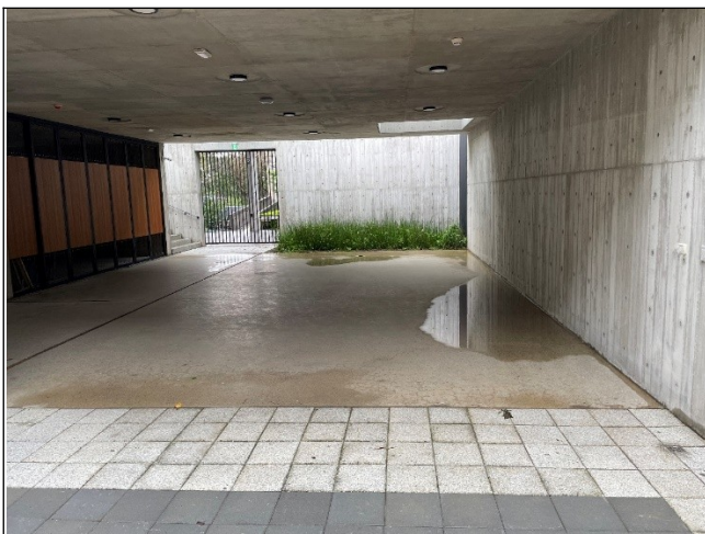
圖3 2樓祭祀空間積水情形