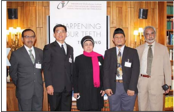
圖 25. 課間與各國學員交換意見並合影