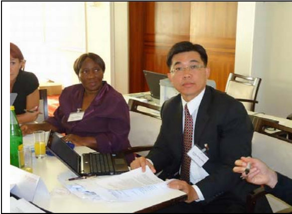
圖 17. 情境模擬調查計畫之分組討論