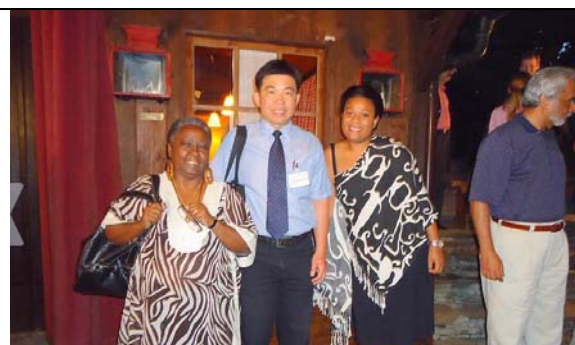
圖 6. I.O.I 歡迎晚宴