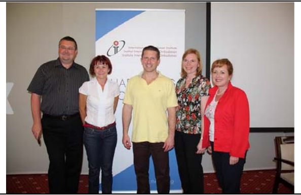
圖 26. 講座與學員合影