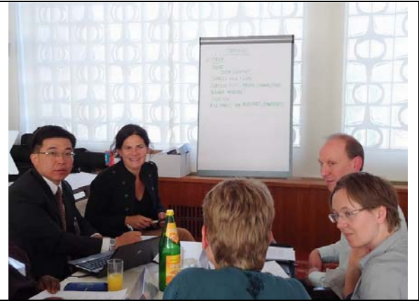
圖 18. 情境模擬調查計畫之分組討論