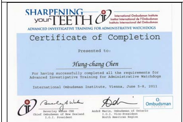
圖 29. 報告人之結業證書