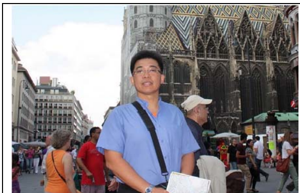
圖 1. 6月4日報告人初到維也納