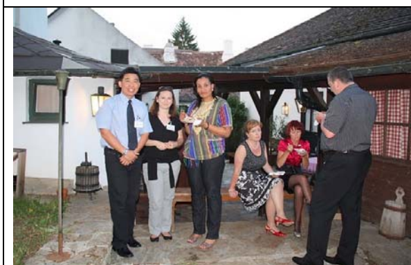
圖 7. I.O.I 歡迎晚宴