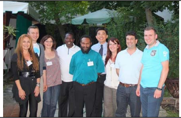
圖 10. I.O.I 歡迎晚宴