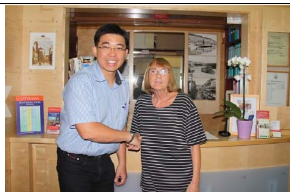
圖 2. 入住維也納 pension city hotel