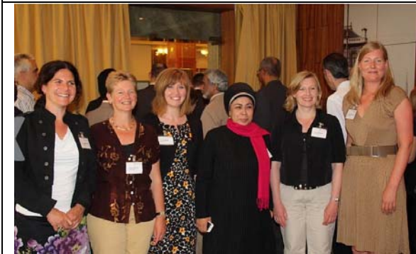
圖 21. 銳化牙齒訓練課餘時間