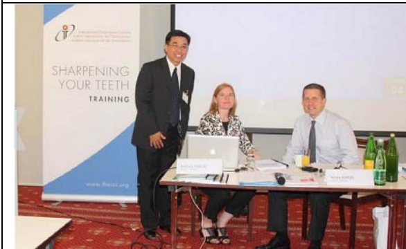
圖 13. 報告人與 2 位講座合影