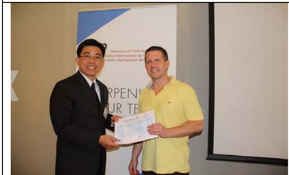
圖 27. 講座頒發結業證書