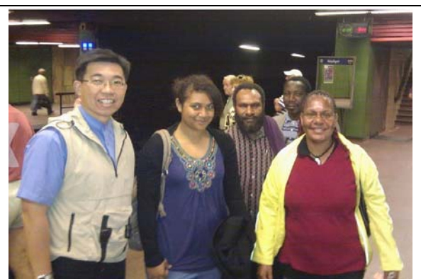
圖 32. 匈牙利布達佩斯地鐵一景