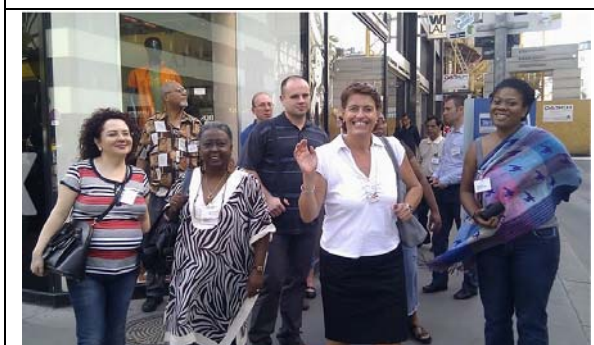
圖 5. 6月5日維也納城市導覽