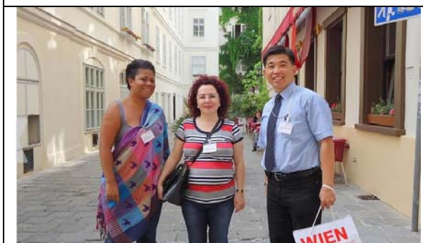
圖 3. 6月5日維也納城市導覽