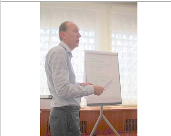
圖 23. 分組討論之成果報告