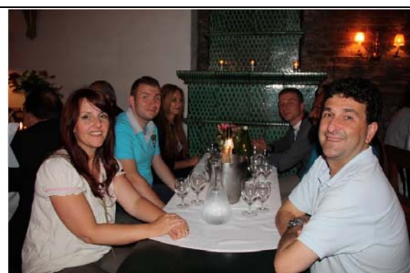
圖 8. I.O.I 歡迎晚宴