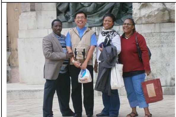
圖 31. 課餘與各國學員同遊匈牙利國家美術館，增進彼此友誼