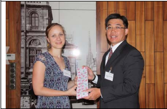
圖 19. 感謝國際監察組織所有同仁