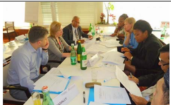
圖 14. 情境模擬調查計畫之分組討論