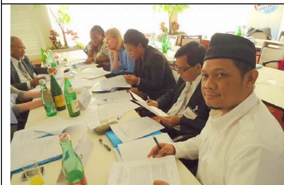
圖 15. 情境模擬調查計畫之分組討論