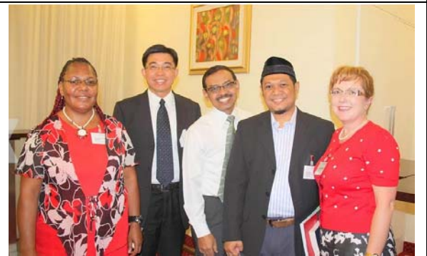
圖 22. 銳化牙齒訓練午茶時間