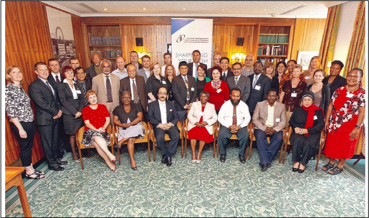
圖 33. 講師與全體受訓同學合影