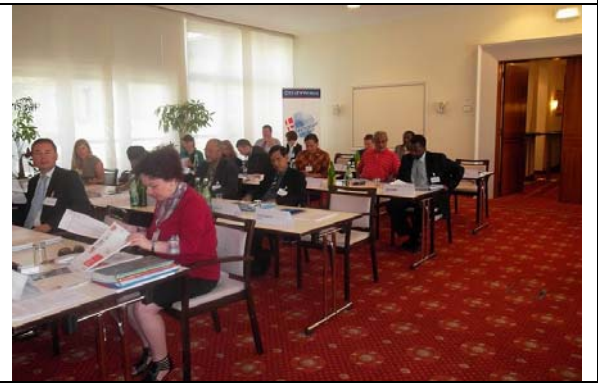
圖 20. 銳化牙齒訓練上課情景