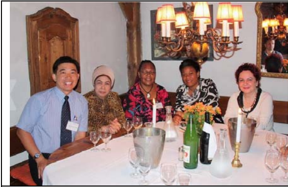
圖 9. I.O.I 歡迎晚宴