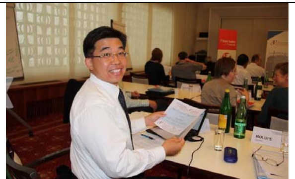
圖 28. 報告人參訓情形