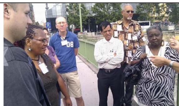
圖 4. 6月5日維也納城市導覽