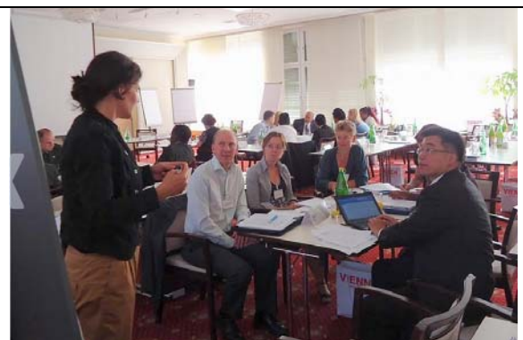
圖 16. 情境模擬調查計畫之分組討論