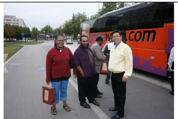
圖 30. 課後與各國學員交流互動