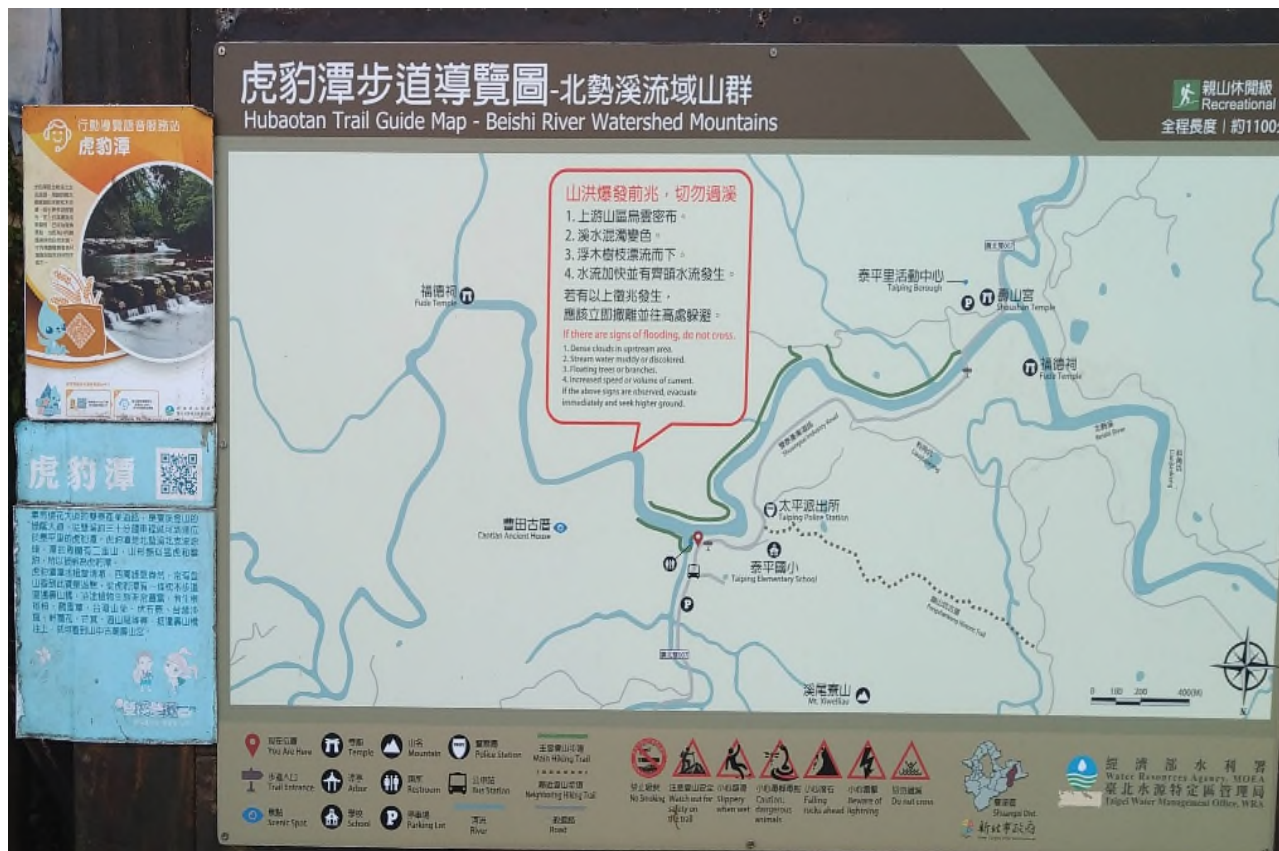
事發後虎豹潭步道路線圖已加註「山洪爆發前兆，切勿過溪」等警語。