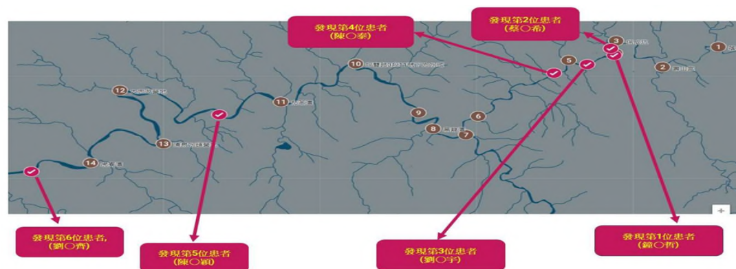
罹難者尋獲分布圖