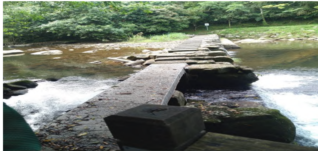
事發後石墩上木板已滅失，新北市雙溪區公所改鋪設水泥混凝土板塊。