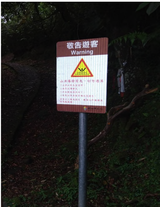
事發後新北市雙溪區公所增設「山洪爆發前兆，切勿過溪」告示牌。