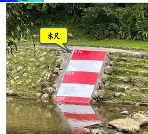
水特局111年5月完成設置虎豹潭水位站及水尺。