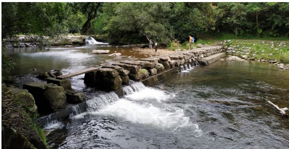
事發前虎豹潭跨溪石墩(石跳仔)因左側石墩間距過大，人無法跳石通行，而放置木板供人行走。

事故地點梳子壩因原設施年代久遠，據當地耆老稱原係當地居民過溪腳踏石墩，該處目前既有設施「石墩(石跳仔)」(即報載梳子壩)，為50、60年前公所所修建。就虎豹潭梳子壩提供居民、遊客通行一節，據水利署表示，係屬地方需求。另查地方制度法第18條第10款規定，直轄市道路之規劃、建設及管理均屬新北市政府自治事項。