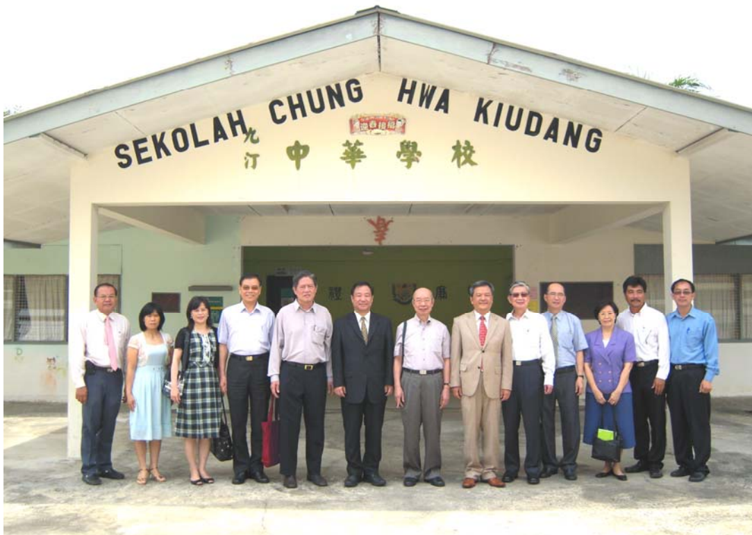
考察團與丁代表干城及九汀中華學校董教人員合影