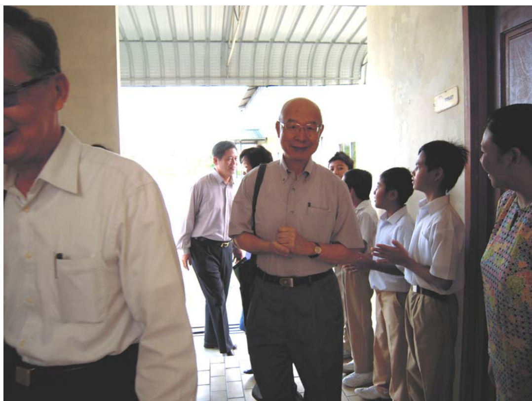
九汀中華學校師生熱烈歡迎考察團

有關僑委會對九汀中華學校之協助部分，包括贊助美金 4,000 元，安排 3 位台灣資深教師，於 2010 年 9 月間前來該校指導華文教師，實地示範寫作教學，以發揚中華文化；另亦安排 2 位教師到該校教授民族舞蹈及民俗藝術課程，例如捏麵人、筷子舞等。另於 2008 年補助該校購置 10 台電腦設備及提供華語文教材 734 冊。