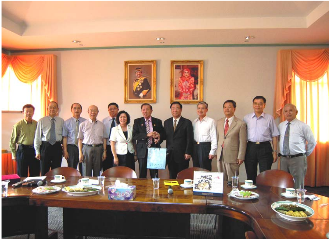
考察團與汶萊中華中學董教人員及丁代表干城於會議室合影