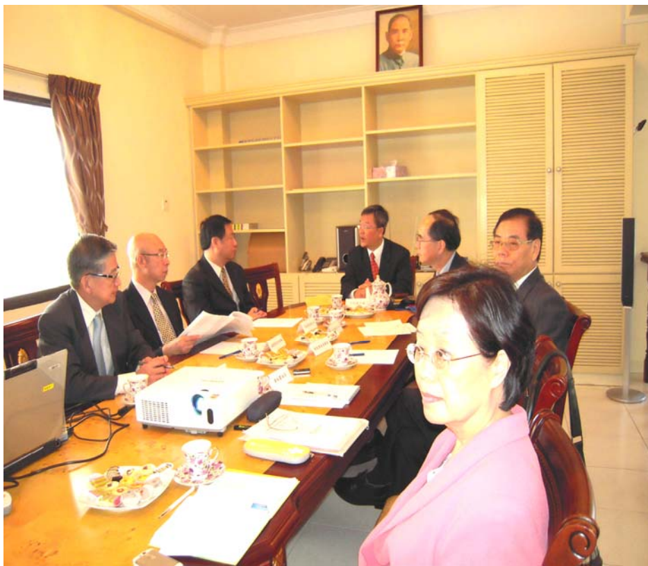
丁代表干城業務簡報並與考察團交換意見