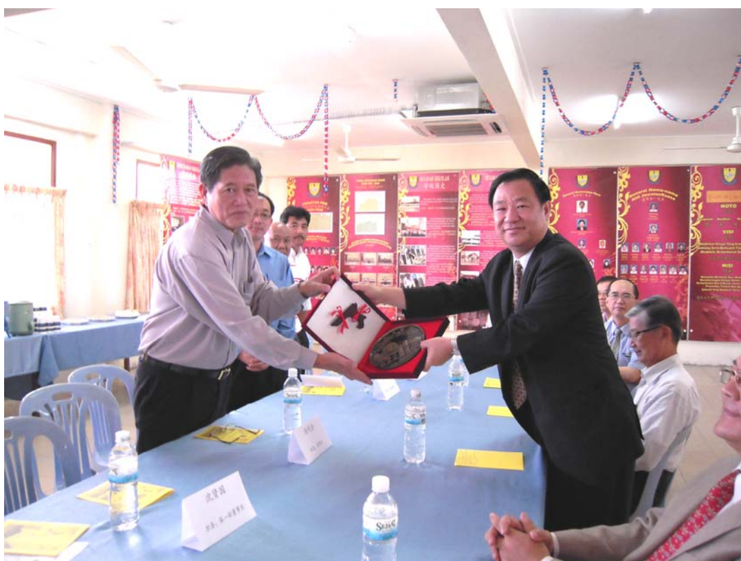
葛委員永光代表致贈本院院景銅盤