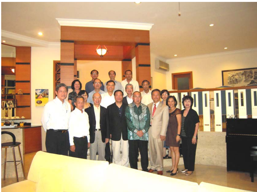
考察團與汶萊僑領、僑務榮譽職人員、僑校董事及丁代表干城夫婦合影