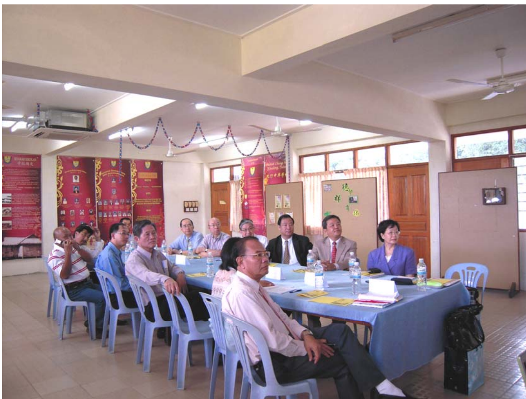
觀賞九汀中華學校簡介