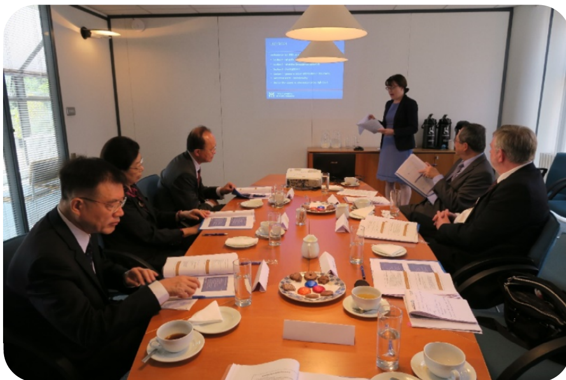
本院代表團拜會愛爾蘭監察使公署進行監察職權交流