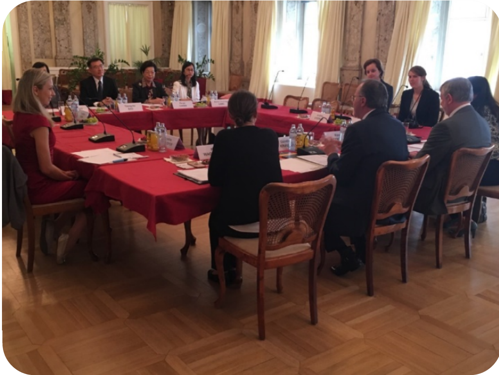
本院代表團拜會國際監察組織總部進行監察職權交流

在此 IOI 成立 40 週年之際，謹申本院衷心祝賀之意。而為慶祝 IOI 成立 40 週年，IOI 在本年 4 月 30 日以圓桌會（Round Table）形式，於聯合國總部舉行周邊會議（Side Event），包含 IOI 理事長 Peter Tyndall 等重要成員，均親赴聯合國（UN）總部出席聯合國周邊會議（Side Event）。