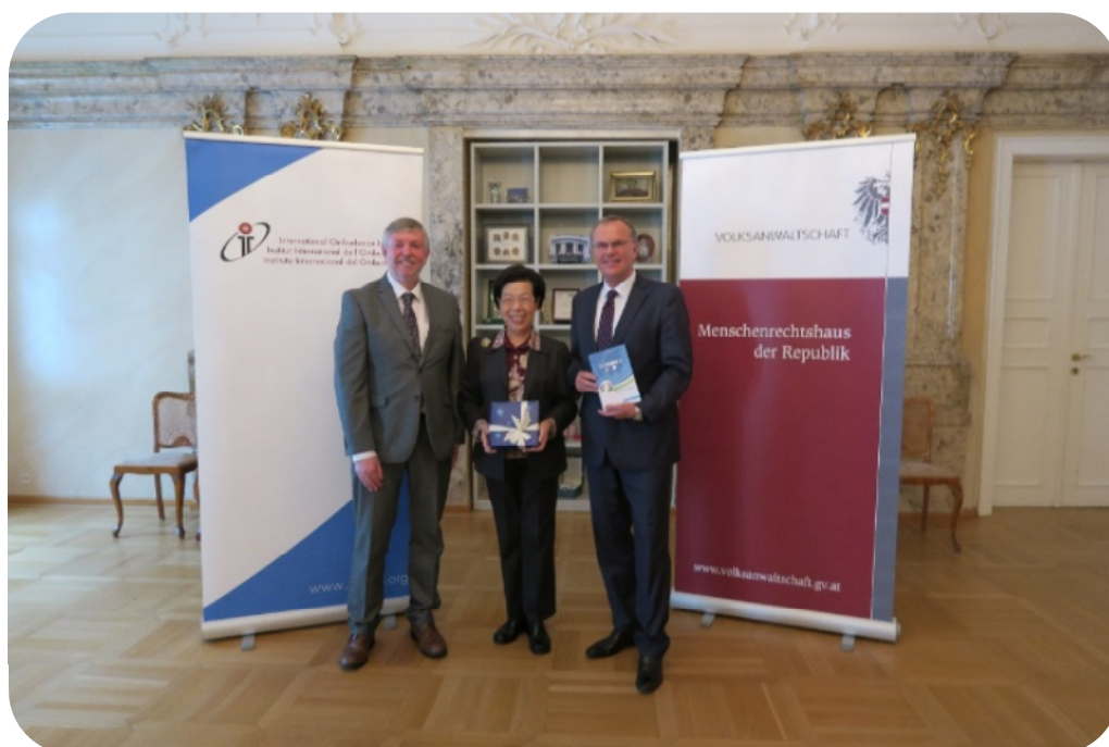
張院長博雅拜會 IOI 總部並與 Peter Tyndall 理事長（左）與 Günther Kräuter 秘書長合影

本院於去（2017）年出版「國際監察制度綜覽」，收錄近 200 個國際性、區域性監察組織及國家層級監察機構之簡介，並翻譯 IOI 於 2016 年 11 月在泰國舉辦之第 11 屆世界會議中，所發表之「2016-2020 策略計畫」及「波蘭調查報告」等資料。本院編譯專書以善盡會員義務，落實 IOI「2016-2020 策略計畫」有關傳播及出版監察研究出版品之目標，積極跨越語言藩籬，提供全球近 12 億華語人口有關國際監察領域之最新發展概況。