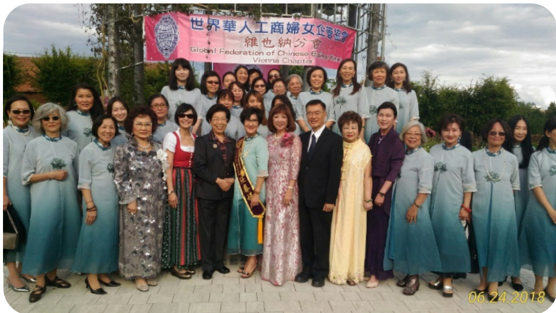
本院代表團出席世界華人工商婦女企管協會維也納分會成立大會

而愛爾蘭當地僑務概況，由於都柏林大學（University College of Dublin）及科克大學（University College Cork）已於2006年及2007年設立孔子學院，推廣中國文化，並吸引大量愛爾蘭青年前往大陸觀光、訪問及就學。為加強臺愛雙邊文化交流，駐愛爾蘭代表處近年推動大型文化活動期間，都柏林中文學校（Dublin School of Mandarin Chinese）亦配合政府與愛臺協會，辦理如「海外漢字文化節」及「臺灣美食廚藝展示」等僑社活動，積極推廣我國教育與文化，致力於海外華語教學及臺灣文化推廣。因此，愛爾蘭代表處藉由此行本院拜會愛爾蘭監察使公署之際，安排與愛爾蘭僑務促進委員暨都柏林中文學校校長等僑胞會晤，以瞭解當地僑胞現況及僑務工作。