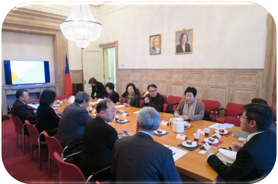
院長暨委員巡察駐荷蘭代表處，聽取簡報

(三) 我國與荷蘭雙邊協(議)部分，既有之協定(議)包括：「農業合作協定(1993)」、「空運服務協定(2000)」、「臺荷避免雙重課稅協定(2001)」、「洗錢、恐資及相關犯罪情資交換備忘錄(2009)」及「創新研發備忘錄(2011)」。2019 年已簽署包括「臺荷科技合作協定備忘錄」，以及「臺荷關稅互助協定」，該協定為異地簽署，屬歐盟會員國之首。