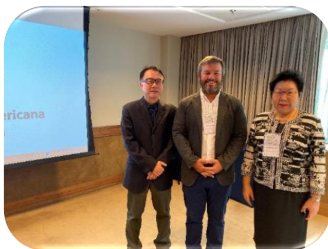
與阿根廷地方護民官 Ismael Rins 合影