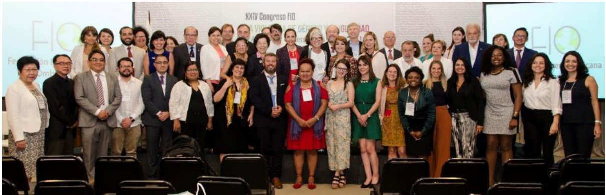
第 24 屆伊比利美洲監察使聯盟年會與會人員合影