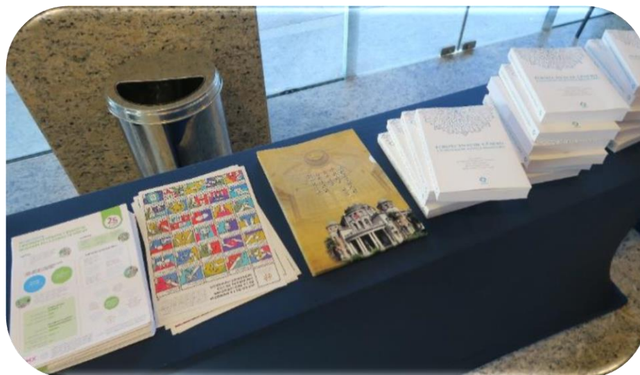
本院調查案例資料擺放於會場入口供與會嘉賓索取