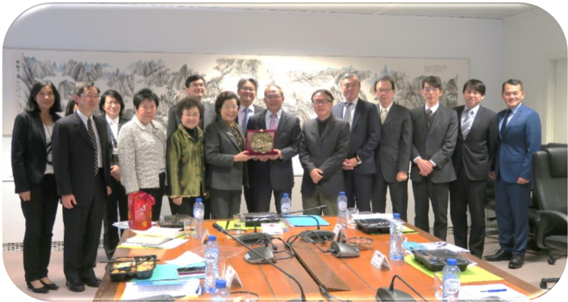
院長暨委員與駐歐盟兼駐比利時代表處同仁合影

有外交部、經濟部、教育部、科技部、國防部、衛福部、勞動部及移民署等單位共 35 人派駐該國，含當地雇員 17 人，總計 52 人。