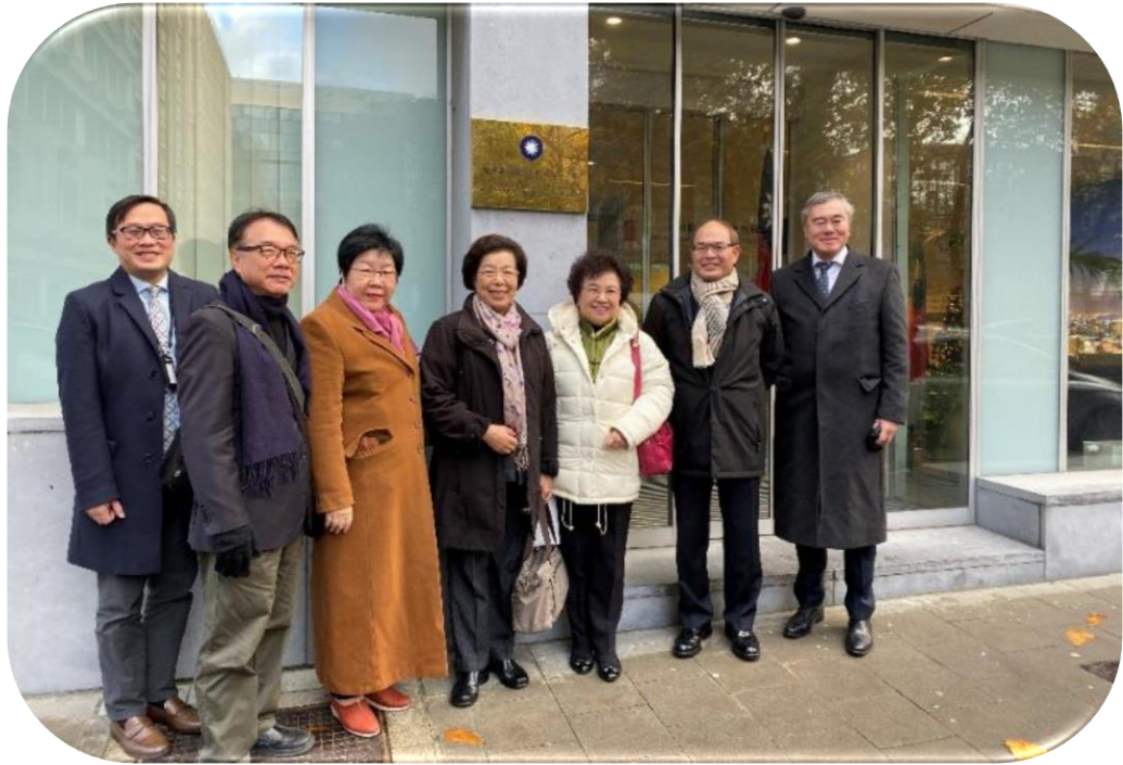
院長暨委員巡察駐歐盟兼駐比利時代表處，與曾厚仁大使等人合影