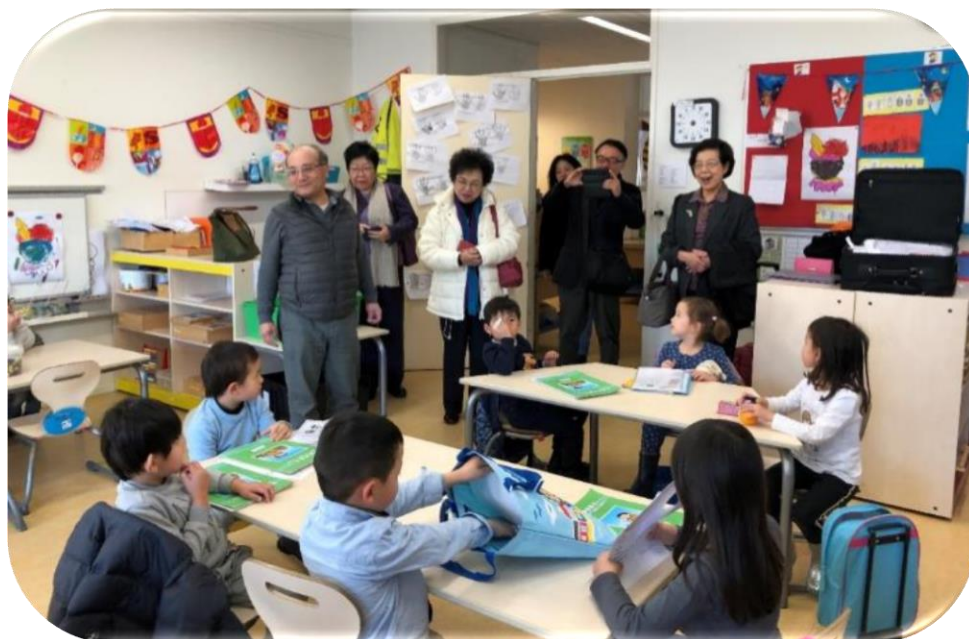
本院代表團參觀各班學童上課情形

該校為週末學校，尚未擁有自身校舍，目前向海牙當地小學租用教室。早期學生以臺商子女為主，近幾年學生家庭背景結構逐漸改變。主要以臺灣人子女為主，亦開設成人華語班，大多為兒童班學生之家長。僑委會另於 2009 年補助該校成立「華語數位學習中心」。