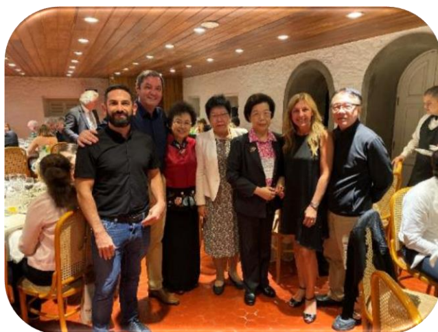
與阿根廷地方護民官署代表等人合影