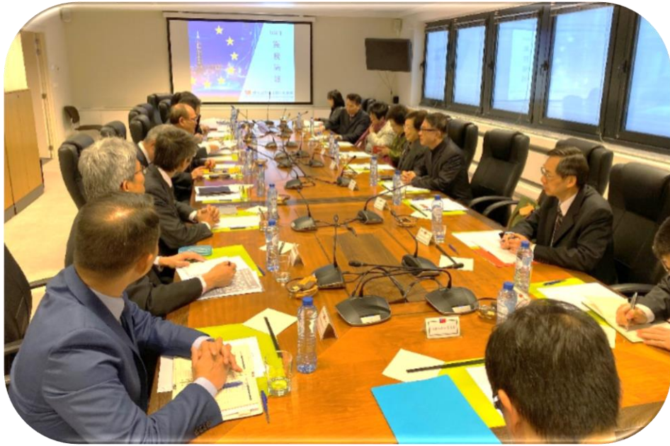
院長暨委員巡察駐歐盟兼駐比利時代表處，聽取簡報