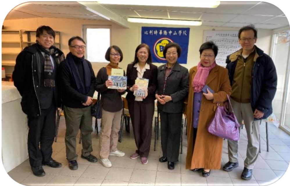
本院代表團參訪比利時華僑中山學校