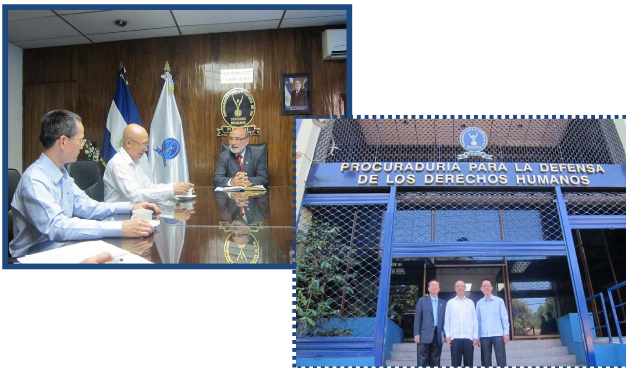
代表團與薩爾瓦多人權保護檢察官署署長進行座談，並於大門留影紀念

動瞭解任何可能危及或違反人權之案件，視需要巡視或查察公部門尊重人權之情形，推廣或建議必要方案以免人權遭受迫害，並撰寫公布相關報告。