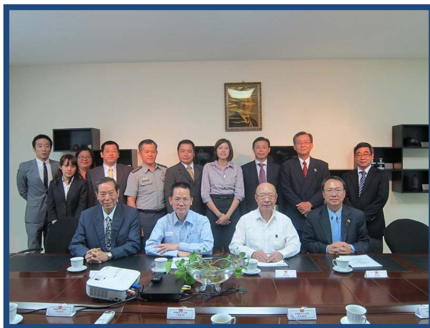
代表團與我駐薩爾瓦多大使館全體館員合照