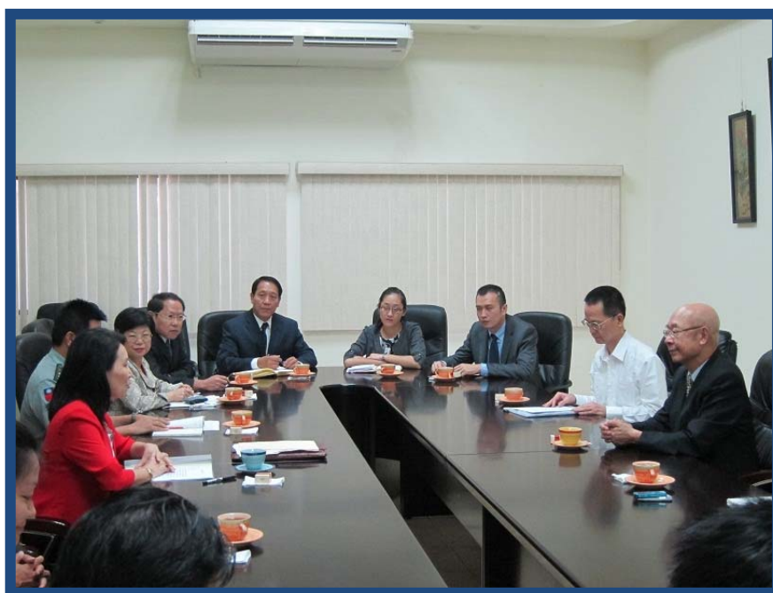
本院代表團巡察我駐尼加拉瓜大使館聽取簡報