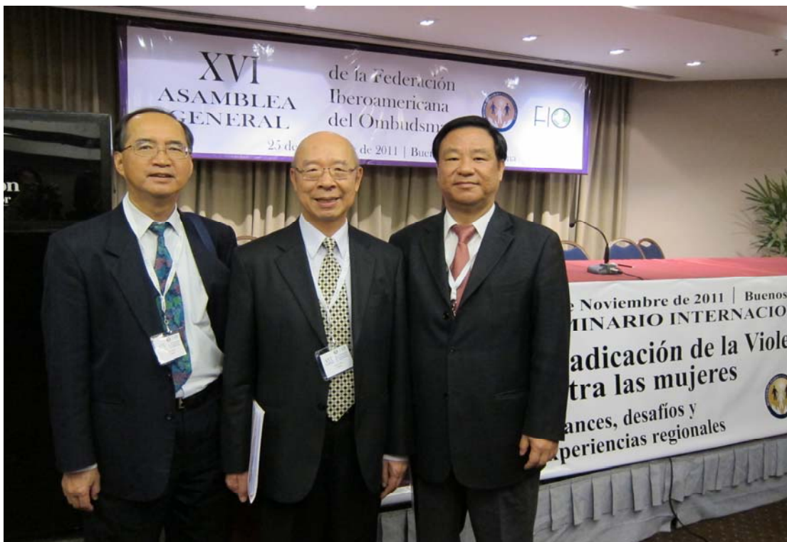
本代表團於年會中合影留念

Valorzi 女士於會中放映 DVD 簡介，介紹自 2008 年運作之最高法院防治家庭暴力辦公室，目的在幫助受到家暴的人們，採取法律途徑保護自己。辦公室並設置多國語言翻譯人員，以提供外國人申訴服務。