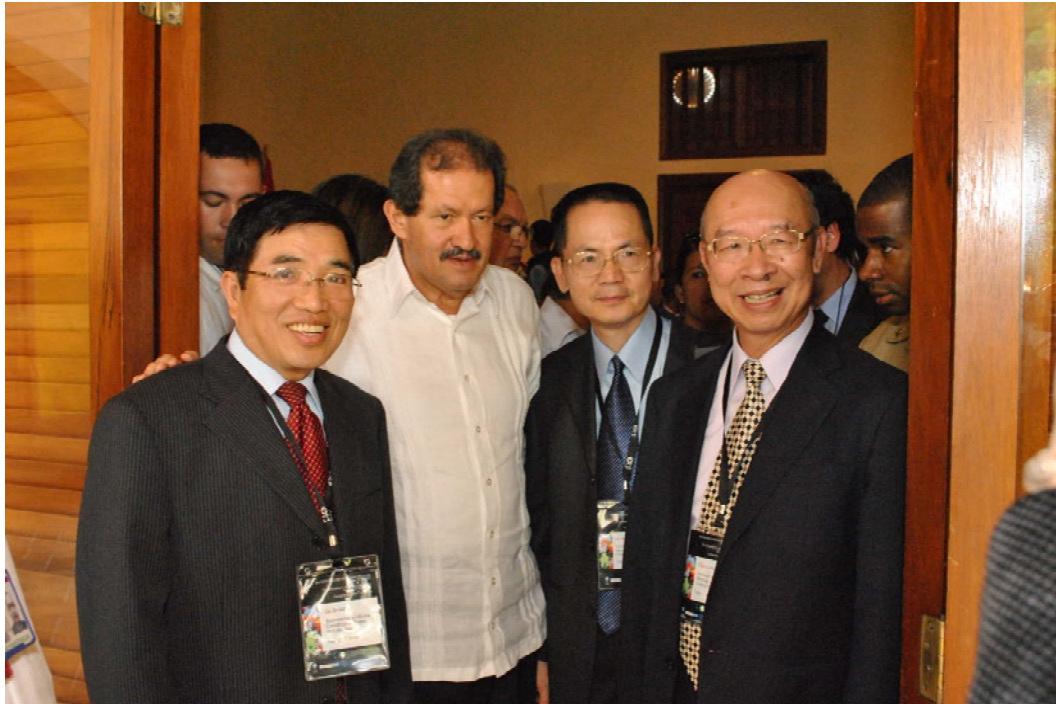
本院代表團趙委員榮耀(右1)、李委員炳南(右2)、駐哥倫比亞代表處劉代表儒宗與哥倫比亞副總統加爾松諾博士(左2)於會中合影留念。