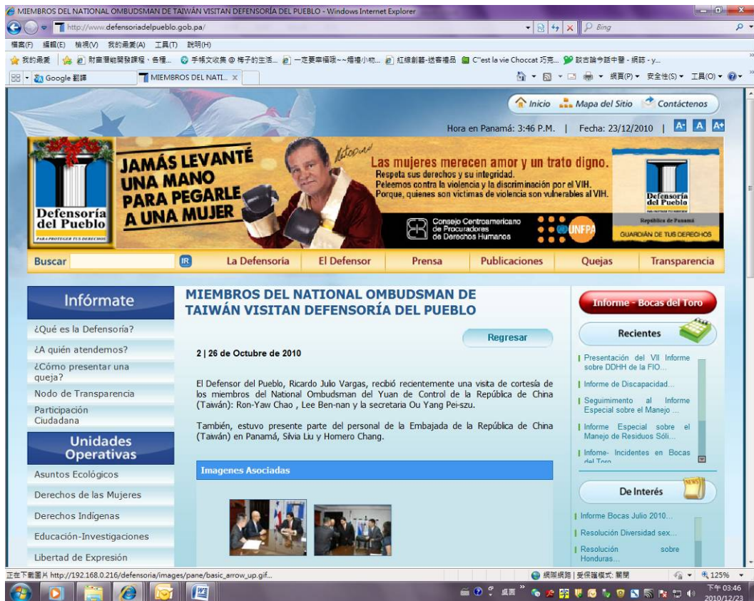
巴拿馬護民官署網站刊登本院代表團拜會訊息及照片。