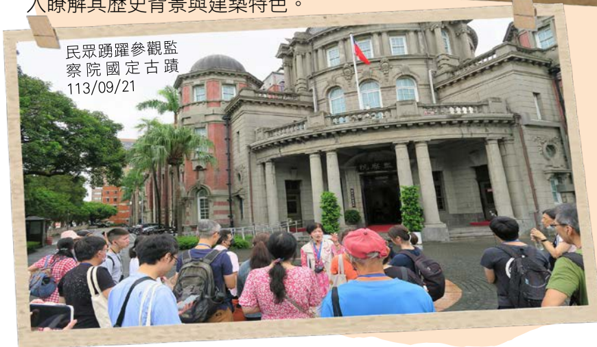
民眾踴躍參觀監察院國定古蹟 113/09/21

監察院這座超過百年國定古蹟，為西洋歷史式樣建築，採用二層鋼筋混凝土磚造，外觀以紅磚與灰白仿石為基調，比例優美，色調典雅，是臺灣相當具代表性的經典建築。當天，民眾除一覽監察院建築之美，還能走進監察院議事廳，體驗監察委員開會議事的氛圍，來趟充實又知性的古蹟巡禮。