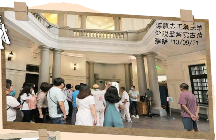
導覽志工為民眾解說監察院古蹟建築 113/09/21

為響應 2024 年全國古蹟日活動，監察院於 9 月 21 日（星期六）特別開放院區供民眾參觀。當天陰雨綿綿，但許多民眾不減熱情，甚至在大雨滂沱之下，仍踴躍參觀監察院國定古蹟，並在導覽人員專業解說下，深入瞭解其歷史背景與建築特色。