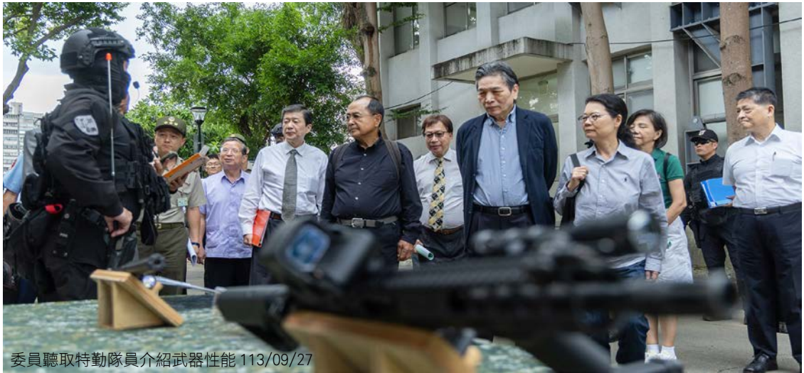
委員聽取特勤隊員介紹武器性能 113/09/27

由國防部副部長柏鴻輝等人陪同至憲兵特勤隊訓練中心，瞭解憲兵夜鷹特勤隊訓練現況、量能，以及平戰時轉換情形。