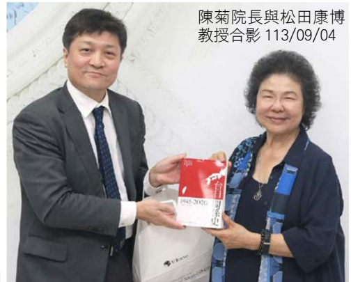
陳菊院長與松田康博教授合影 113/09/04

陳菊院長指出，松田教授是日本數一數二研究台灣及兩岸議題學者，長期關注台灣民主發展，小組成員也是前開領域的權威專家，都對台灣十分友善；李鴻鈞副院長與日本政界友好，曾接待過松田教授訪團，與松田教授極為熟識。