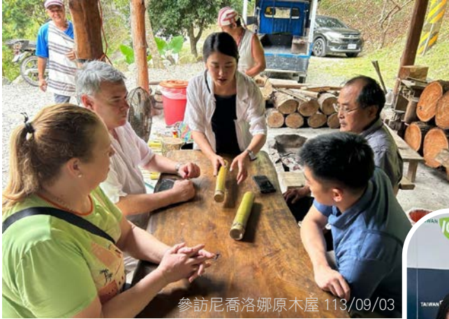
參訪尼喬洛娜原木屋 113/09/03

演說中，Ávila 主席提及巴拉圭護民官署特別重視原住民族權利、健康權、兒少權益以及防治婦女暴力事件，並分享該國案例。護民官署積極地與聯合國、FIO 等國際性和區域性組織合作，促進拉丁美洲地區的人權政策，也和各種非政府組織、非營利人權組織密切合作，提供技術與專業培訓。