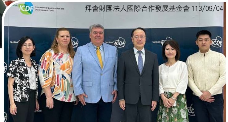
拜會財團法人國際合作發展基金會 113/09/04

演說中，Ávila 主席提及巴拉圭護民官署特別重視原住民族權利、健康權、兒少權益以及防治婦女暴力事件，並分享該國案例。護民官署積極地與聯合國、FIO 等國際性和區域性組織合作，促進拉丁美洲地區的人權政策，也和各種非政府組織、非營利人權組織密切合作，提供技術與專業培訓。