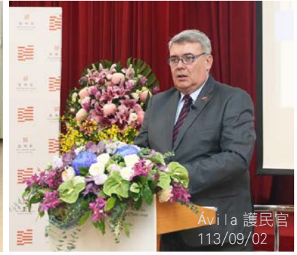
Ávila 護民官 113/09/02