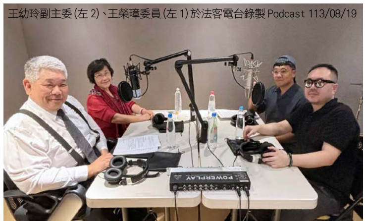
王幼玲副主委(左 2)、王榮璋委員(左 1)於法客電台錄製 Podcast 113/08/19

在 9 月 25 日播出的《法客話題》Podcast 節目中，國家人權委員會副主委王幼玲、委員王榮璋以及台灣視覺希望協會 (HOVA) 創辦人甘仲維博士共同探討身心障礙者在台灣社會中面臨的權益保障與挑戰。節目深入討論障礙者在教育、就業和日常生活中的經歷，並強調合理調整的重要性。