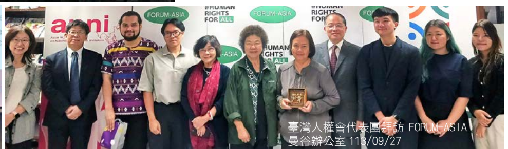
臺灣人權會代表團拜訪 FORUM-ASIA 曼谷辦公室 113/09/27