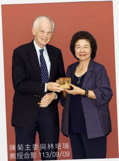
陳菊主委與林培瑞教授合影 113/09/09

教授此行是其在臺系列講座的首站，由人權會與政治大學合作，將在9月陸續於政治大學、中央研究院、左轉有書以及宜蘭慈林社會發展學院舉辦多場與青年對話中國社會與人權發展的演講。