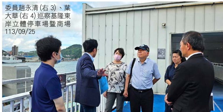
委員趙永清(右3)、葉大華(右4)巡察基隆東岸立體停車場暨商場 113/09/25

監察委員趙永清、葉大華於 113 年 9 月 25 日赴基隆市進行地方機關巡察。