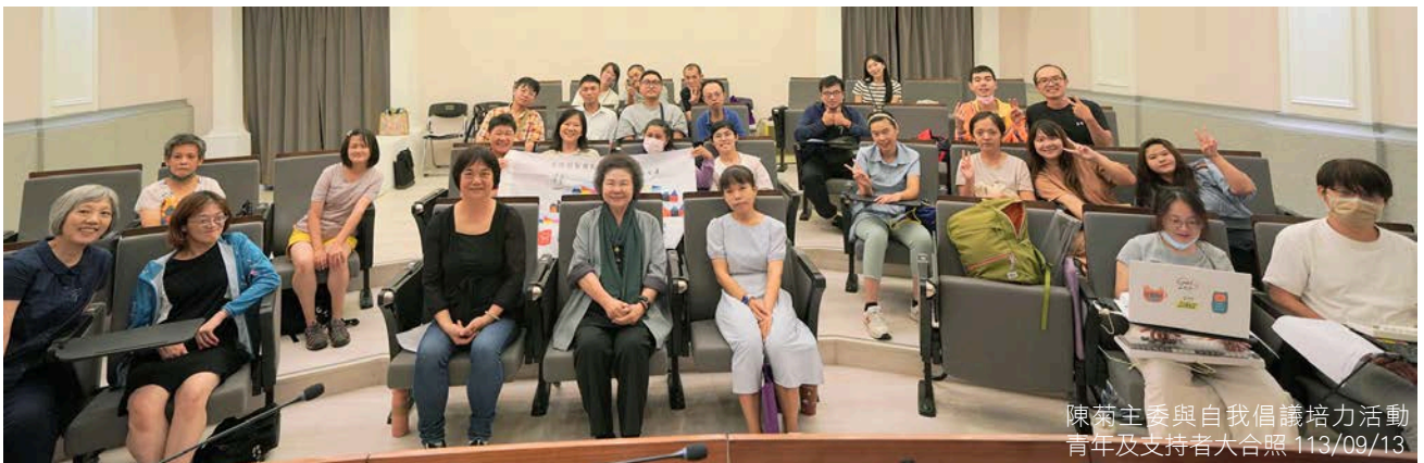
陳菊主委與自我倡議培力活動青年及支持者大合照 113/09/13