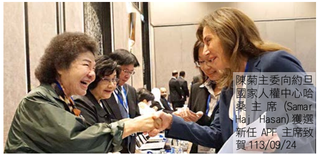
陳菊主委向約旦國家人權中心哈桑主席 (Samar Haj Hasan) 獲選新任 APF 主席致賀 113/09/24

→陳菊主委向斐濟人權與反歧視委員會 (FHRADC) 代表樂瓦拉夫執行長 (Loukinikini Lewaravu) 取得 2025 年 APF 會議主辦權致賀 113/09/24