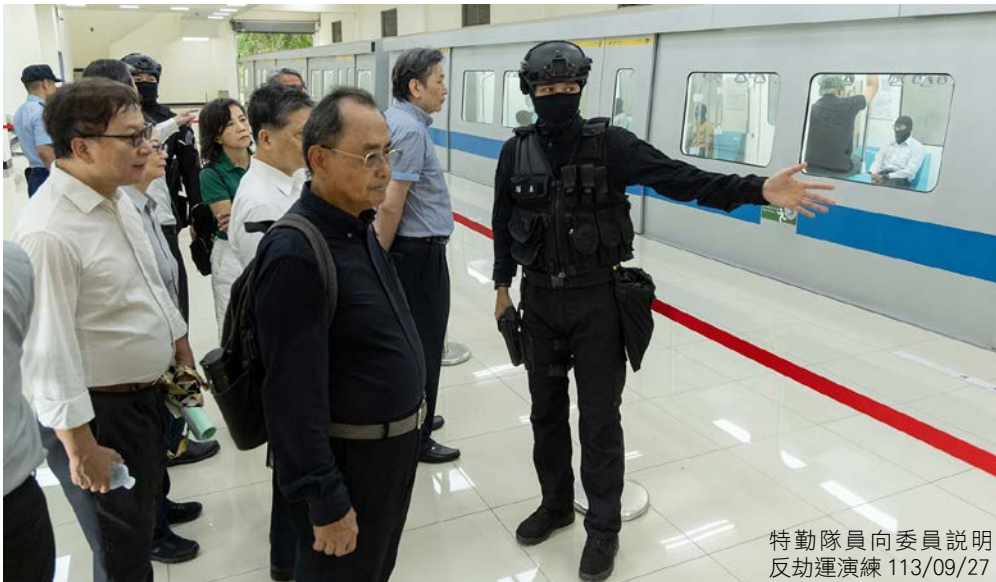
特勤隊員向委員說明反劫運演練 113/09/27

監委先聽取特勤隊任務簡報、組織沿革、整體訓練規劃及特勤官兵所負任務；對於憲兵特勤隊精實訓練及官兵所展現之高昂士氣與戰鬥意志，留下深刻印象並給予高度肯定。本次巡察除聽取業務簡報外，並舉行綜合座談及進行意見交流。