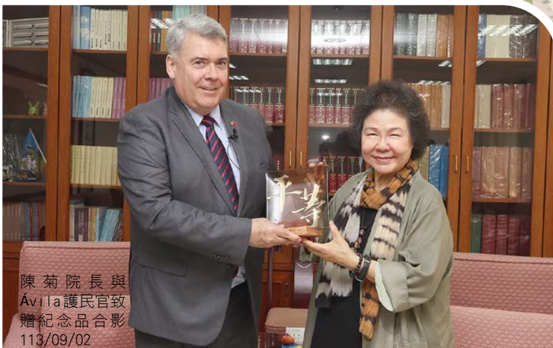
陳菊院長與 Ávila 護民官致 贈紀念品合影 113/09/02

臺灣的監察院、巴拉圭的護民官署,雙方均以促進政府善治、保障人權,來捍衛得來不易的民主,陳院長表示,將與巴拉圭在內的 FIO 各成員國加強合作,共同推動監察和護民制度的創新和發展,以因應科技時代裡跨國界的重大挑戰。