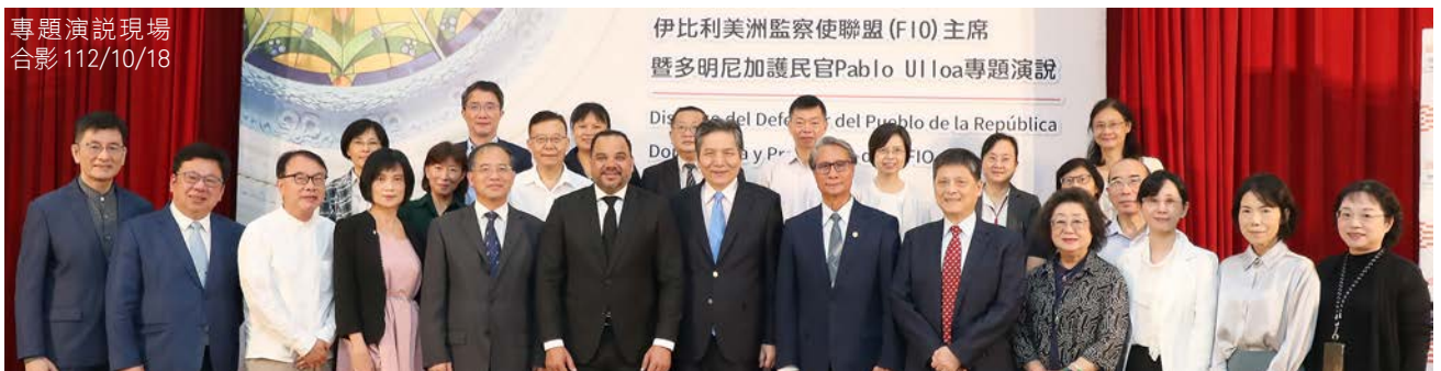
專題演說現場合影 112/10/18