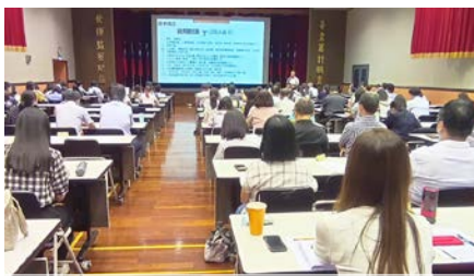
於審計部舉行宣導暨交流會議 112/09/01

監察院為增進審計人員對公職人員利益衝突迴避法之認知，俾利於稽察時如發現機關之補助、交易公告機制未健全，可適度提醒機關改善，爰於 9 月 1 日至 10 月 13 日期間，針對全國審計同仁，舉辦 5 場宣導暨交流會議。