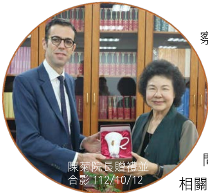
陳菊院長贈禮並合影 112/10/12

法國在台協會主任 Franck Paris 率團於 112 年 10 月 12 日拜會監察院院長暨國家人權委員會主任委員陳菊，為未來深化台法人權組織交流等議題進行晤談，雙方相談甚歡，並期待未來有更深入的交流互動。