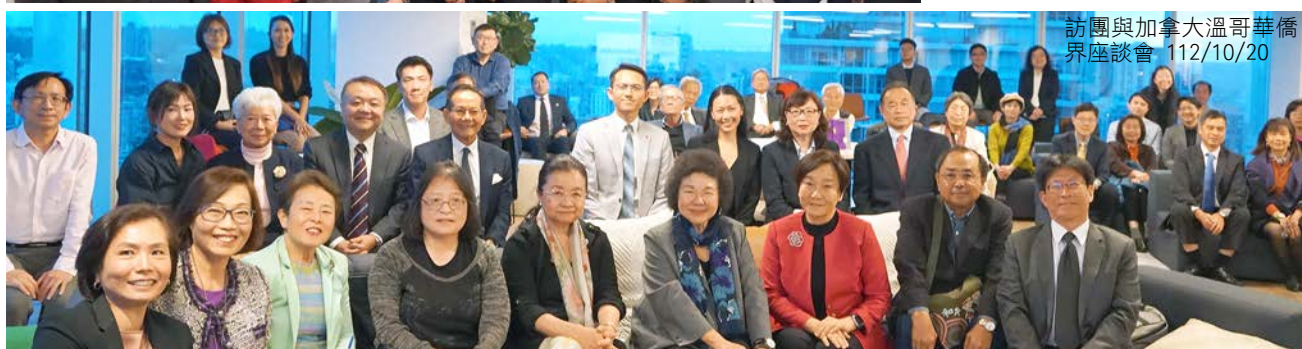
訪團與加拿大溫哥華僑界座談會 112/10/20

陳菊主委一行到溫哥華，再拜會地方層級的卑詩省人權專員辦公室 Govender 委員與人權審裁處 Ohler 主席座談，進行意見交流。