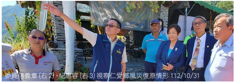
委員鴻義章(右2)、紀惠容(右3)視察仁愛鄉風災復原情形 112/10/31

監察委員鴻義章、紀惠容於 112 年 10 月 30 日及 31 日赴南投縣巡察。30 日上午拜會議長何勝豐及縣長許淑華，並就縣政發展進行交流，隨後聽取縣政簡報，同時與各單位針對各個議題交換意見；下午視察信義鄉推動原民特色農業升級與灌溉系統改善情形。31 日上午前往仁愛鄉親愛部落、法治國小，瞭解卡努颱風災後復原進度。下午至埔里福興農場，瞭解該農場開發營運情形，及廬山溫泉業者安置狀況。