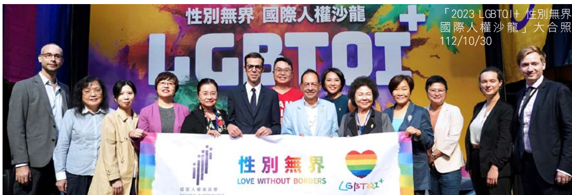
「2023 LGBTQI+ 性別無界 國際人權沙龍」大合照 112/10/30

陳菊主委致詞表示，台灣已經成為亞洲首個法律保障婚姻平權的國家，但法律無法立即消除潛藏社會的偏見與歧視，仍需要大家繼續努力。米歇爾副市長就「LGBTQI+ 人權倡議及政策推動」的主題分