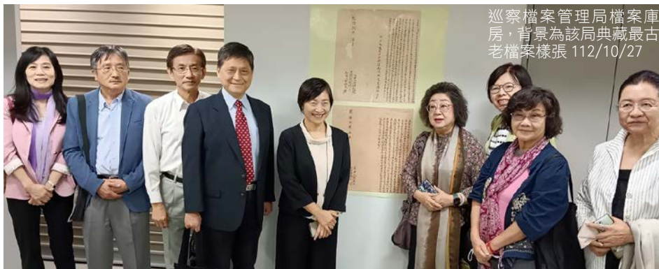
巡察檔案管理局檔案庫房，背景為該局典藏最古老檔案樣張 112/10/27

監察院財政及經濟委員會為瞭解國家發展委員會國家重大計畫管制考核情形，及檔案管理局國家檔案徵集、開放應用、典藏及管理情形，112 年 10 月 27 日由召集人賴振昌委員偕同監委一行 8 人，巡察國發會暨檔案局，於檔案局參觀乾隆年間該局目前典藏最古老之地契，委員們針對政治檔案如何落實