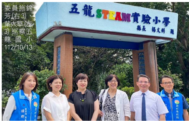
委員施錦芳(右3)、葉大華(左3)巡察五龍國小 112/10/13

監察委員施錦芳、葉大華 112 年 10 月 13 日巡察新竹縣，關注垃圾處理與自燃防治、因應少子化廢校及公共化托育養護等問題。委員關切日前媒體報導新豐鄉垃圾掩埋場屢傳自燃事件，敦促縣府借鏡其他縣市處理經驗，將現行措施對公眾作妥適說明與溝通。同日前往芎林鄉五龍國民小學、嘉豐非營利幼兒園暨托嬰中心視察，委員對於小學轉型開辦各式創意科技實驗課程，以及縣府持續優化公共化教保服務量能，留下深刻印象並表達肯定。