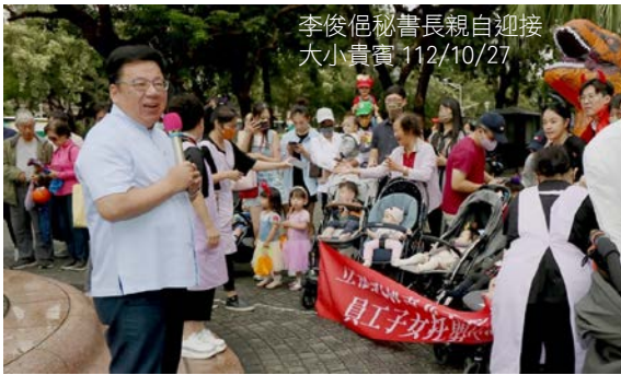
李俊佺秘書長親自迎接大小貴賓 112/10/27

立法院托嬰中心 10 月 27 日舉辦萬聖節變裝參訪監察院活動，寶寶們在家長的精心裝扮下，以白雪公主、南瓜、超級瑪利歐兄弟等可愛造型，一路從毗鄰的托嬰中心遊行至監察院，李俊佺秘書長親自到大門迎接，發放餅乾給這些可愛的小貴賓們，共同歡慶萬聖節，場面熱鬧溫馨。隨後參觀美麗的監察院百年古蹟，寶寶們陽光般的可愛笑容，也為監察院增添不少歡樂活潑的氣氛。