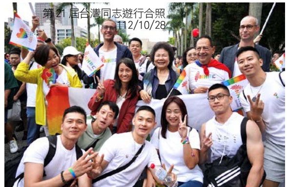
第 21 屆台灣同志遊行合照 112/10/28

國家人權委員會與法國在台協會簽署「台法人權合作意向書」一年多來，已進行多項人權合作交流。去年 12 月陳菊主委一行應邀出訪法國期間，欣聞米歇爾副市長對多元性別人權的努力，因此特別提出邀請。