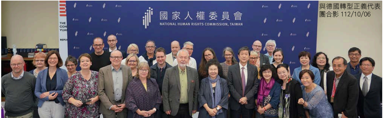
與德國轉型正義代表團合影 112/10/06

德國轉型正義代表團一行 22 人，112 年 10 月 6 日拜會國家人權委員會，陳菊主委感謝訪團代表在轉型正義議題上為台灣人民發聲，感嘆「時間是轉型正義最大的敵人」，強調做為國家最高獨立人權機構，會持續督促政府在轉型正義的作為。訪團包括德國 16 個轉型正義相關團體，由「德國聯邦研究東德共產主義獨裁政權基金會」主席 Markus Meckel 率領。該基金會為德國國會通過立法於 1998 年成立，長期致力於檢視共產主義獨裁統治的影響，並為反省歷史教訓，自許成為媒體與民眾之間的橋梁。