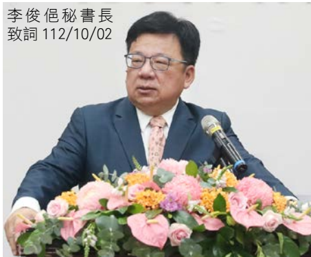
李俊佺秘書長致詞 112/10/02

陳菊院長表示，期盼能借重李俊佺秘書長長才，使監察權的行使發揮更高的成效，並持續推動各項人權工作；李俊佺秘書長則期許自己扮演好幕僚長角色，襄助院長推動院務，協助監察委員行使職權，提升為民服務品質，積極推動國際交流，於監察院第6屆下半場，將繼續加倍努力，精益求精。