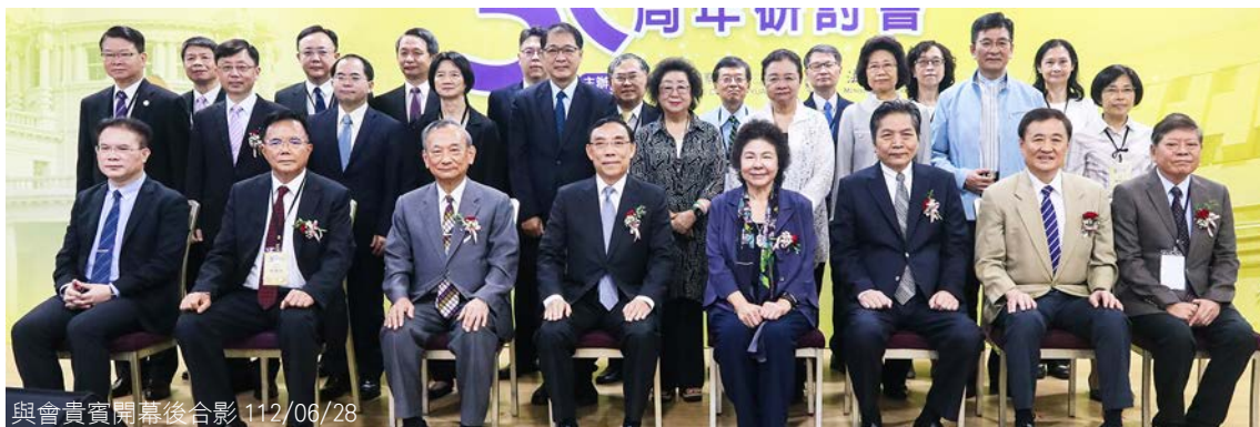
與會貴賓開幕後合影 112/06/28