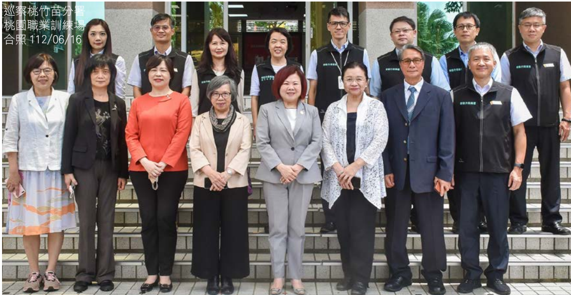
巡察桃竹苗分署 桃園職業訓練場 合照 112/06/16

監察院社會福利及衛生環境委員會 112 年 6 月 16 日由召集人蘇麗瓊委員偕同王麗珍、田秋堯、施錦芳、葉大華、鴻義章等委員，在勞動部許銘春部長陪同下，巡察移工一站式服務中心，瞭解移工