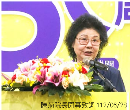
陳菊院長開幕致詞 112/06/28

財產申報法施行 30 周年研討會」，邀請國內相關領域專家學者，從法制面與實務面進行多元觀點深度探討與分析，由監察院廉政委員會召集人陳景峻委員擔任引言人，監察委員趙永清及王麗珍、法務部