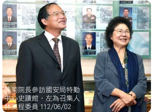
陳菊院長參訪國安局特勤中心史蹟館，左為召集人林文程委員 112/06/02

監察院外交及國防委員會於 112 年 6 月 2 日上午，由召集人林文程委員偕陳菊院長及委員一行共計 16 人，巡察國家安全局特種勤務指揮中心，