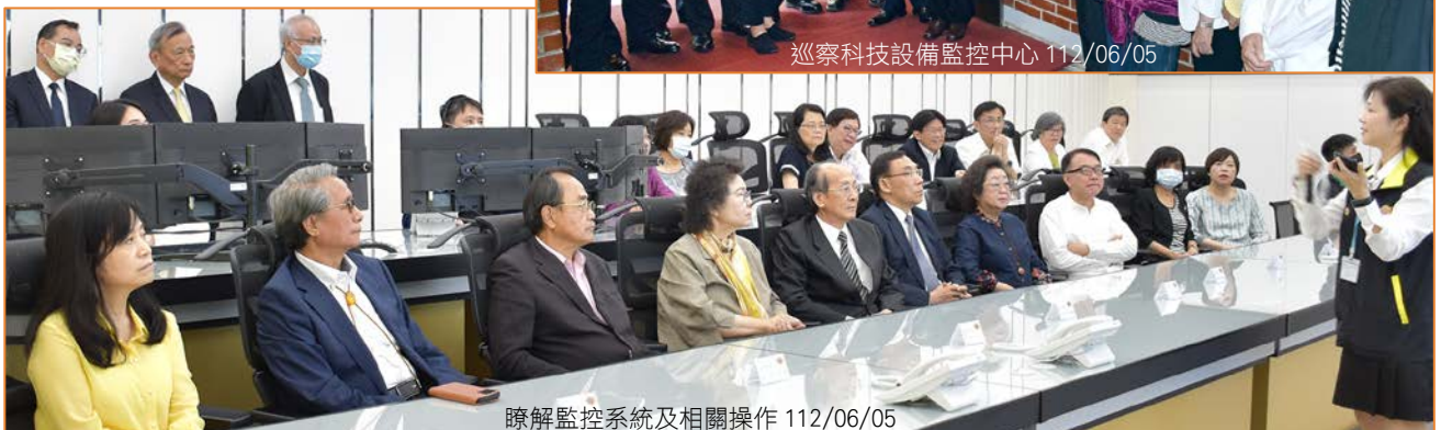
瞭解監控系統及相關操作 112/06/05