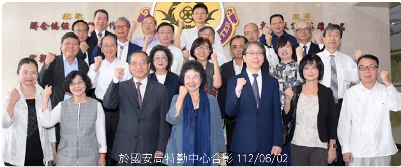
於國安局特勤中心合影 112/06/02