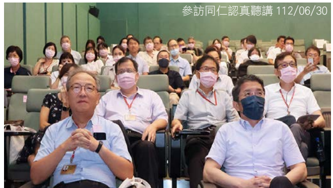
參訪同仁認真聽講 112/06/30

本次參訪除監察調查處同仁參加外，另有公職人員財產申報處、監察業務處、常設委員會及國家人權委員會等單位同仁，合計近 90 人參與，顯示院長指示精進科技監察訓練之政策，頗能契合監察院工作所需，引起同仁廣泛共鳴及熱情響應。