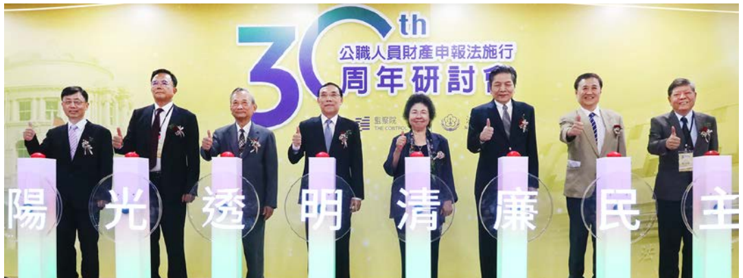
在點亮光圖儀式下揭開研討會序幕，左起法務部廉政署莊榮松署長、法務部蔡碧仲政次、陳明堂政次、蔡清祥部長、監察院陳菊院長、李鴻鈞副院長、陳景峻召集人、趙永清委員 112/06/28

為檢討公職人員財產申報法之執行成效與法規窒礙，監察院與法務部於 112 年 6 月 28 日在臺大醫院國際會議中心 301 廳聯合舉辦「公職人員