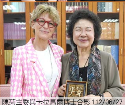
陳菊主委與卡拉馬爾博士合影 112/06/27

卡拉馬爾秘書長表示，很欣慰看見昔日接受救援的對象，如今成為推動人權保障的國家人權機構主委，這是非常良善的循環。她同時也對臺灣國際地位的困境與挑戰表達高度關注。