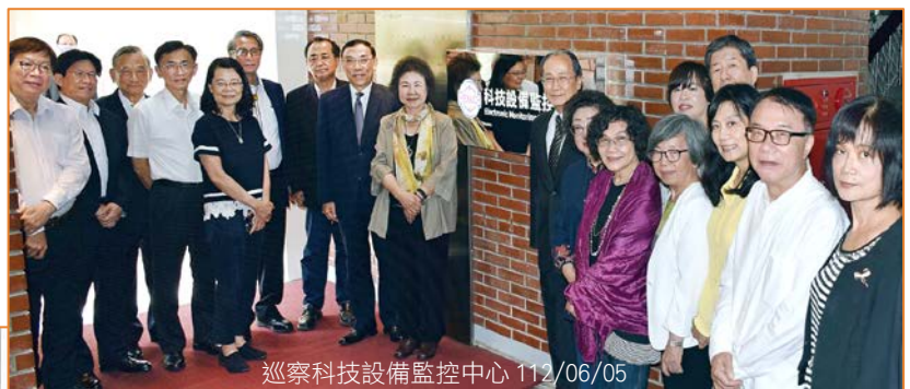
巡察科技設備監控中心 112/06/05

當日法務部蔡清祥部長、陳明堂政次及高檢署張斗輝檢察長親臨現場。委員分就科技偵查監控設備應如何評估成效、是否可擴大適用於性騷擾、家暴及網路或校園性侵等案件、是否有防止資料外洩等措施及同時採行刑事訴訟法第 116 條之 2 第 1 款與第 4 款之規定，俾提升多元監控之效能等議題關切。