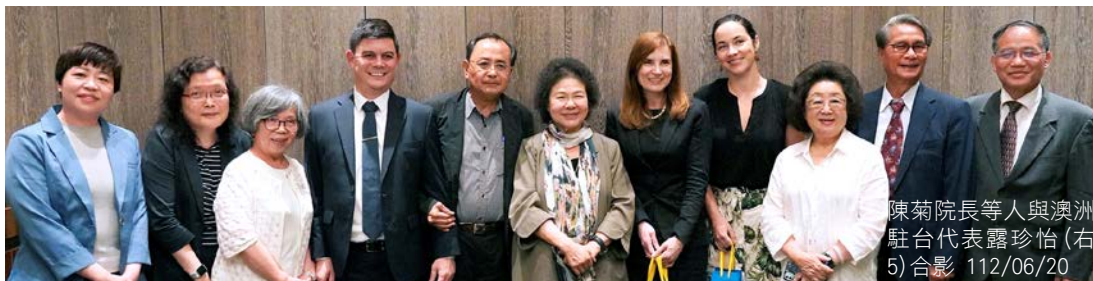
陳菊院長等人與澳洲駐台代表露珍怡(右 5)合影 112/06/20

在為以色列卸任駐台代表柯斯畢(Omer Caspi) 伉儷設宴饒別時，陳菊主委感謝合作辦理「SHOAH-猶太大屠殺-人類最惡之時」專題攝影展，共同推動人權教育，同時也歡迎新任代表 Mrs. Maya Yaron。