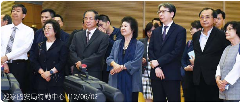
巡察國安局特勤中心 112/06/02