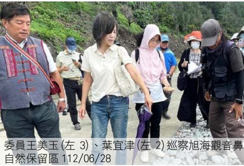
委員王美玉(左 3)、葉宜津(左 2)巡察旭海觀音鼻自然保留區 112/06/28

監察委員王美玉、葉宜津 112 年 6 月 27、28 日赴屏東縣巡察。27 日受理民眾陳情，拜會副議長盧文瑞、縣長周春米，關心地方輿情與施政概況，瞭解高屏溪溪流生態公園工程維護管理情形。28 日前往旭海觀音鼻自然保留區、旭海衛生室及恆春社會福利綜合館，關心目前臺灣僅存之高自然度海岸帶生態永續及部落開發的衝突與平衡情形，以及臺灣最南端醫療健康照護站、社會福利綜合館等軟硬體布建與服務效能。