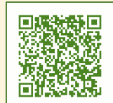
個人捐贈宣導影片