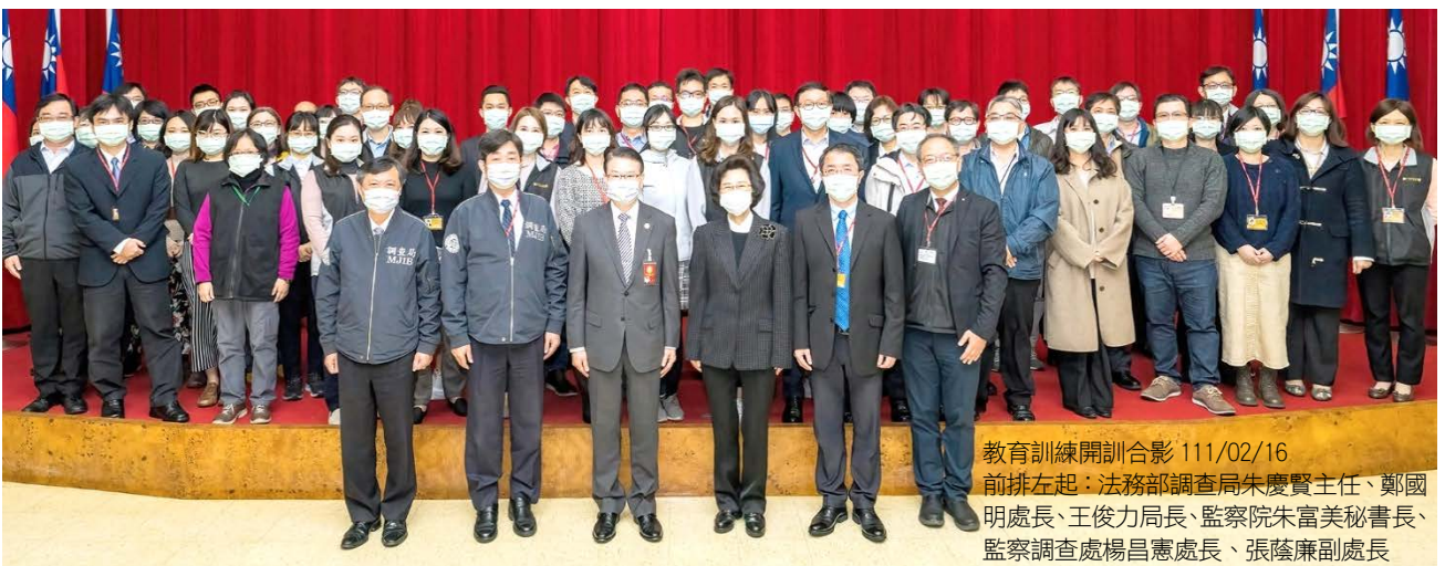
教育訓練開訓合影 111/02/16

本次研討行程，內容豐富而充實，參與之同仁均表示不虛此行；允可期待在未來業務興革上，發揮啟迪創新之功效。