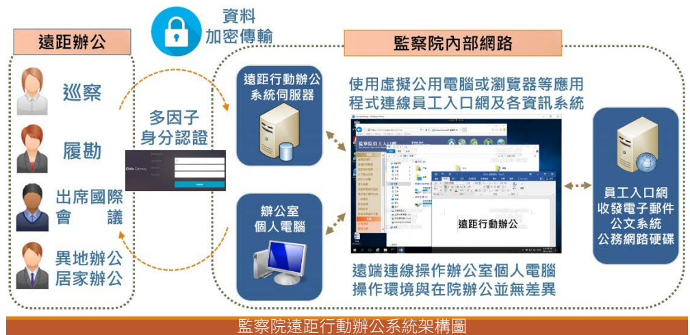
監察院遠距行動辦公系統架構圖

監察院為精進職權行使效能，藉由科技技術輔助及整合各類數位資源，積極辦理數位轉型及科技升級規劃與部署。為強化業務反應效率，及有效因應 COVID-19 疫情或緊急狀況之異地或居家辦公安排，並確保符合資通安全管理法規定之使用者身分驗證的安全檢核，及資料傳輸過程的機密性與完整性等必要資安防護措施，監察院積極導入可快速部署，同時兼顧內部網路、應用系統與業務資料安全之「遠距行動辦公系統」，並於 111 年 1 月 27 日辦理 2 場次使用者操作講習，自同年 2 月 7 日正式上線。