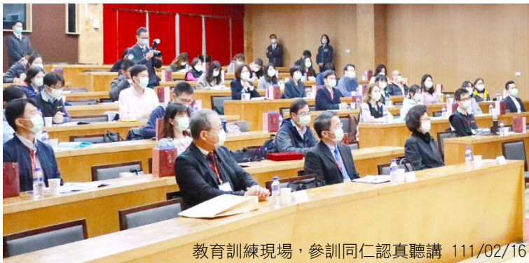
教育訓練現場，參訓同仁認真聽講 111/02/16

本次訓練除有監察調查處同仁參加外，另有多個院內單位派員參與。課程開始前，首先由調查局王俊力局長致歡迎詞及就該局業務做梗概介紹，監察院朱秘書長接續為感謝詞及分享其擔任主任檢察官期間與調查局合作辦案之經驗，並期許監察院同仁把握本次交流機會，互相激盪，學習成長。