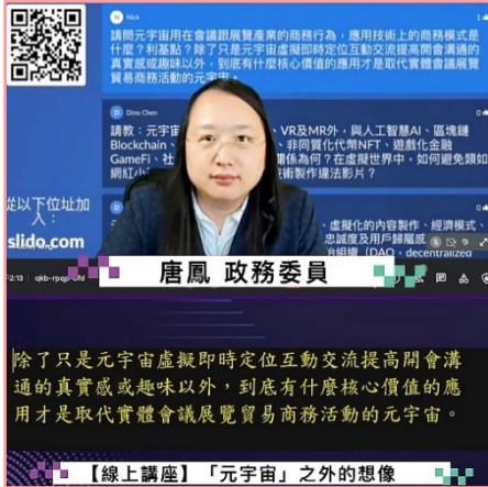
政務委員唐鳳視訊主講 111/02/14

國家人權委員會 111 年 2 月 14 日舉行數位人權系列第二場研討會，邀請行政院政務委員唐鳳，視訊主講「『元宇宙』之外的想像」，並進行問題交流。人權會范巽綠委員也參與主講「數位科技與數位人權教育」的議題。