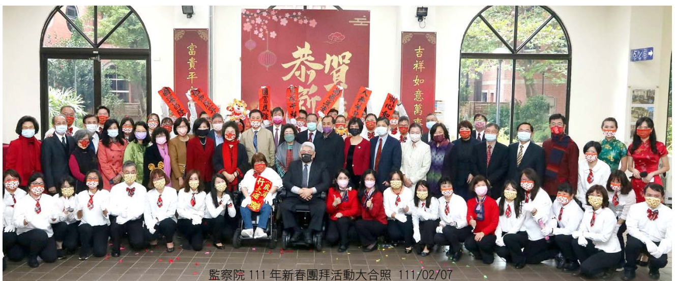
監察院 111 年新春團拜活動大合照 111/02/07

穿一襲華美的長袍開場，熱鬧地揭開了活動的序幕。緊接著陳菊院長上台祝賀，陳菊院長致詞時表示，感謝過去一年來，監察院全體委員、同仁及審計部的共同努力，致力推動院務及人權保障工作，並祈望虎年新冠疫情儘快趨緩，監察院業務能夠虎虎生威，繼往開來、再創新猷。