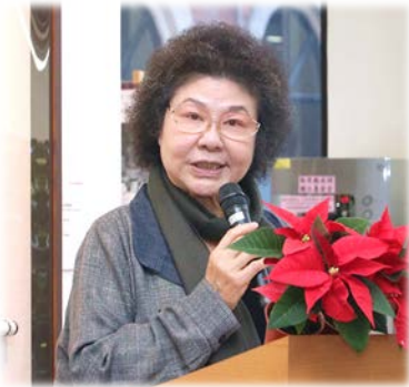
陳菊主委致歡迎詞 110/12/16

監察院愛心會 110 年 12 月 16 日邀請盲人重建院學員來院進行職業技能實習，並指導同仁「護眼舒壓 DIY」。陳菊院長於出席歡迎會致詞時，強調監察院和國家人權委員會甚為重視身心障礙者權益，於今年發表身心障礙者權利公約第二次國家報告之獨立評估意見時，特別呼籲各級政府於疫情期間採行相關措施，以確保身障朋友獲得平等協助與保障。