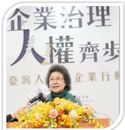
↑陳菊主委致詞。↓陳菊主委與監察委員等人於 2021 臺灣人權與企業行動論壇大合照，前排右 5 為立委柯建銘 110/12/06

陳菊主任委員致詞時表示，臺灣企業在全球產業供應鏈居關鍵地位，若能致力於企業人權，不只是員工勞動條件與勞動權益，可以獲得實質的改善，創造永續發展的環境，還可以為企業創造客群、提升企業聲譽及品牌價值。