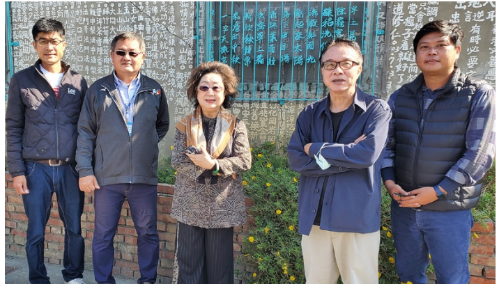
委員范巽綠(左3)、林盛豐(右2)參訪梧北社區鐵花窗藝術 110/12/07

監察委員范巽綠、林盛豐於 110 年 12 月 6 日、7 日赴雲林縣巡察，關心縣政發展及地方創生推動情形。委員對雲林縣政府近年努力改善濁水溪揚塵、垃圾回收循環再利用、地區醫療照護，及在有限財政資源下，積極爭取中央競爭型補助，發展地方建設，並引進專業人才協助農村推動地方創生，表示肯定。