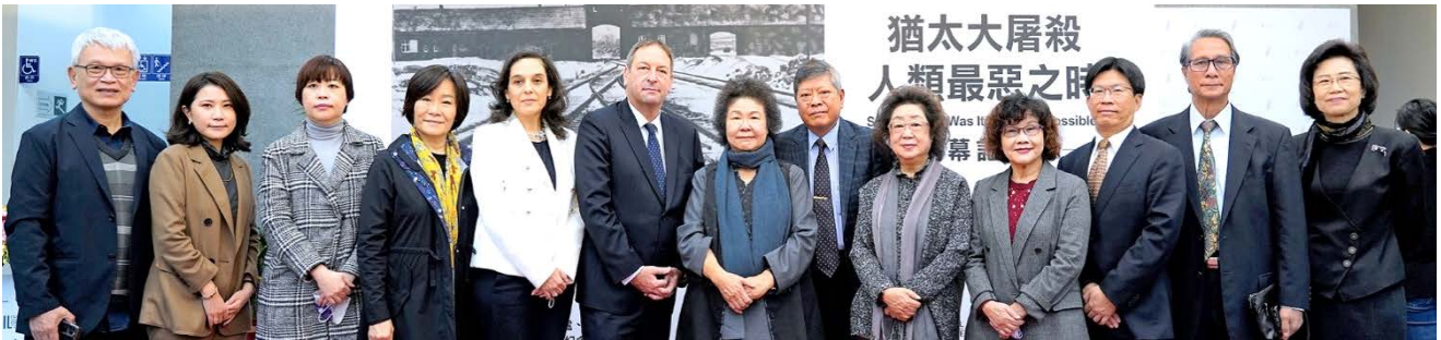
陳菊主委與監察委員等人於猶太大屠殺攝影展開幕記者會合影，左6為駐臺北以色列經濟文化辦事處代表柯思畢 110/12/08