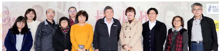
監察委員及同仁前往忠孝復興站觀展並合影 110/12/29

國家人權委員會與國際特赦組織 (AI) 臺灣分會，合作舉辦「跨越國界的人權火炬海報聯展」，110年12月4日至30日先在臺北捷運忠孝復興站 B3 藝文廊登場，111年1月7日起移到高雄捷運美麗島站長廊續展。邀請社會各界，直面國際人權侵害現場，共同接下人權火炬，期許光明照亮黑暗，綻放民主與自由。