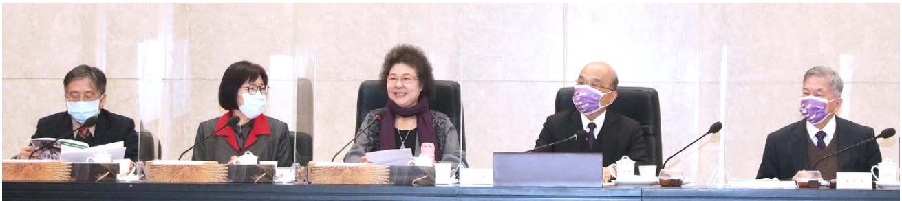
陳菊院長率監察委員巡察行政院，左起監察院賴鼎銘委員、施錦芳委員、陳菊院長、行政院蘇貞昌院長、沈榮津副院長 110/12/28

監察院第6屆監察委員於110年12月28日，由院長陳菊擔任領隊，赴行政院巡察，會中由行政院院長蘇貞昌親自就該院110年施政重點工作進行簡報。陳菊院長首先提到110年7月，國家人權委員會公布首份人權調查報告（林水泉案），是過去威權時期未經司法程序直接侵害人權的典型案，此外，她身兼人權會主委，有機會重回她42年前被矇著眼帶去疲勞訊問、關押的安康接待室，並呼籲政府應重視威權時期統治者侵害人權事件的發生地（不義遺址）之保存，以作為人權教育的場所。