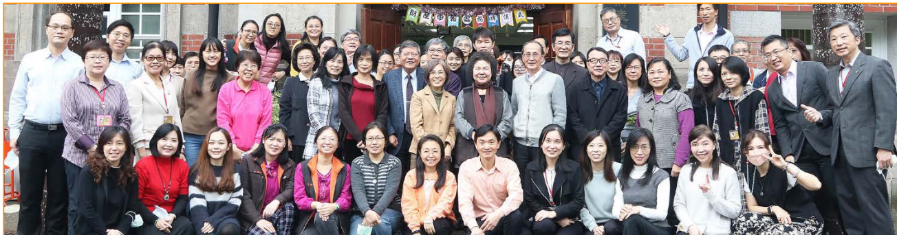
陳菊院長及委員等人一同揭牌並與申報處同仁合影 110/12/22

該處在陳菊院長的領導，以及朱富美秘書長指導下，正邁向數位轉型的蕪新階段，並落實「宣導零距離、互動無障礙」的多元化宣導服務，並在廉政委員會召集委員及其他委員督促下，期望廉政職能因此更加發揚，亦藉此次蕪新揭牌儀式，象徵陽光四法邁向新里程碑。