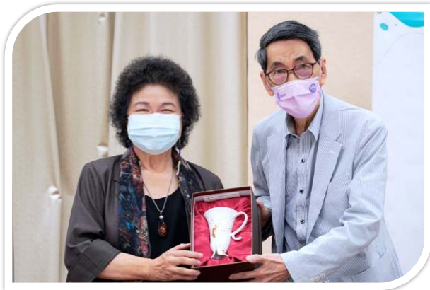
陳菊主委於視訊座談前與黃默教授合影 110/07/12

國家人權委員會 110 年 7 月 12 日邀請人權諮詢顧問黃默教授，就「台灣人權教育 20 年的回顧與展望」主題進行座談。主委陳菊於視訊座談前，親至現場致意後，即與多位委員及同仁在不同空間聽