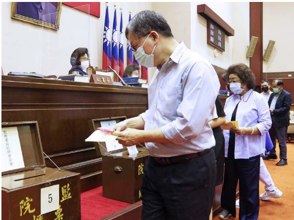
監察委員於院會進行選舉投票 110/07/20

為期各委員會業務均衡發展，監察院各委員會組織法修正案於 110 年 5 月 12 日經總統公布，調整各常設委員會組織，將原外交及僑政委員會、國防及情報委員會合併為外交及國防委員會，另成立社會福利及衛生環境委員會，並自 110 年 8 月 1 日施行。