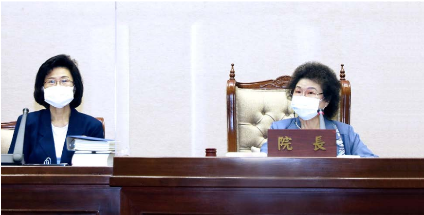
陳菊院長於院會發表第 6 屆周年談話，左為朱富美秘書長 110/07/20

陳菊院長於 110 年 7 月 20 日監察院會議中表示，第 6 屆院長、委員於 109 年 8 月 1 日就職，即將屆滿一周年，感謝監察院每位夥伴的付出。