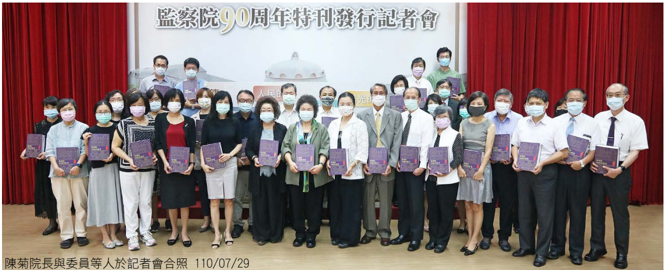
陳菊院長與委員等人於記者會合照 110/07/29

監察院 110 年 7 月 29 日正式發行「監察院 90 周年特刊」，陳菊院長致詞表示，本特刊撰述監察制度沿革、人權業務進展、重要工作成果、建築今昔風貌等，留下許多珍貴紀錄，從第一屆的于右任院長時期，到今日台灣歷經多年民主發展過程，這是歷史轉變及民主發展的點滴紀錄，也是承先啟後的重要紀實，期許未來跟同仁齊心努力，開創歷史嶄新篇章。