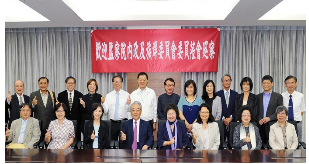
巡察委員訪查海基會 110/04/23

監察院內政及族群委員會 110 年 4 月 23 日上午由召集人王美玉委員偕同 18 位委員，參訪海基會聯合服務中心，聽取許代董事長簡報，下午赴陸委會巡察，聽取邱主任委員簡報，瞭解兩岸交流情形。委員於座談會議中，提出諸如台灣人權工作者李明哲關押在陸及親屬探視問題、疫情期間台商資金回台投資項目、疫情期間對於陸配未成年子女來台具體協助、大陸來台挖角人才等有關兩岸往來衍生之問題，並提出諸多建議。