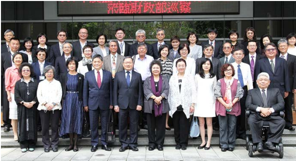
巡察財政部與該部主管人員合影 110/03/31

監察院財政及經濟委員會 110 年 3 月 31 日、4 月 1 日巡察財政部、勞動部勞動力發展署、金融監督管理委員會。31 日由召集人田秋堇委員偕同陳菊院長等 16 人巡察財政部，委員們對相關議題多所垂詢並提出建言。1 日一行 19 人巡察勞動部勞發署，先前往新北市台灣盲人重建院，巡察該院職業訓練等情形，再前往金管會聽取施政業務簡報，陳菊院長期待該會能持續推動與時俱進的金融革新，強化金融市場的安全。