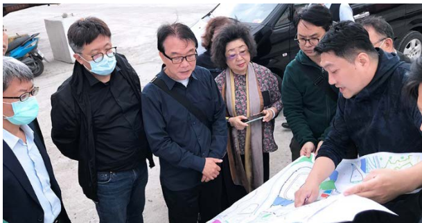
委員范巽綠(左 4)、林盛豐(左 3)巡察產業園區 110/04/19

監察委員范巽綠、林盛豐於 110 年 4 月 19 日巡察基隆市，瞭解「北五堵國際研發新鎮產業園區」規劃情形，委員對於產業園區未來將結合智慧交通 TOD(Transit-oriented development，大眾運輸導向型發展)，採都市計畫方式辦理，促請市府務須通盤考量主要及細部計畫。此外，由於產業園區位處基隆河河谷廊帶區域，建議廊帶之開發可結合水利景觀生態，以帶動園區發展，成為吸引產業與人潮的經濟命脈。