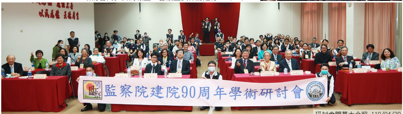
研討會閉幕大合照 110/04/30