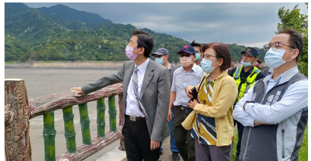
委員蔡崇義(左 1)、施錦芳(左 2)巡察石門水庫 110/04/26

監察委員蔡崇義、施錦芳 110 年 4 月 26 日赴桃園巡察，對於市府推動石門水庫及大漢流域跨域亮點計畫，能夠結合人文、生態環保及低碳旅遊，予以肯定，促請預先規劃交通疏導策略及提供足夠的停車空間，並且建議善用獨特人文歷史，結合轉型正義教育，開發新型態旅遊，帶動觀光產業及生態經濟，打造特色景點。近日水情嚴峻，委員關切水庫蓄水率、薑母島居民出入問題，期勉市府積極調度水資源，渡過缺水危機。