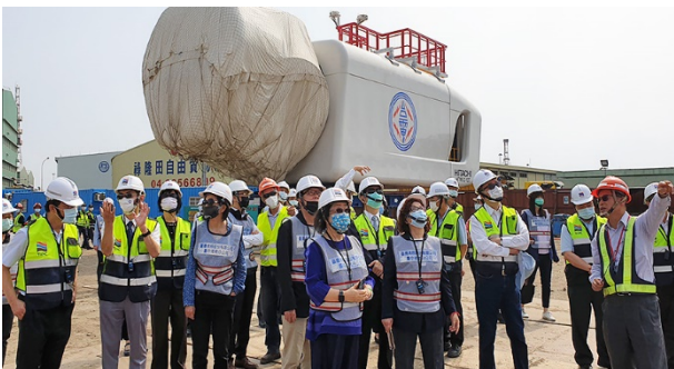
巡察委員瞭解離岸風電專區建設情形 110/04/26

監察院交通及採購委員會 110 年 4 月 26 日由召集人林盛豐等 9 位委員，巡察臺中車站及臺中港，瞭解臺中車站鐵道文化園區興建營運轉案及臺中港離岸風電專區推動情形。27 日前往臺中國際機場，瞭解新冠肺炎疫情防疫措施及航廈改善工程情形。林委員期許臺中車站與臺中港建設，能創造商業效益與都市發展，為臺中綠色經濟產業打下基礎，並請交通部注意國際旅運發展及國內需求，滾動檢討機場建設及營運成效。