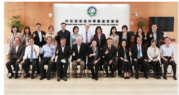
巡察南部科學園區管理局合影 110/04/29

監察院教育及文化委員會 110 年 4 月 29 日由院長陳菊、召集人賴鼎銘委員偕同監察委員等 17 人，在科技部吳政忠部長陪同下，前往南部科學園區管理局瞭解園區營運管理、開發進度及抗旱措施等情形，接著轉往國研院半導體中心臺南基地，除視察先進設施建置及使用狀況外，同時聽取研發成果報告；30 日上午於南科高雄園區進行座談會，下午前往高雄市立圖書館總館瞭解典藏特色、維護管理及友善環境建置等情形。