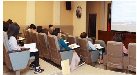
研討會同步於簡報室、會議室及梯廳進行 110/04/30

研討會閉幕式由趙永清委員代表監察院致詞，除感謝與會貴賓熱心參與，並表示本場研討會將為監察院注入改革靈魂，結束時並與在場貴賓合影。會後蔡崇義委員、前監委馬秀如、秘書長朱富美與調查處同仁開心合影，研討會圓滿落幕。