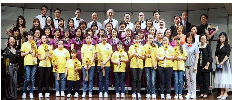
「晴聲樂語」音樂會現場合影 110/04/24