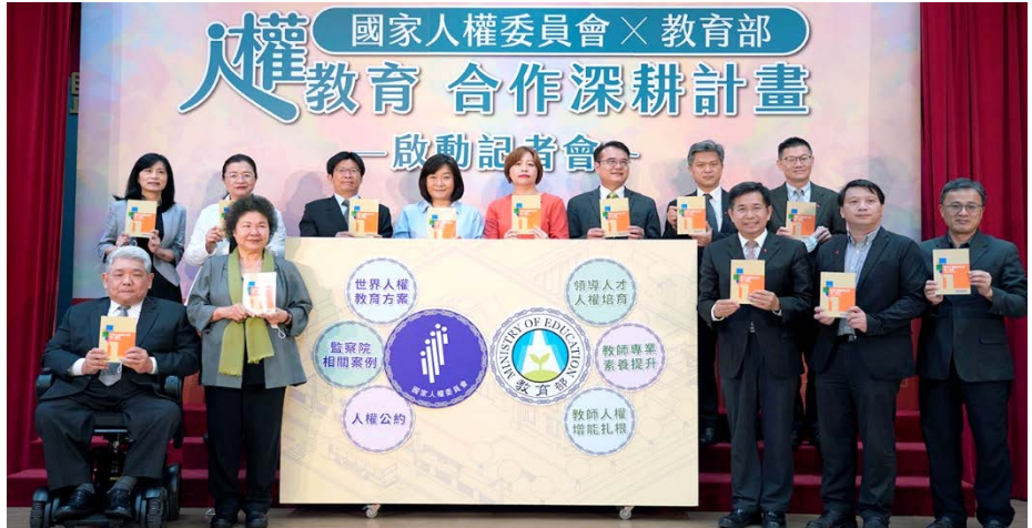
人權會與教育部聯合舉行「人權教育合作深耕計畫」啟動記者會，人手一本聯合國「世界人權教育方案」中譯本 110/04/26

國家人權委員會主委陳菊與教育部長潘文忠 110 年 4 月 26 日聯合舉行「人權教育合作深耕計畫」啟動記者會。陳菊主委表示，人權會完成聯合國「世界人權教育行動計畫」的翻譯與印製，希望跟所有教育工作者共同努力，加速台灣校園人權教育的普及與深化。潘文忠部長表示，自五大國際人權公約施行法陸續公布，教育部已成立「人權教育工作小組」，希望這個人權教育深耕計畫，能夠成為台灣維護人權的重要基礎。全國教師會理事長侯俊良也強調，期待人權概念像呼吸空氣一樣自然的深植人心。