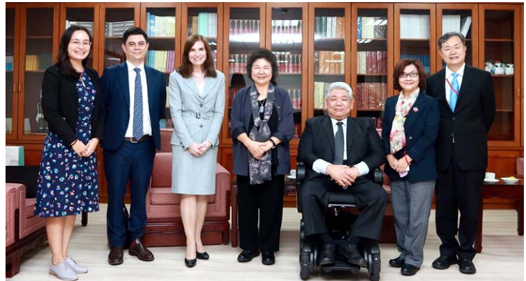
澳洲駐台辦事處代表露珍怡(左 3)拜會陳菊院長 110/04/13

澳洲駐台辦事處新任代表露珍怡 (Jenny Bloomfield) 於 110 年 4 月 13 日拜會監察院院長陳菊，院長感謝澳洲駐台辦事處對太魯閣號事故的慰問及捐款，並提到澳洲對於人權的精進向來不遺餘力，有許多台灣可借鏡學習之處。露代表除恭賀人權會成立，也肯定台灣在原住民議題上處理得宜，重視婦女地位及權益。台、澳兩國不僅在經貿、教育等方面長期交流往來，在原住民、婦女等人權議題上，都有類似處境及關懷面向，雙方皆希望未來能有更進一步的交流及合作。