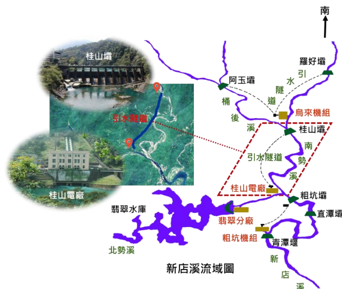
圖 1 新店溪流域圖

本案經調閱經濟部水利署（下稱水利署）、經濟部能源署（下稱能源署）、台灣電力股份有限公司（下稱台電公司）、臺北自來水事業處（下稱北水處）、臺北翡翠水庫管理局（下稱翡管局）、審計部等機關卷證資料，並於民國（下同）113 年 6 月 7 日前往翡翠水庫現場履勘、聽取簡報及詢問相關主管人員，嗣該等機關於 113 年 7 月 8 日查復資料到院發現，翡翠水庫位於新店溪支流北勢溪上，平時蓄積北勢溪水源，惟北水處原水取用策略係優先取用南勢溪水源，當南勢溪原水量不符所需時，始請翡管局發電放水再取用其尾水，造成每年平均約有 5 億噸之翡翠水源發電後即流入大海，未能再予有效運用，確有違失，應予糾正促其注意改善。茲臚列事實與理由如下：