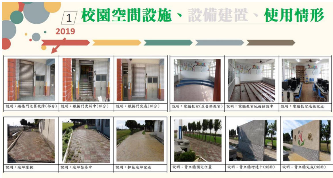
圖 2 潭墘國小裝修校園空間設施之情形