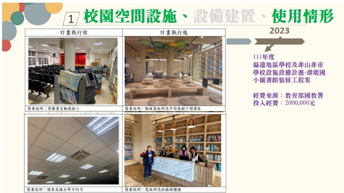
圖 3 潭墘國小裝修圖書館之情形