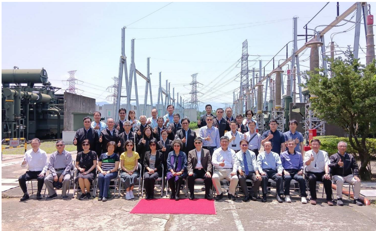
113 年 4 月 29 日巡察台電龍潭超高壓變電所 瞭解強化電網韌性計畫執行情形

委員們針對國家重要關鍵基礎設施安全維護與資通安全、力暘光電案嚴重損及政府形象有無防弊機制與監督措施、期許能源署與台電公司善用數字及平易近人的語彙進行社會溝通、加氫站何時上路、經濟部及台電對於核電延役的態度及準備情形、台電人力斷層及人才養成情形、能源轉型進度、工研院對於研發專利保護及技術轉移情形、人才留用及獎勵措施、鼓勵新創公司、輔導中小企業掌握碳排放、氫能等前瞻能源之研發及應用情形等議題提出詢問，並與相關主管進行意見交流。