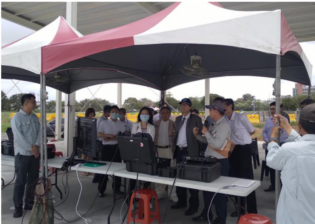
圖 6 本院於 112 年 8 月 4 日履勘本案無人機飛行