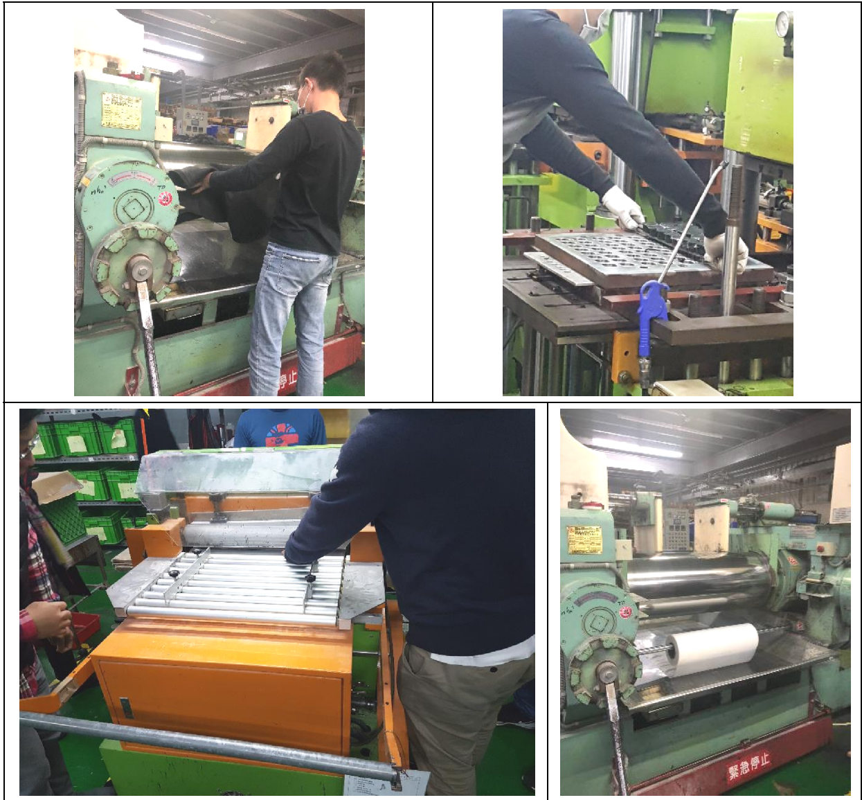
圖 4 C 橡膠公司作業現場。

4. 於 108 年 12 月 5 日履勘桃園 D 食品公司時抽訪移工及雇主代表：