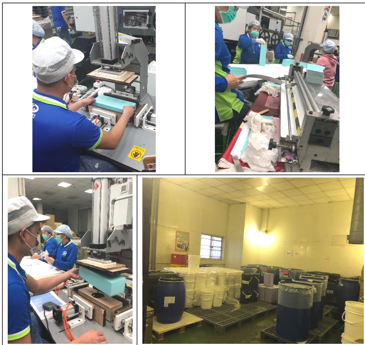
圖 7 E 企業公司作業現場。

(四) 綜上，本案履勘曾發生移工職災的廠場，發現勞動檢查機構多次檢查令限期改善，或列入專案輔導的事業單位，仍存有重大潛在危險的缺失，足見輔導建議、追蹤改善未盡落實。另外，工廠的危險警示標語缺乏移工熟悉的文字、缺乏對移工完整的勞工安全教育與訓練、沒有適當的教材及翻譯、端賴資深移工教導等現象普遍存在，均是移工持