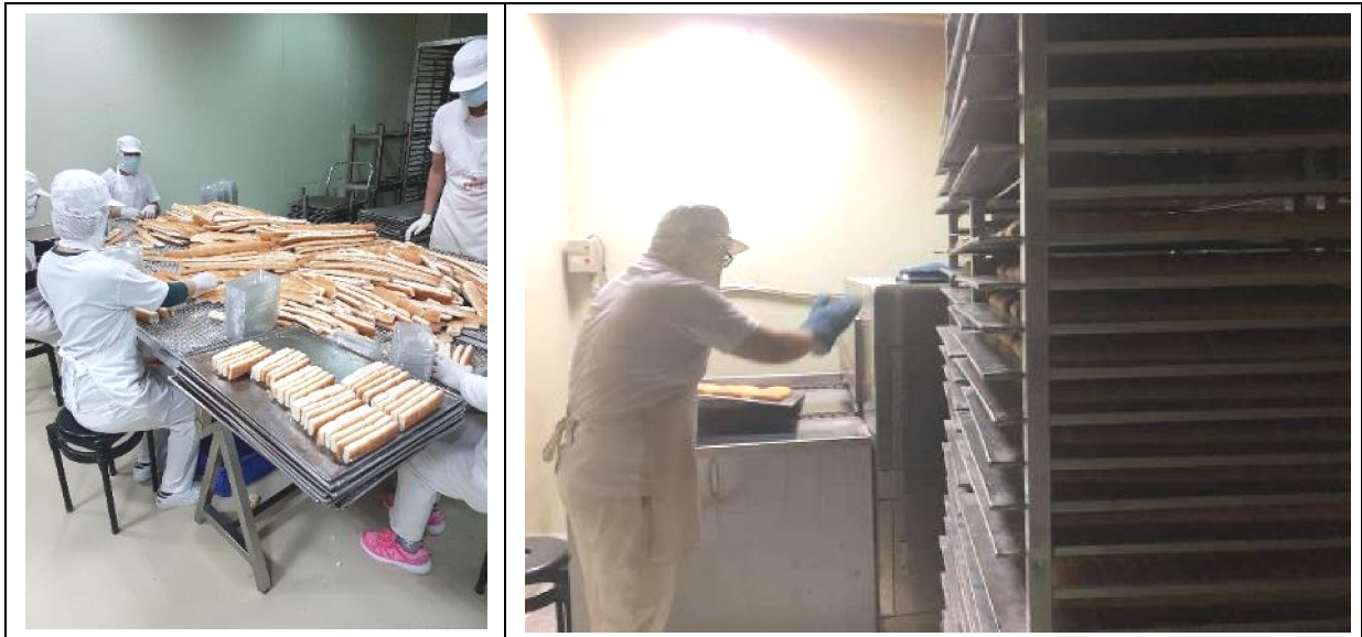
圖 5 D 食品公司作業現場。

用印尼語」、「老闆會告訴資深的移工，資深的移工會再告訴新人，所以知道哪個機器比較危險，例如使用烤箱就要小心燙傷」。