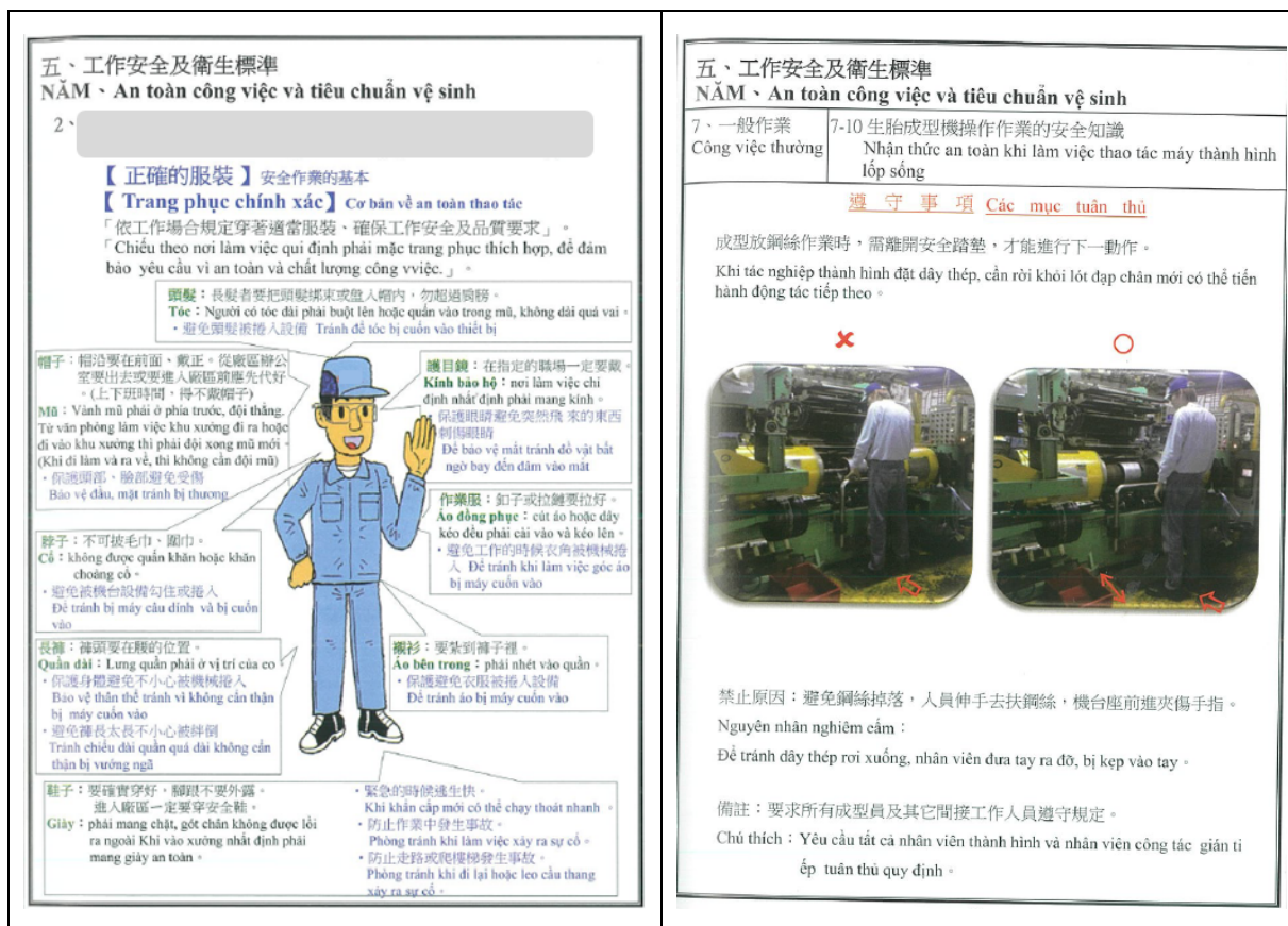
圖 2 B 輪胎公司每日晨會導讀公司安全衛生工作守則內容節錄。

(2)移工 C：「第 1 次來臺就在這間公司，在公司第 5 年，續約時沒有再付錢，目前在整型部門工作」、「在越南時有受過訓練，有給教材（書），有圖片，關於機器操作都是看書，來公司前沒有實際操作過」、「來公司之後，公司是安排一個前輩帶一個新人，沒有一起上過（說明機器如何操作的）課」、「知道公司發生過職災，有人受傷，剛來公司的時候科長有說；剛來公司的時候很擔心（受傷），所以會更小心，有新人來的時候也會提醒新人；會跟新同事說明比較危險