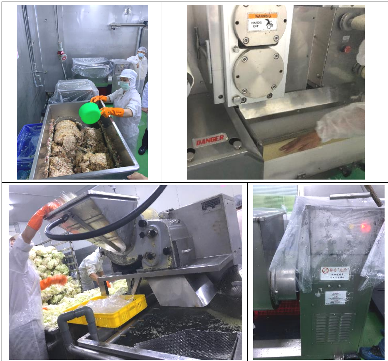
圖 1 A 食品公司作業現場。

2. 於 108 年 11 月 25 日履勘彰化 B 輪胎公司時抽訪不同年資移工各一人及雇主代表：