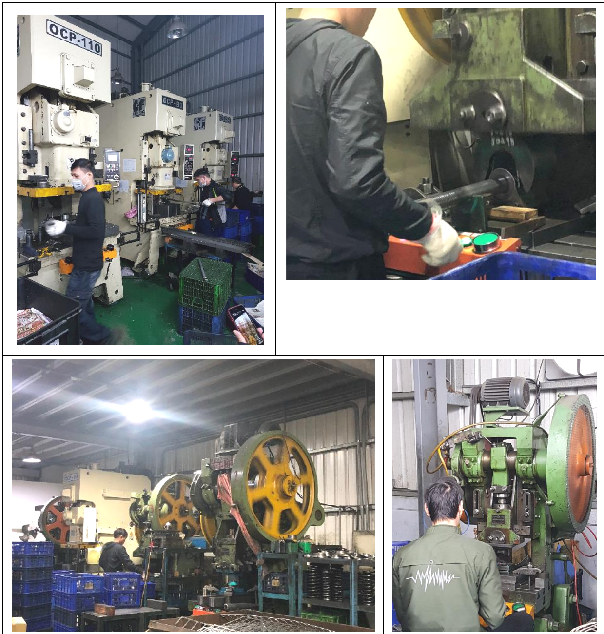
圖 6 E 企業公司作業現場。

6. 於 108 年 12 月 5 日履勘新北 F 印刷公司時抽訪作業現場移工，移工 H：「在公司工作 6 年，只有剛來的時候支付過仲介費，中