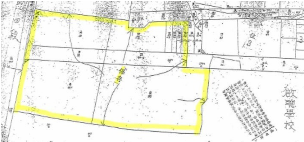
圖 2 臺北市三級古蹟陳悅記祖宅（老師府）保存區範圍