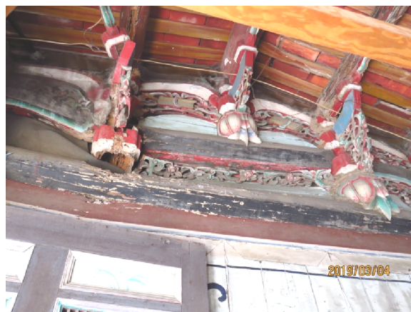
照片 2、門檻被鋸掉（左）、原有木棟架斷裂（右）