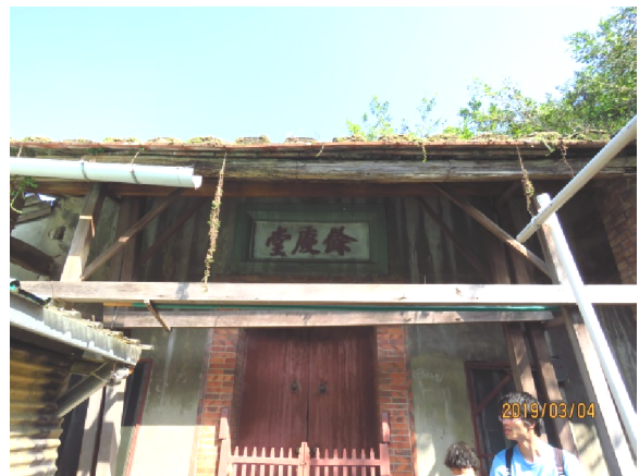
照片 5、古蹟隳壞情形