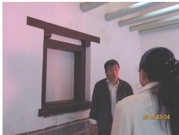
照片 1、古蹟原貌遭變更，屋脊粘黏消失不見（左）、窗戶型式變更且封閉（右）