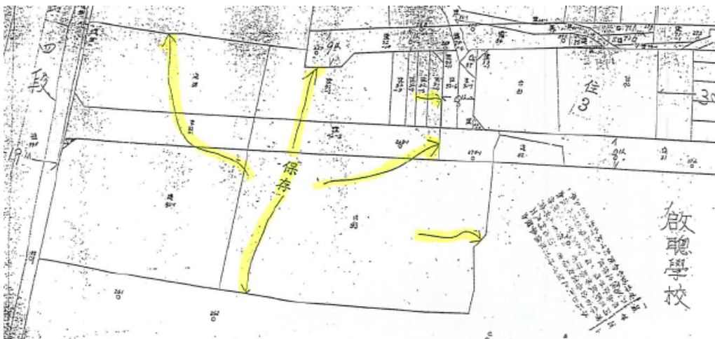
圖 1 三級古蹟陳悅記祖宅（老師府）保存區範圍