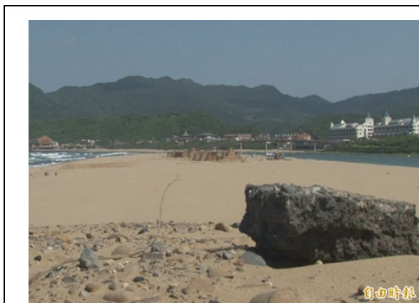
照片 1 營建廢棄物不遠處就是沙雕季所在地