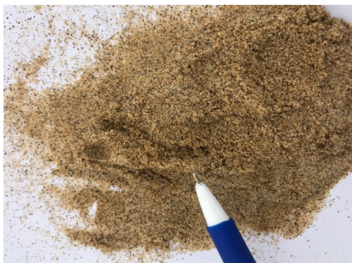
照片 4 本院現場履勘所攝黃金沙與原子筆比較

綜上，交通部觀光局為觀光事業中央主管機關，為發展東北角福隆地區之觀光產業，辦理福隆濱海旅館區 ROT+BOT 案，立意良善，惟於 100 年現勘同意福容飯店興建工程開挖剩餘土石方優先堆置於鹽寮沙灘上，未要求需先篩選成黃金沙粒徑大小始能放置，102 年實際運至沙灘過程中，該局所屬東北角管理處亦未詳細檢查有無過篩，肇致長達 3 公里之鹽寮福隆黃金沙灘上，有包含臺 2 線工程及福容飯店興建工程等合計高達 6 萬立方公尺之土石方，致使日治時期存在迄今之黃金沙灘竟混雜碎紅磚、水泥塊等，並於該局主辦之沙雕藝術季期間屢上新聞版面，影響觀光形象至鉅，確有疏失。