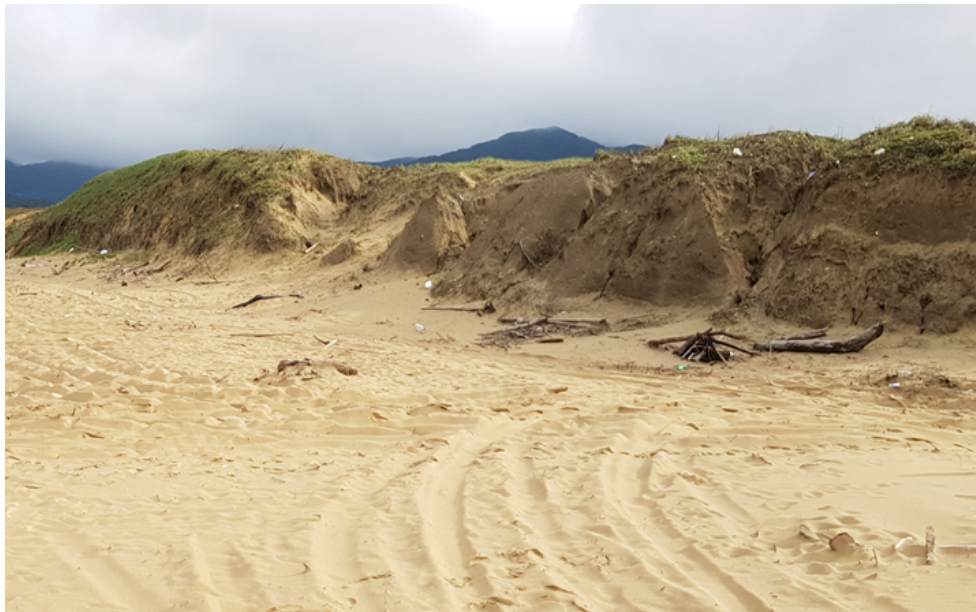
照片 3 本院 107.12.25 現勘拍攝土堆照片

(九) 本院查得台電公司於第 1 次養灘前所辦理之環境影響差異分析報告，該報告第 1-6 頁與第 1-7 頁有關「沙源性質分析」章節略以，港池與航道抽沙區所抽起之海沙，皆與其他陸上土石分開或分區暫置，避免相互混雜，影響海沙堆置區的沙料品質，進行養灘補沙作業時，則自海沙堆置區直接取料，以確保補沙料源與現有沙灘沙質的一致性。為確認港池與航道浚深所抽取之沙料提供養灘補沙之適用性，台電公司針對鹽寮沙灘、港池浚深抽沙場、核能四廠土石堆置區（海沙堆置區）等處，採集沙樣進行粒徑分析試