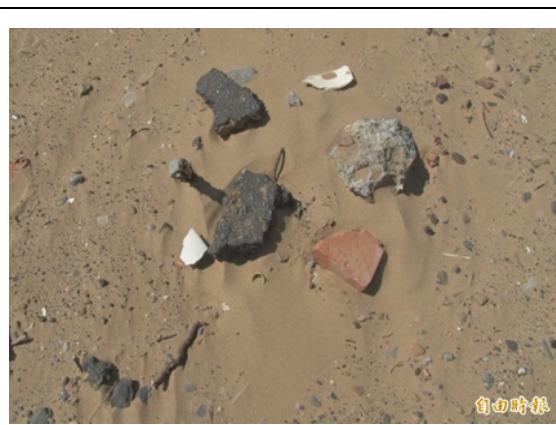
照片 2 沙灘上隨處可見大小不一的土石方