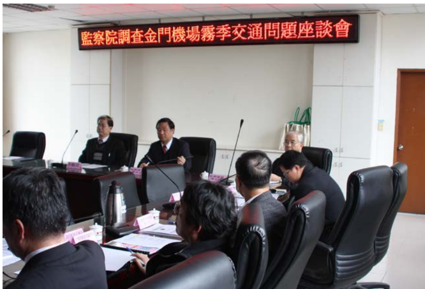
監察委員於 2011 年 2 月 25 日為金馬機場案舉辦座談會

金門及馬祖機場每年霧季期間，因機場能見度不佳，時常造成機場關閉，致成千旅客滯留場站。相關單位有無配套措施？機場助航及航管設施可否提昇？事關旅客權益及金門、馬祖之交通運輸，監察委員認為有深入瞭解之必要，而自動調查。