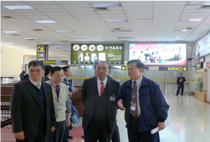
監察委員於 2010 年 12 月 9 日為松山機場噪音案赴現場履勘

站營運徵收使用費撥充噪音防制補助財源機制，顯有不足，對於未獲補助實際受影響民眾之權益保障，未盡公允；民用航空局允應澈底檢討飛航噪音防制策略，妥予制定補助規劃，以維民益。另現劃定航空噪音防制區未能反應實情，致生爭議，臺北市環境保護局允應慎審航空噪音實際影響程度及長期營運飛航噪音影響範圍，檢討必要之航空噪音防制區劃設。