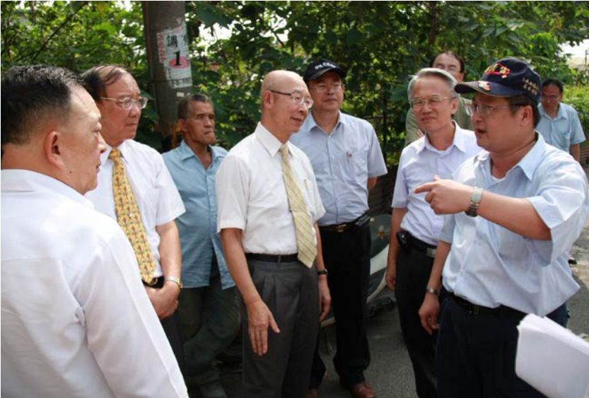
監察委員於 2010 年 10 月 15 日為廢鋁渣非法棄置案赴高雄鳥松履勘

廢鋁渣與鋁集塵灰主要產源為鋁鑄造業與鍊鋁業等鋁基本工業，據行政院環境保護署的統計，2009 年度列管廢鋁渣與鋁集塵灰產源事業共有 85 廠家，廢鋁渣與鋁集塵灰年平均產出量分別為 10,000 公噸及 2,600 公噸，前者主要係以掩埋方式處理；後者則以掩埋、固化及廠內再利用為主。此類廢棄物因含氮化鋁，經環境水解後，會釋放刺激性惡臭氣體－氨氣。