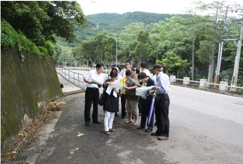
監察委員於 2011 年 7 月 6 日為「保變住 25 地區」案赴現場履勘

本案係李○○、鄭○○代表「住 25」土地所有權人陳述：陳述人等於 1988 年間陸續購入坐落臺北市士林區至善段三小段土地多筆，面積共計 19,910.98 平方公尺，約 6,023 坪。該等土地自 1979 年臺北市政府已編定為「保變住編號住 25 地區」，並於 1987 年 6 月 2 日修訂細部計畫公告實施在案。二十餘年來，陳述人等多次提出開發方案，然該府今卻表示該區不可開發，損及其等權益至鉅。