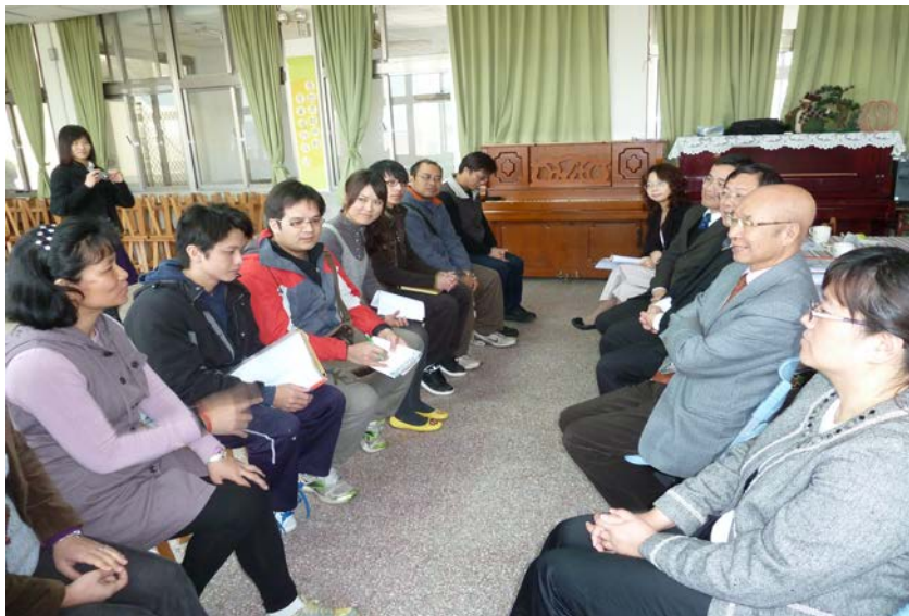
監察委員於 2011 年 2 月 22 日為國小兼任校長案實地訪查

民教育法第 9 條第 1 項校長應為專任之規定，教育部應負監督之責，促其檢討改進。