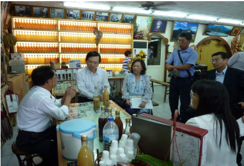
監察委員於 2011 年 8 月 23 日為小米酒案赴某酒莊履勘

技藝與文化的象徵；惟市售小米酒疑逾九成以糯米或白米混充釀造，甚至是用澱粉添加酒精之「再製酒」，卻統稱小米酒。此問題涉及公平交易、酒類標示及消費者保護等議題；究國內酒類相關法規、認證制度、商標規範及檢驗稽查，有無完善把關措施？監察委員認為有深入瞭解之必要，而自動調查。