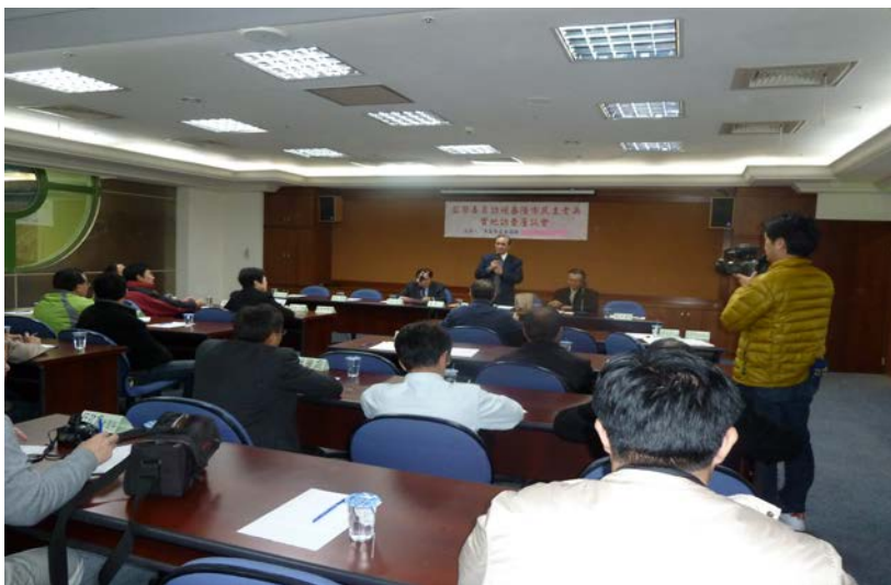
監察委員於 2011 年 3 月 3 日為民主老兵案赴基隆市舉辦座談會

「民主老兵」一詞是對民主前輩的尊崇，正如麥克阿瑟將軍（Douglas MacArthur, 1880-1964）所言「老兵不死，只是凋零」，其中有尊榮，但也有淒涼。「民主老兵」所代表的內涵，超越時空，且是台灣民主發展史的永恆記憶，允宜深入探討「民主老兵」精神及台灣精神的性靈價值，並積極發揚傳承。 148