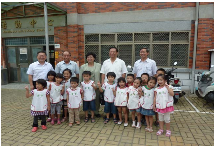
監察委員於 2010 年 9 月 30 日為補救教學案赴金門訪視

教育部自 1996 年以來所推動的教育優先區、攜手計畫課後扶助等計畫，在提高弱勢家庭孩子學習成就，縮短國中小學生的學習成就落差，彰顯教育正義，實現弱勢關懷方面，具有正面意義。惟該部未就國中小畢業條件之「成績及格」為定義；對國民教育階段畢業證書之發給未有基本能力門檻限制，亦無補救措施之規定，致未具讀寫算基本能力者亦得畢業，該部實有未善盡維持國民義務教育品質之責。