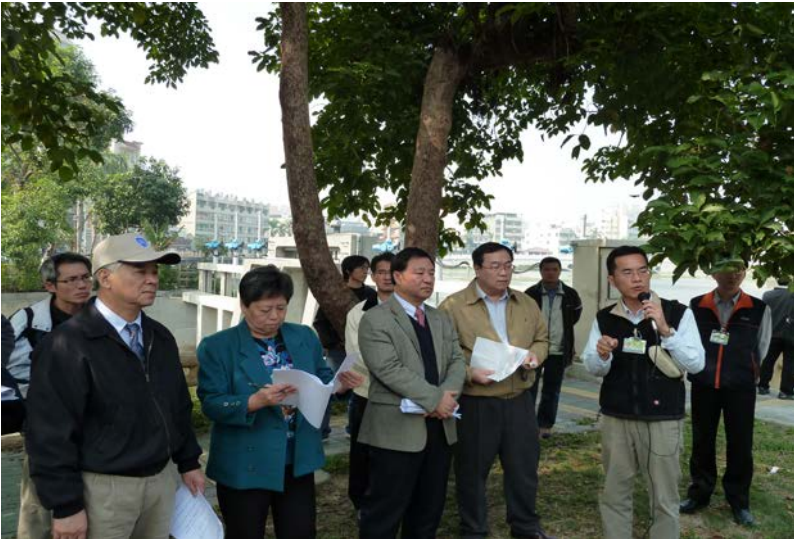
監察委員於2011年1月25日為凡那比颱風高雄市積水成災案赴現場履勘

據立法院邱委員○、林委員○○、張委員○○等陳訴：2010年9月18日至20日凡那比颱風來襲，造成高雄市三民區等多處地區積水成災；高雄市政府長期漠視下水道、排水溝渠及滯洪池等疏濬作業，又相關市府官員未於第一時間緊急救災及妥適作為，涉有違失等情。監察院值日委員認為有深入瞭解之必要，而核批調查。