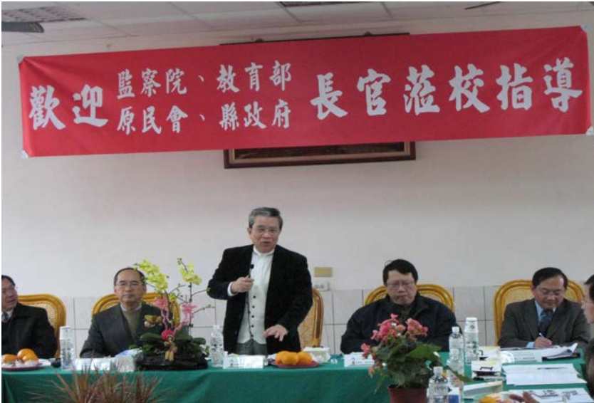
監察委員於 2009 年 12 月 30 日為原住民族教育措施案實地訪查

在我國整體教育水準不斷提升之際，對於教育條件相對處於弱勢的原住民族學生，如何透過積極的差別待遇，提供特別的補償措施，確保原住民族接受教育機會之均等，亟待主管機關審慎研議。又大專校院原住民族學生之助學措施仍有所不足，宜予重視。另部分原住民族鄉鎮、部落「隔代教養」、家庭功能迭失之現象十分嚴重，相關主管機關應持續推動原住民族家庭親職教育，以提升其家庭功能。