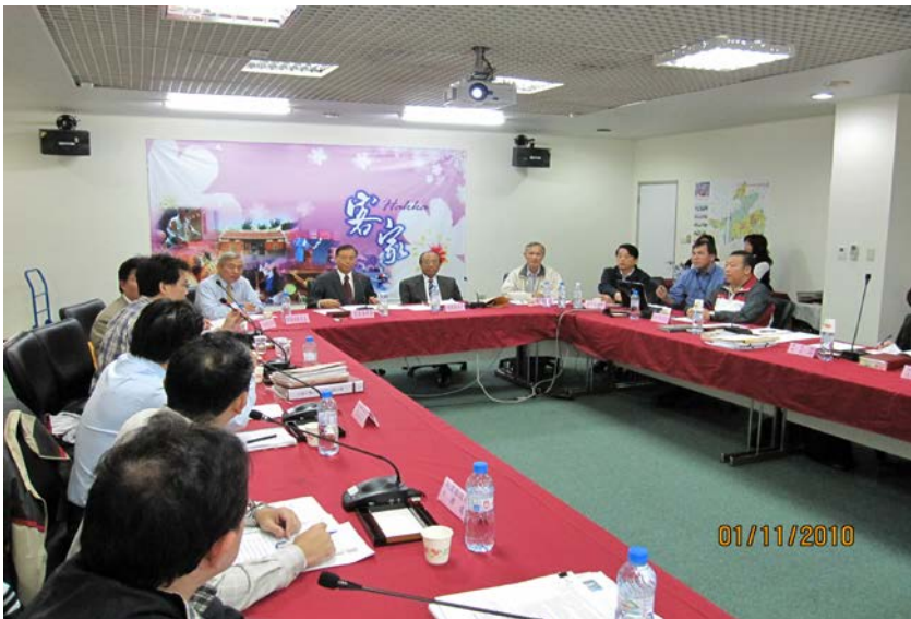
監察委員於 2010 年 11 月 1 日赴中壢市公所約詢

據許○○君等陳訴：桃園縣政府辦理中壢市中山路拓寬工程土地徵收作業，疑似路樁釘立位置錯誤，致陳述人等該路北側地上物所有權人之權益受損，業經監察院於 1972 年糾正在案，並於 1993 年獲該府函復將從優補償，然該府迄未妥處，涉有違失等情。監察委員認為有深入瞭解之必要，而自動調查。