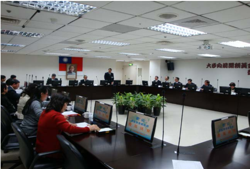
監察委員於 2011 年 4 月 1 日赴臺北關稅局履勘

本案調查意見經監察院財政及經濟委員會審議後，糾正財政部關稅總局及台北關稅局；並函請財政部督飭所屬就本案陳訴人等被懲處案件重新檢討妥適處分並議處失職人員；另函請法務部轉相關檢察機關針對涉及刑事部分依法偵辦。