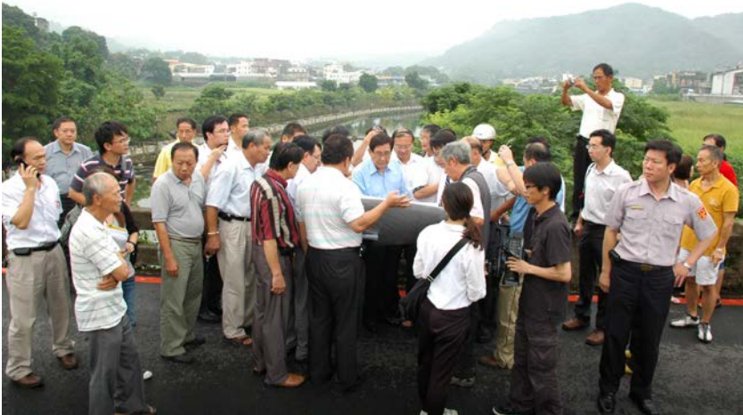
監察委員於 2011 年 7 月 11 日為關西牛欄河案赴現場履勘

都市計畫公共設施用地設置與土地使用分區管制，目的均係促進都市計畫範圍內土地合理使用所為之規劃，惟二者意義迥然相異，本案牛欄河沿岸「行水區」之劃設，係都市計畫為特別使用管制事項而設之使用分區，非屬公共設施用地，倘民眾質疑使用分區劃設不當，仍應循都市計畫變更方式，另劃定為適宜使用分區。