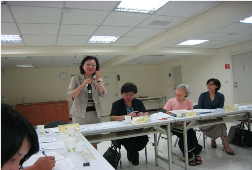
監察委員於 2011 年 8 月 13 日為自立少年案赴台中區訪視

府依法善盡保護輔導之責，致相關協助措施紊亂、扶助及協助機制不足，嚴重影響是類少年身心健全之發展。