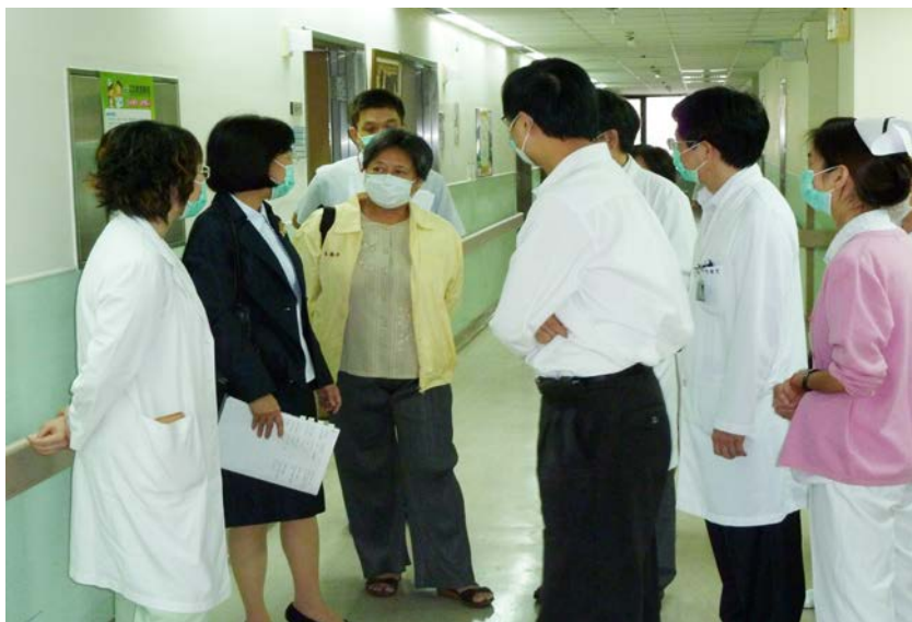
監察委員於2010年10月4日赴署立桃園醫院無預警履勘訪查

桃園縣政府及該府衛生局疏於督導考核，致桃園醫院在未獲該府核准前，即擅自向病患分別收取RCC「清潔日用品費」、「看護費」及RCW「照護清潔費」，期間分別長達3年及8年以上，復坐令該院長期未依規定開立名實相符之病患收據，迨本院調查後，始要求該院改善，實有違失。另衛生署疏於監督，致所屬公立醫院擅訂RCW自費項目，金額亦無客觀，並有桃園、新營及旗山等署立醫院於未依法報准前即擅向民眾收費，亦有疏失。