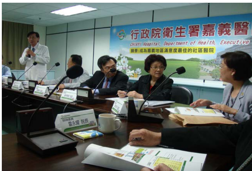
監察委員於 2011 年 4 月 14 日赴衛生署嘉義醫院履勘

將癌症治療、急診、洗腎等核心醫療業務外包；又各公立醫院2006至2008年度醫療業務疑有委託（合作）經營比重逐年增加，且缺乏自行培養所需醫護人力之機制，不利永續經營，涉有違失等情。監察院值日委員認為有深入瞭解之必要，而核批調查。