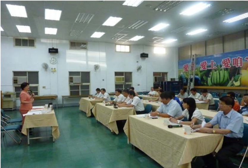
監察委員於 2010 年 8 月 20 日舉辦流浪狗管理南區座談會

農業委員會執行犬隻絕育政策不力，10 餘年來犬隻絕育率僅 3 成，任由犬隻過量繁殖，加重問題嚴重性，損及動物權益與環境涵容能力，顯然未善盡職責。又該會未能確實督導地方政府落實執行動物保護檢查，使得連續 4 年於公共場所稽查「寵物登記」之件數為 0 者高達 12 縣市，而連續 4 年未開出任何一張「棄養犬隻」罰單之縣市亦高達 19 縣市，顯見未善盡監督執法之責。