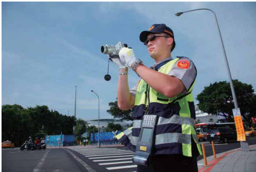
警察肩負執法者與民眾安全維護者之角色。

嘉義市警察局第一分局則是有7名員警集體包庇色情、賭博，派出所副所長更於酒店內尋歡作樂及強制性交未遂，警紀蕩然無存；臺中縣治安會報聯合稽查處理小組成員，則是涉嫌包庇8大行業及洩密案，經查係縣政府稽查員受賄及洩密，並非支援之臺中縣警察局員警所為。