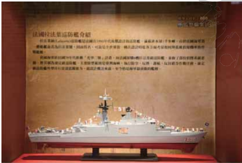
拉法葉巡防艦是全世界最先在艦體上全面引用匿蹤技術的艦艇，名列近代先進的軍艦之一。

提到「動搖國本」四個字，很多人都會聯想到「拉法葉艦」。因為在這件我國海軍史上最大宗的軍艦採購案的過程中，因為海軍上校尹清楓的意外死亡，掀開了壓力鍋，一舉爆出採購案與不法利益的掛勾情事。