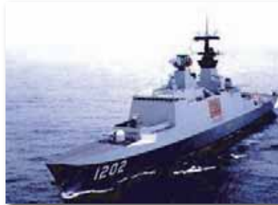
向法國購買之拉法葉軍艦，可抵禦核生化攻擊。

但只是追究行政責任是不夠的，因為本案的不當佣金金額龐大，讓國家人民蒙受重大損失，於是監察院於90年7月13日函請海軍總司令部儘速提出退還佣金之訴，以免貽誤時效，甚至請海軍總司令部就本訴訟案之進度，每隔3個月函報監察院，直至訴訟終結止，並主動督促最高法院檢察署拉法葉軍購弊案特調小組偵辦本案，提供相關資料及諮詢，對案情之釐清及佣金之求償，帶來不少的幫助。