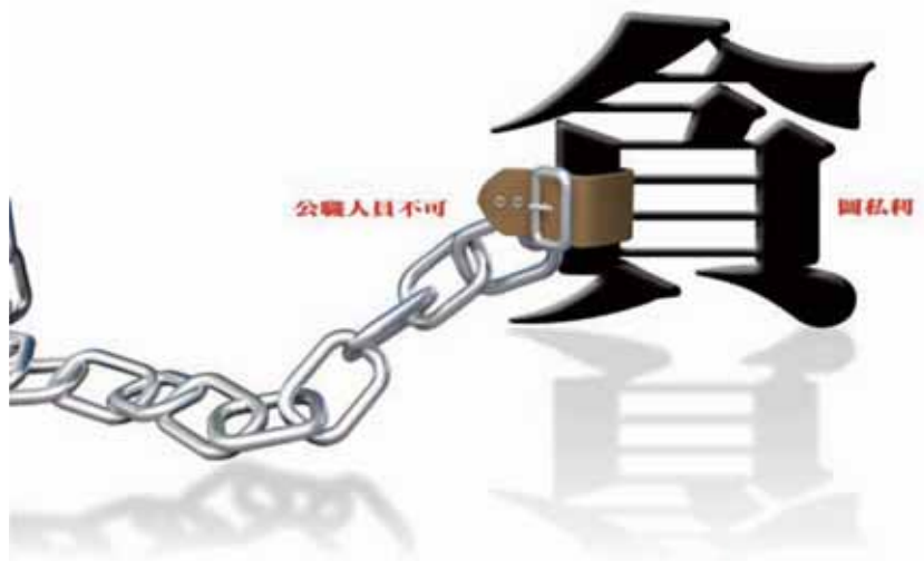
落實內控，改善風紀，杜絕警察貪瀆。(圖/監察院明鏡陽光海報設計競賽社會組佳作得主李雨儷)

而在監察院調查之後，也促使警察機關落實追究考監責任，如屏東縣政府警察局警員違失案之考監不周責任方面，該局後來重行檢討，計究責71員，其中記過2次17員、記過1次26員、申誡2次25員、申誡1次3員。