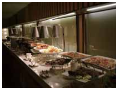
社會大眾應反思「貪便宜、追求美食」的心態是否正確。

經由這次大規模的食品危機總動員演練，塑化劑污染食品事件已然平息，但在衛生署公告停止適用「塑化劑污染食品處理原則」後，所策定研擬的各項確保民眾飲食安全措施，以及環保署在100年7月19日公告，將DEHP及DINP改列為第1類與第4類毒性化學物質管理等作法，都應該要早