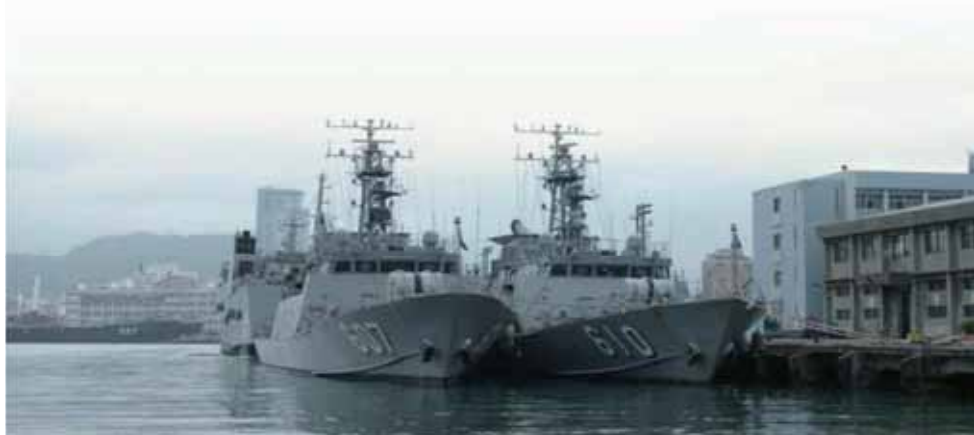
拉法葉採購案本是美事一樁，如今卻被法國稱作「世紀大醜聞」。（圖為錦江級巡邏艦）

皇天不負苦心人，監察院調查最後發現，6艘拉法葉巡防艦最後決標價高達146.97億法郎，平均每艘為24.49億法郎，但依據法國軍品出口委員會（CIEEMG）提供的佐證資料，申售價款6艘為114.54億法郎，平均每艘約19億法郎，如依法國總理府會議決議，總價款6艘為100億法郎，平均每艘為16.6億法郎；足以證明採購案確實涉有不當佣金存在。