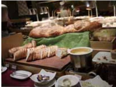
麵包配果醬很速配，但小心不良果醬也含有塑化劑。

此外，由於不肖業者以廉價塑化劑取代棕櫚油製成的起雲劑，導致小攤商、麵包店、早餐店受創最重，因為這些小資本商家沒有能力做好原料控管、難以確保品質安全等問題。