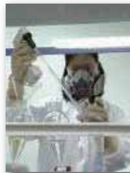
塑化劑事件爆發後，政府要求廠商在期限內強制檢驗可疑商品。

但DEHP、DINP等工業用塑化劑，怎麼會被使用作為食品添加物？這才是關鍵問題之所在。政府相關單位是否長期輕忽我國食品安全衛生業務，致其人力欠缺、預算短絀、法令不嚴及執行不力，更未能有效管理複方食品添加物，致爆發違法添加塑化劑情事，重創食品業鉅額產值與我國優良國際形象，實有深入調查的必要。