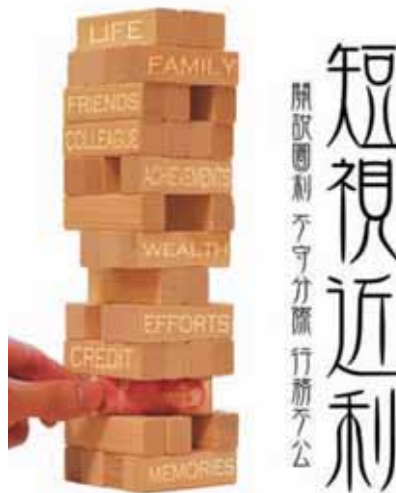
終結黑金政權，力行陽光法案。(圖/監察院明鏡陽光海報設計競賽大專組佳作得主陳昱安)

集體性貪瀆案件的形成，絕非一朝一夕，必然歷經一段漫長期間。風紀誘因場所，其實也多有評估提報列管，只要考監主管有心處理，應能減少及抓出少數的害群之馬。希望本案促使警察人事獎懲標準的重新調整，可以讓考監主管有更強力的後盾，落實深入風紀情蒐工作，杜漸於無形，重振警察風紀。