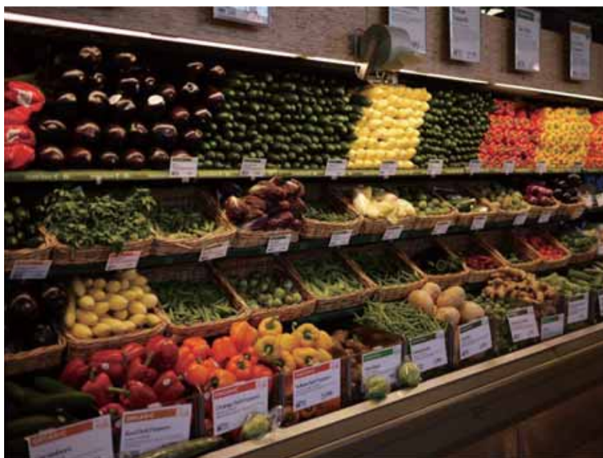
多吃蔬菜水果，少吃加工食品，為自己的健康把關。

監察院今後仍會督促衛生署、環保署本於職責，持續強化相關管理措施，以維護全民食的安全，保障健康權益。而藉由這個案例也讓國人未來在吃東西之前，可以再重新思考「慎選便宜貨，天然的最好」的至理名言，做一個更為精明的消費者！