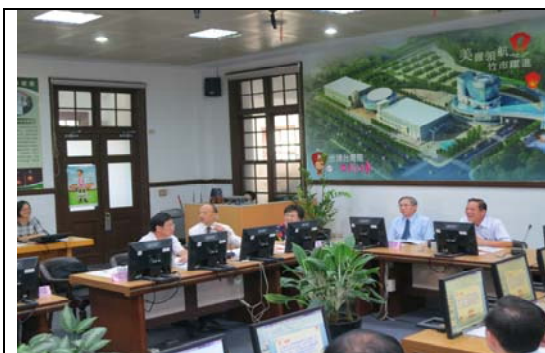
訪查新竹市政府，聽取簡報及進行意見交流