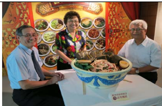
參訪「新竹市眷村博物館」之眷村飲食文化