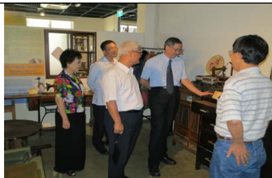
參訪「新竹市眷村博物館」之眷村居家文化