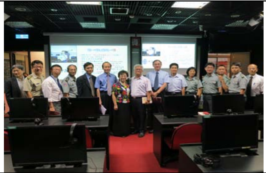
參訪「桃竹苗區校園安全維護及全民國防教育資源中心」之教師教學成長中心