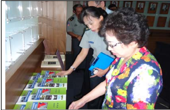
參訪「桃竹苗區校園安全維護及全民國防教育資源中心」之教材編制成果展示