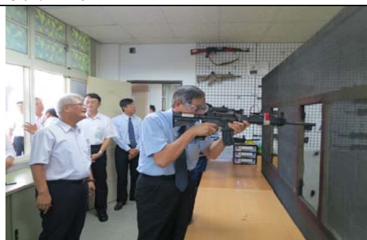
參訪「新竹市全民國防教育體驗館」，並實際體驗模擬射擊活動