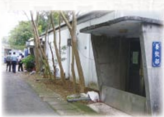
空軍作戰司令部案發現場全景

曾經轟動社會的江國慶案，在社會各界努力下，成為司法人權事件的重大指標。本案自江國慶父親江支安於85年首度向監察院陳訴，並於87年開始調查，歷經第2、3、4屆的監察