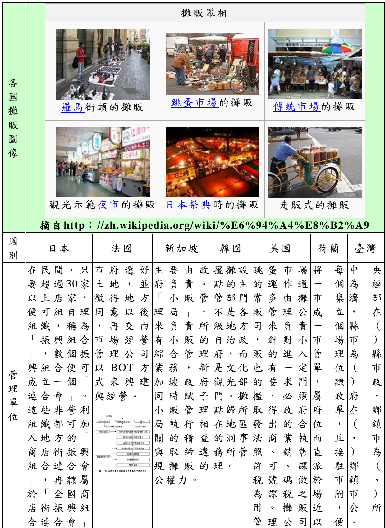
附表三十、各國攤販管理制度之比較